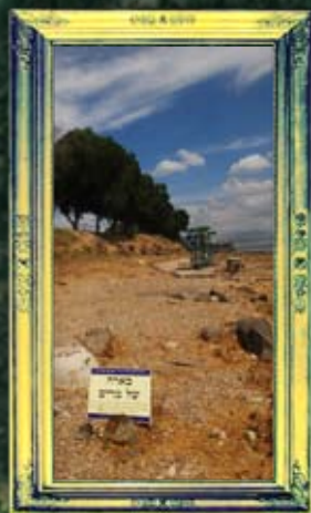
טבריה - באר מרים