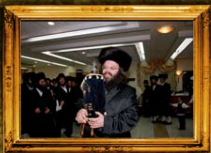
סיום כתיבת ספר תורה למו"ב מו"ש זמור תשס"ו