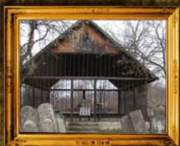
ויז'ניץ: לפני השיפוץ