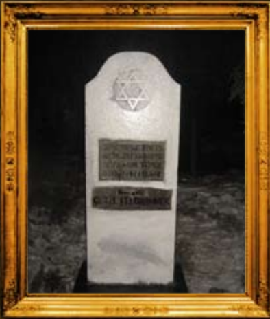
וואמה - הונגריה