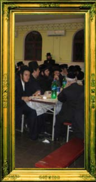
אומלים בהמנסת אורחים