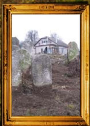
שאיגוד: ניקוי ושיפוץ בית הקברות ומאבק ענף להצלתו מהחילול