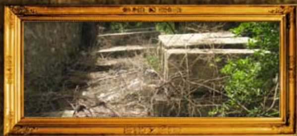
חלב - סוריה: נקוי בית הקברות העתיק בהאלב - התמונה לפני הניקוי