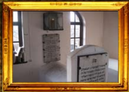
נר תמיד באוהל המגיד ממריטש והרהק רבי זושיא מאניפולי