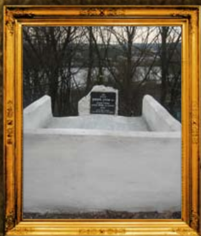
קופין: הרה"ק ר' אהרן מקופין