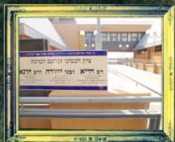
טבריה - רב חייא ורבנן