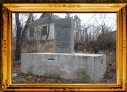
שפיקוב: הרהק רבי מרדכי משפיקוב ועוד - נכד הרהק מרדכי