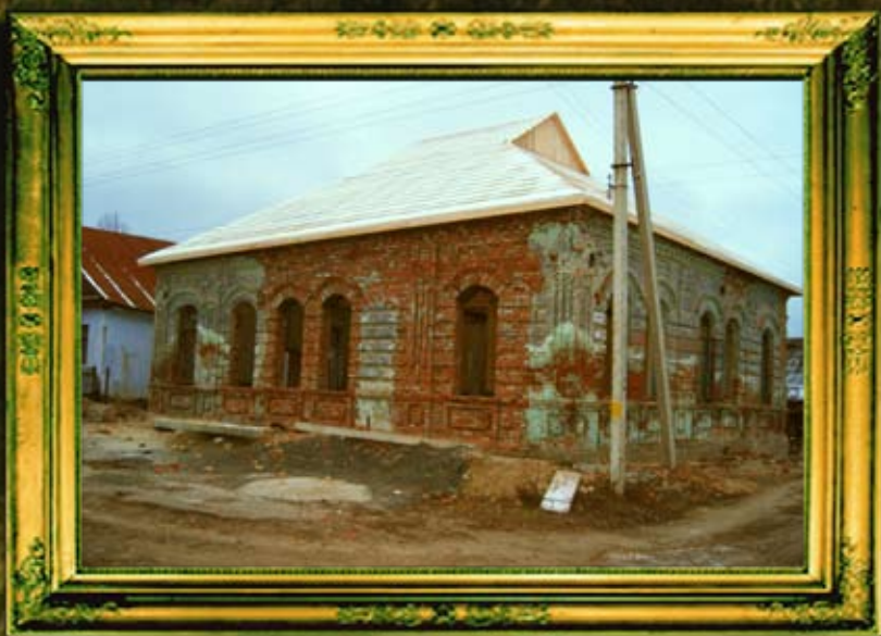
שיחזור 'דעם רבי'נס קלייזל' - ביהמ"ד של הרה"ק ה'אוהב ישראל' מאפטא