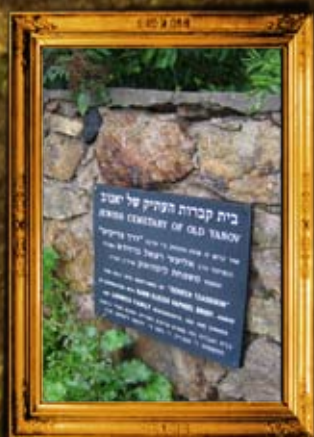
יאנוב: גידור וסימון בית החיים