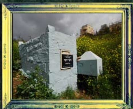
פקיעין - רבי יוסי לקוניא