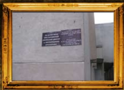
המלניצקי: ציון בית החיים