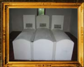
פולנאה: מצבות הרה"ק בעל התולדות, המוכית והיהודי שלצידו נטמנו