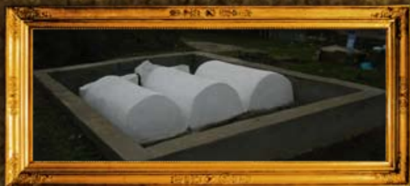
רוהטין: שיפוץ מצבות בביה"ח