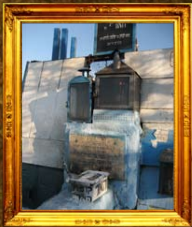
גליל: נר תמיד על ציון האר"י