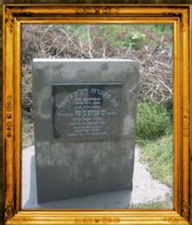
ניקופול בולגריה: סימון בית החיים