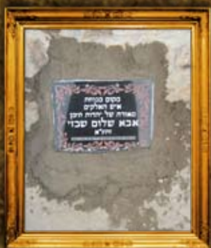
תעזו - תימן: רבי שלום שבאזי