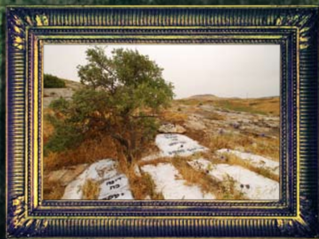
ארבל - ראובן, שמעון, לוי ודינה