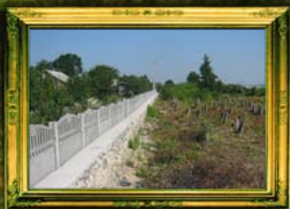
גידור בית הקברות החדש