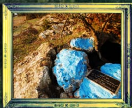
כפר ענן - ר' יעקב