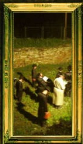
יסודות בית הכנסת הבה