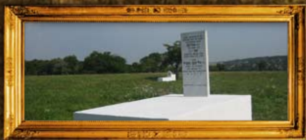
אומן. תלמידיו רבי נחמן מברסלב ורבי אברהם ב"ר נחמן חזן