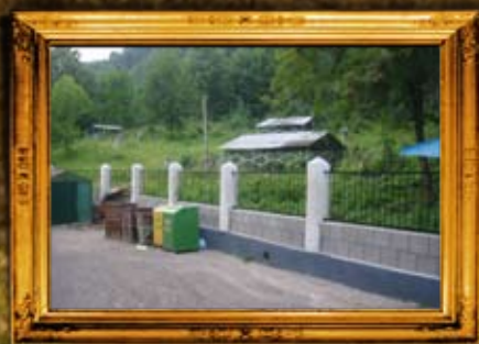
קוסוב: אדמו"רי בית קוסוב ויז'ניץ' וגידור בית החיים