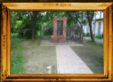
סטרי: ציון בית החיים