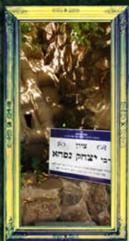
טבריה - רבי יצחק נפחא