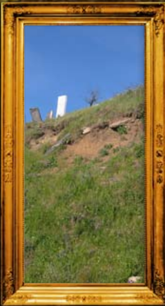
סטנוב: ציון ה'גנוי יוסף' וחלק גדול מביה"ק בסכנת קריסה