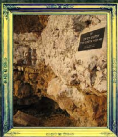
צפת - אנטיגנוס איש סוכו