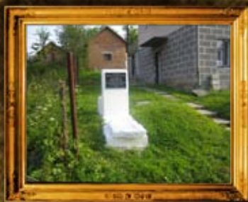
פרמישלן: הרה"ק רבי מאיר הגדול מפרמישלן