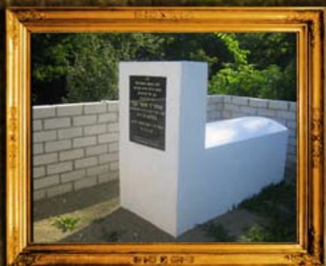
קוריץ: ציון הרה"ק בעל 'מעייין החכמה'