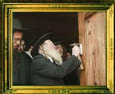
האדמו"ר מלעלוב זצ"ל בקביעת מזוזה בחנוכת ביהמ"ד העתיק