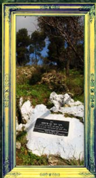
מירון - רבי יוסי בן קיסמא