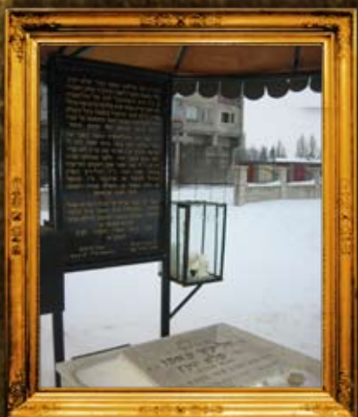
סליסטרה - בולגריה: ציון הרב"ק בעל 'פלא יועץ'