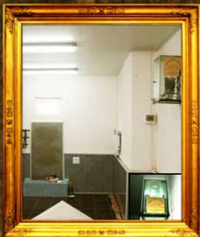
נר תמיד באוהל אדמו"ר האמצעי בניעז'ין