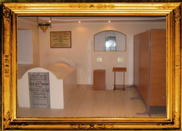
וולדיניק: פנים אהל ועזרת הנשים