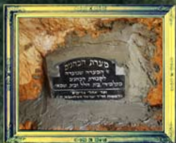
מירון - מערת כהנים