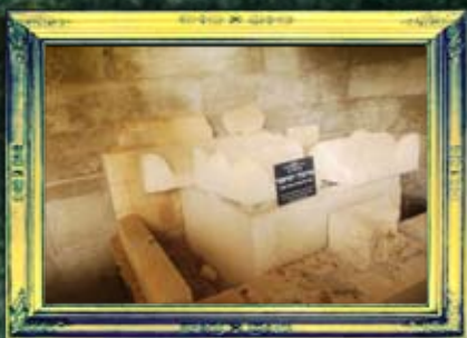
גוש חלב - אדרימולך ושראצר