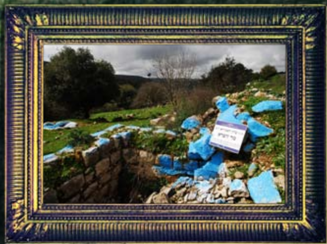
ברעם - מר זוטרא