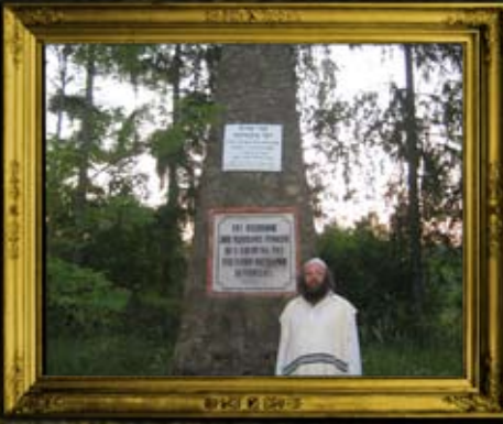
בוקובינקה: קבר אחים