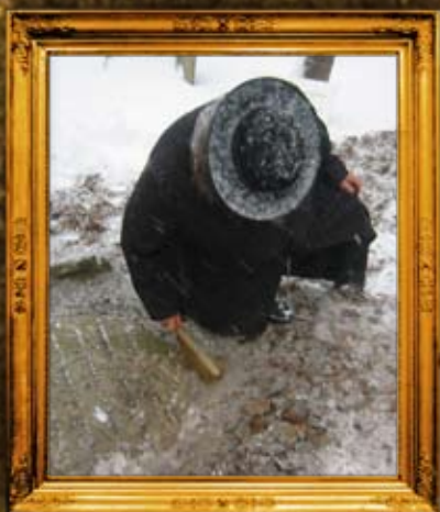
לינסק - פולין: גילוי המצבה