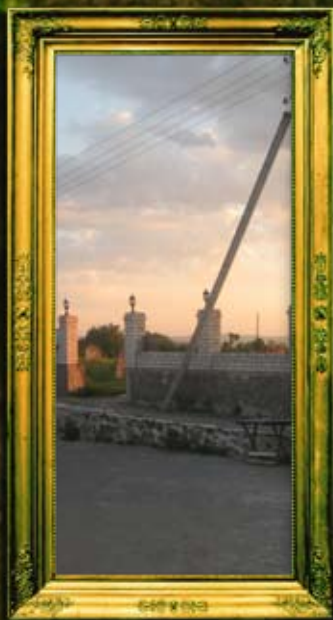
גידור בית החיים העתיק