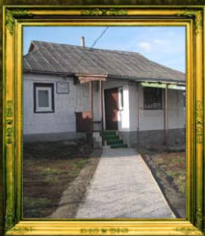
אחת מדירות הלינה