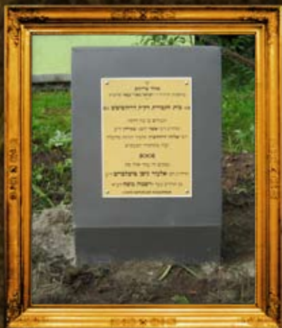
דרובניץ: ציון וסימון בית החיים ובו טמונים צדיקים זע"א