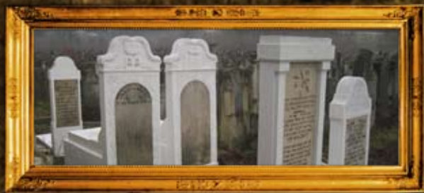
סרט - רומניה: שיפוץ חלקת הרבנים