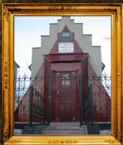
שדה לבן: אוהל רבי מרדכי מלוייעוו- טשרנוביל