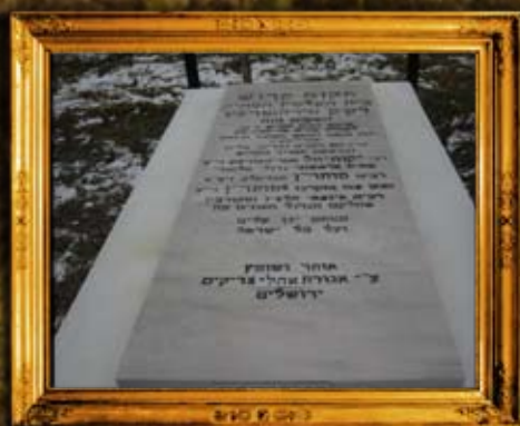
טרוביץ: ציון בית החיים