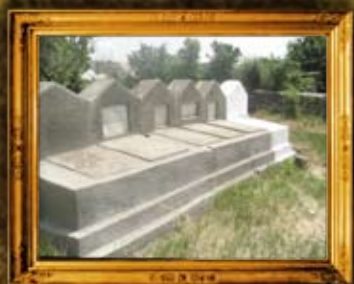
דוביסאר - מולדוביה: רבי מנדלי באר