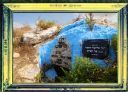
כרמיאל - רבי אלעזר הקפר ובנו בר קפרא