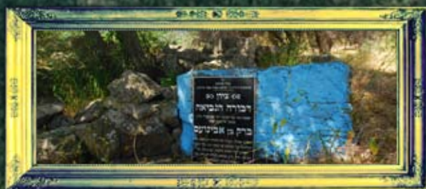
קדש נפתלי - דבורה הנביאה וברק בן אבינועם