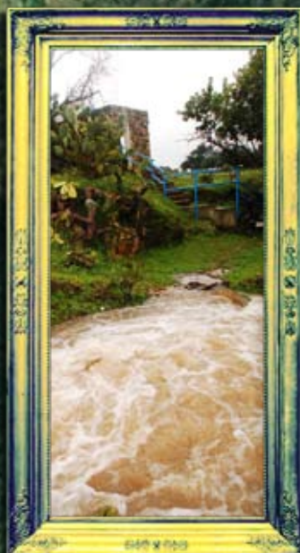
פרוד - נחמיה העמסוני