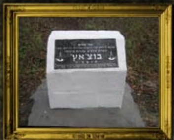
קבר אחים בבוטשאטש