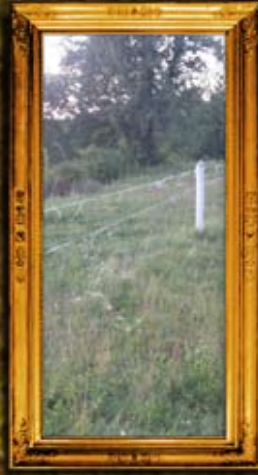
וורחיבקה: תחילת גידור ביה"ח