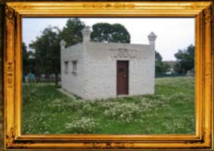
איבניץ, אוהל הרח"ק בעל 'אור המאיר'