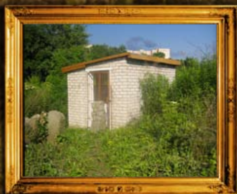
ז'יטומיר: אוהל רבי אהרן מזי'טומיר