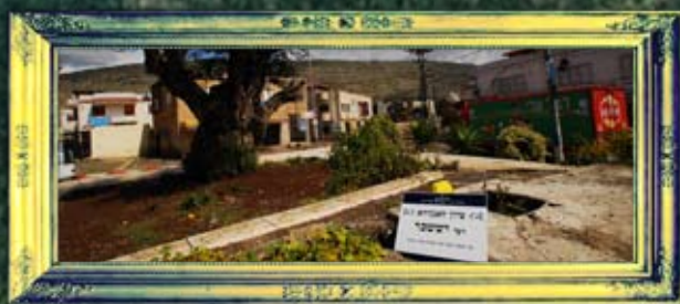
מנדה - רבי ישיכר דכפר מנדה