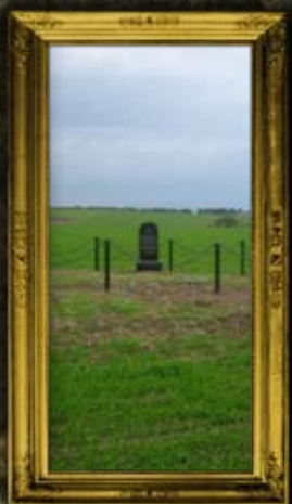
ציבליבקה: שישה קברי אחים לקדושי השואה