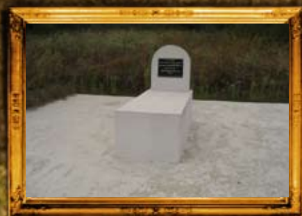
ביאלה דבסקא - פולין: מוצבת הרה"ק רבי אברהם משה מפשיסחא