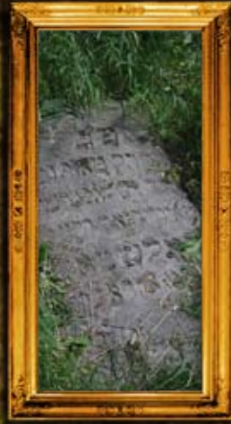
אוסטרובצה - פולין: הרח"ק מאיר יחיאל מאוסטרובצא - לפני השיפוץ