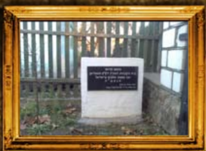
סאווין: ציון בית החיים העתיק