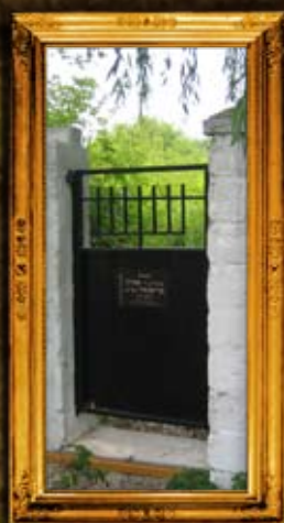
ז'יטומיר: דרך חדשה לאוהל