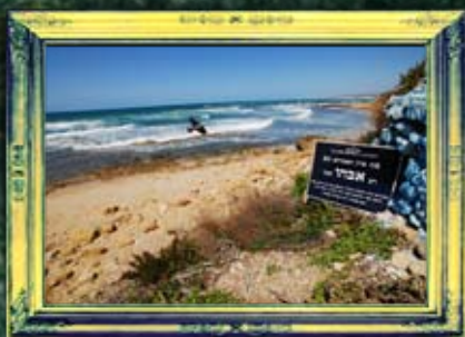
קיסריה - רבי אבהו ובנו