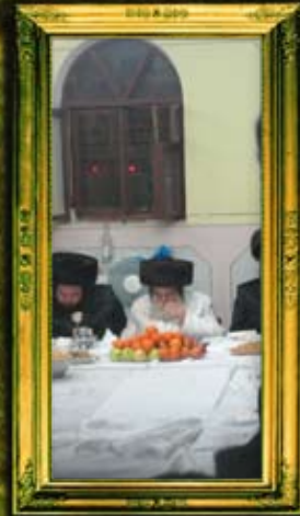
כ"ק אדמו"ר מתולדות אברהם יצחק