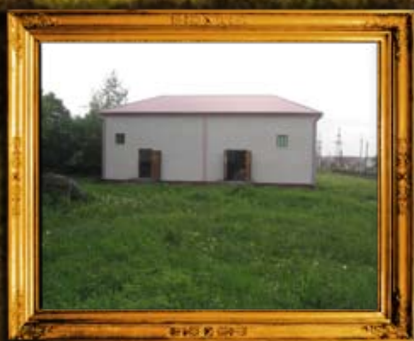
קומרנא: גג חדש ושיפוץ פנים אוהל אדמו"רי בית קומרנא