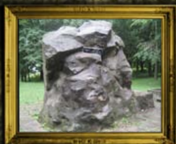
קוסוב: קבר אחים