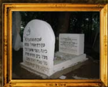
לינסק - פולין: אחרי השיפוץ