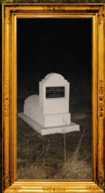
זיכלין - פולין: ציון הר"ק ר' שמואל אבא מזיכלין