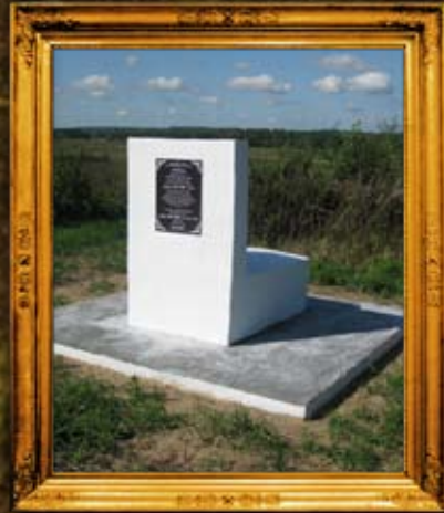
קאפוסט: ציון אדמו"ר מהרי"ל מקאפוסט ובנו