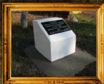
קרימנטשוק: סימון בית החיים העתיק של קרקוב - פרבר של קרימנטשוק