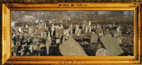
טולטשין: ניקוי בית החיים