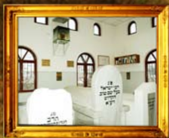
נר תמיד באוהל מרגא הבעש"ט במו' בוז'