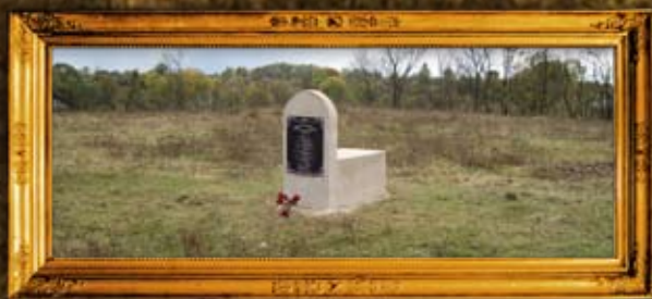
זסלב - ציון וסימון בית החיים