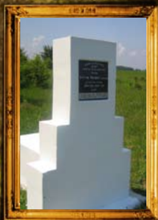
דשיב: ציון בית החיים הישן בדאשיב בו נטמן הרה"ק רבי שמואל אייזיק תלמיד הרה"ק מברסלב