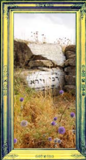
ארבל - ר' יצחק