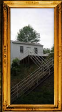
פאברייטש: הרה"ק ר' שלום שוכנא מפראביטש