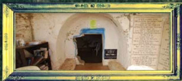
טבריה - רב אמי ורב אסי