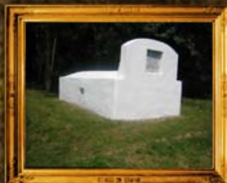
נמירוב: ציון בית הקברות, וקבר אחים בו טמון הרה"ק רבי יחזקאל מיכל מנמירוב