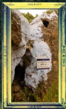
ואדי-עמוד - ד' חייא