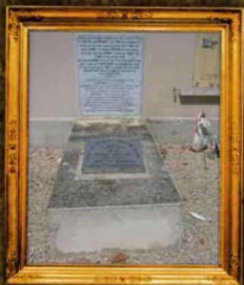
רמורפט - צרפת: רבינו תם, ר"י הזקן, רש"ם ועוד