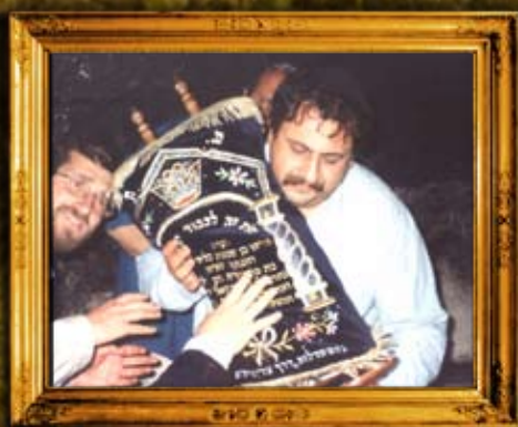
הכנסת ספר תורה לקבר ישי ורות