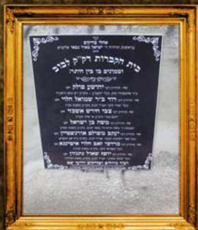
לבוב: שילוט בית החיים הישן בלבוב. השואה המקומי מבקש להשתלט על השטח