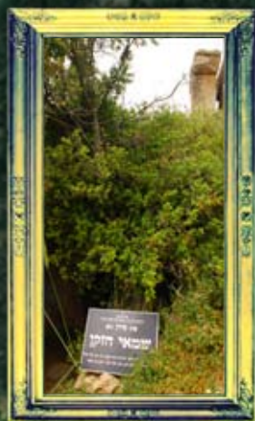
מירון - שמאי חוקן