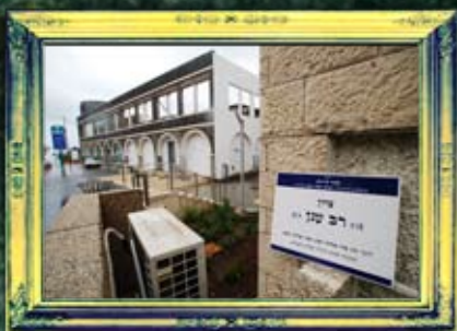
טבריה - רב ענן