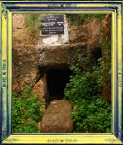
פרוד - רבי ישמעל