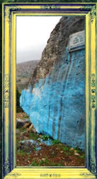
עכברה - רב ינאי