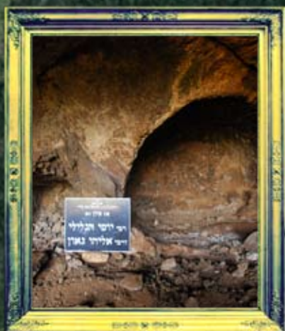
דלתון - רבי יוסי הגלילי ורבי אליהו גאון