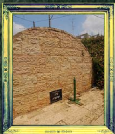
סולם - בית השונמית