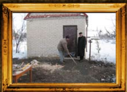
רחמסטרבקה: שיפוף אוהל הר"ק רבי יוחנן מרחמסטרבקה