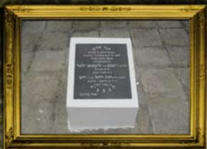
מאהלוב: קבר אחים