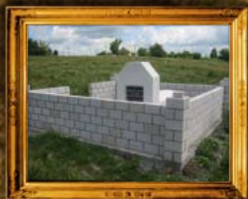
טעפליק: רבי יצחק לייב תלמיד הרה"ק רבי נחמן מברסלב