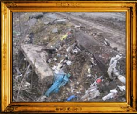
ויניצה: מאבק להצלת בית החיים בויניצא מחילול והרס