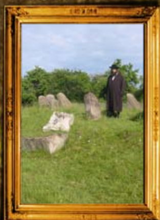
ליצס: ציון הרה"ק ד' מרדכי מליצס - לפני השיפוץ