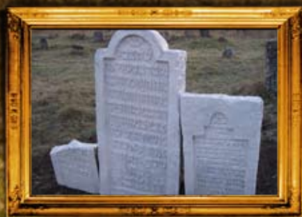
קופין: שיפוץ מצבות