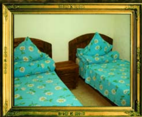
חדרי הכנסת אורחים