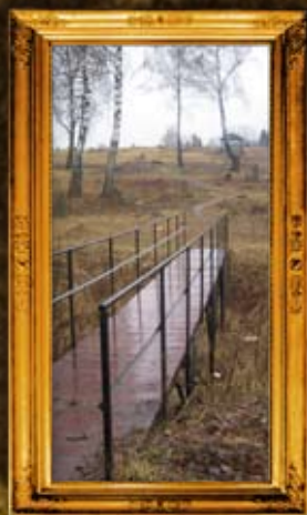
זויל: שביל גישה לבית החיים