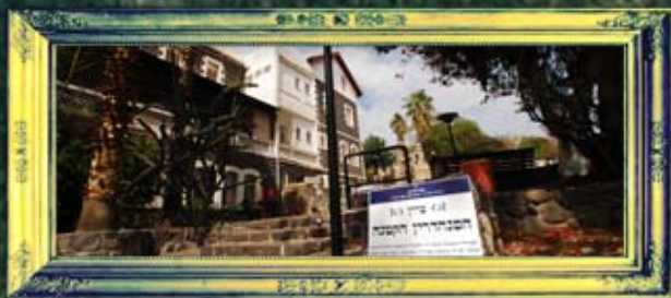
טבריה - סנהדרין קטנה