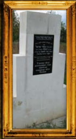
ויניצה: ציון בית החיים ומקום ציון הרה"ק בעל 'שער המשפט'