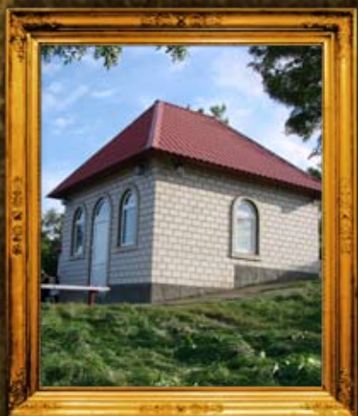
ברסלב: אוהל ציון רבי נתן מברסלב