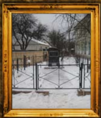
קורסטישב: גידור בית החיים