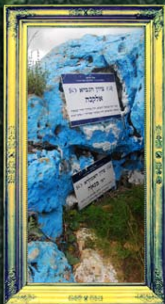
מביש צפת מירון - אלקנה ורבי בנאה