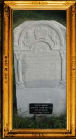
סטרי-סמבור: הר"ק רבי חיים משה בהר"ק אלכסנדר מקומונא