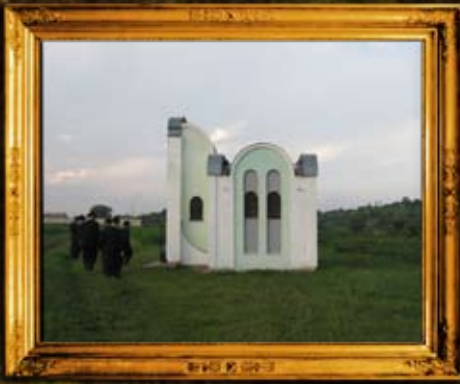
אינטזבקה: שיפוץ האוהל