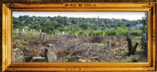
גורדוק: ניקוי בית החיים