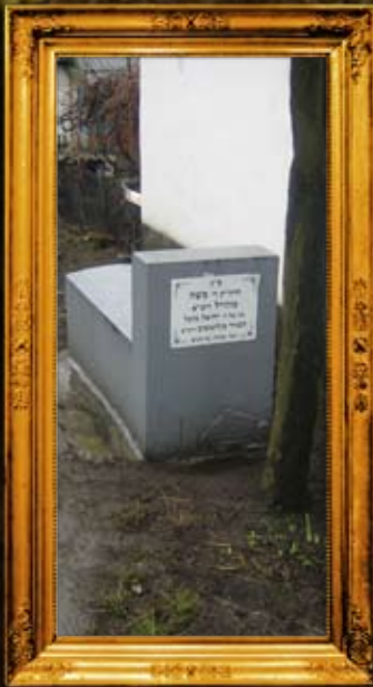
זוויל: ציון הרה"ק רבי משה מזוויל