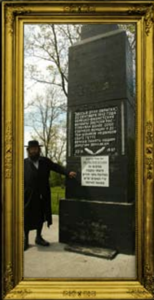
מזבז: קבר אחים לקדושי השואה