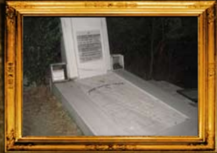
איסטנבול - טורקיה: הרה"ק רבי נפתלי כץ, בעל 'סמיכת הכמים'