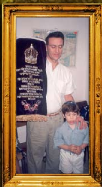
הכנסת ספר תורה לקבר שמואל הנביא