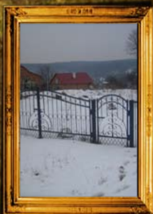
סטרוסב: גידור בית החיים