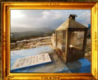
גליל: נר תמיד על ציון רבי שמועון תלמיד מוהר"ן מברסלב