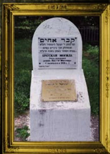
אומן: קבר אחים להרוגי הקומוניסטים בו נטמן הרה"ק רבי יעקב זיטומיר