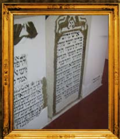
פולנאה: המצבות המקוריות