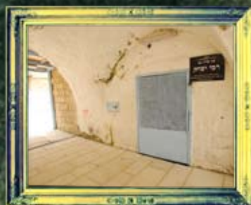
מירון - רבי יצחק