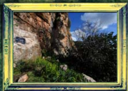
ואדי-עמוד - רבי יצחק מהזוהר