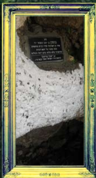
רומנה - בנימין בן יעקב