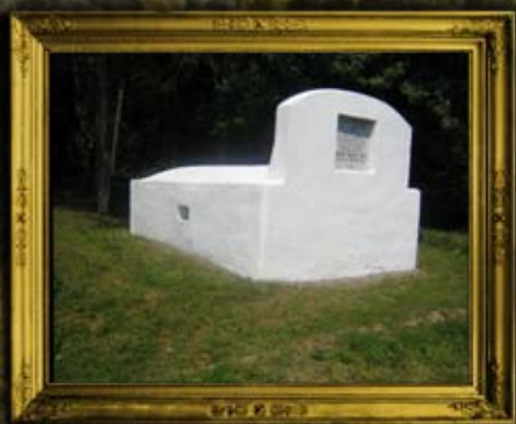
נמירוב: קבר אחים לקדושי ת"ח ות"ט