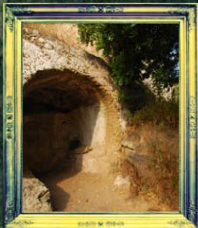
טבריה - יוחנן בן נורי