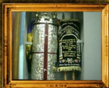
מזבוח: ספרי התורה שהכניסה האגודה לבית הכנסת שבבית הכנסת אורחים במזבוח