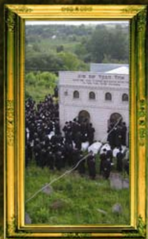
מתפללים באוהל הבעשט