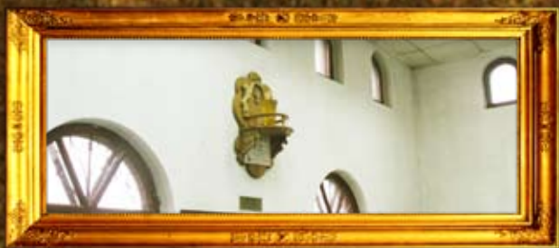
מזבוח: נר תמיד נוסף באהל