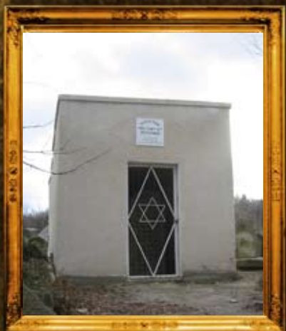
נדבורנה: אוהל הרה"ק רבי ישכר מנדבורנא