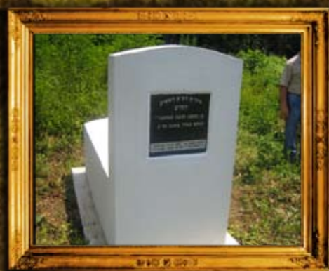
דשיב: ציון בית החיים ה'חדש' בדאשיב