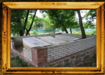
ליניץ: אוהל צדיקים