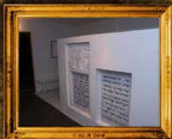
ז'לקוב: פנים האוהל והמציבות