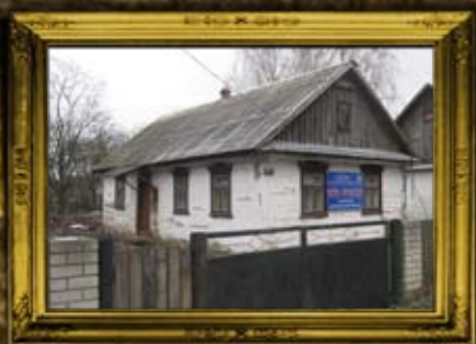
פולנאה: בית הכנסת אורחים מזל ביה"ק