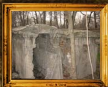
טשקנט - אוזבקיסטן: נכד ד' חיים מצאנו - לפני שיפוץ