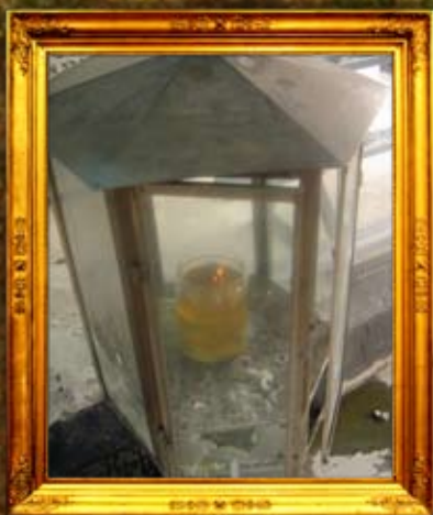
נר תמיד באוהל אדמו"רי בית ויז'ניץ