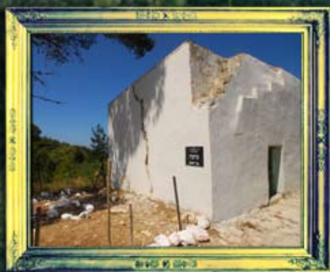
גדעון בן יואש