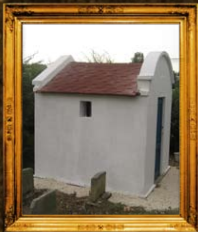
סקרנובין - פולין: אוהל הרה"ק רבי שמעון מסקרנובין