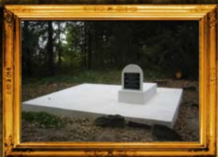
פשעדבוח - פולין: ציון אדמו"רי פשעדבוח