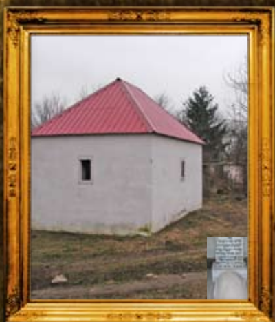
טארשא: אוהל הרה"ק רבי רפאל מבערשאד