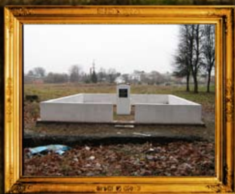
סמבור: הרה"ק ר' אורי מסמבור