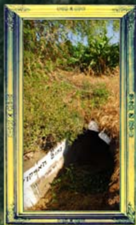
כפר-נחום - נחום האלקושי