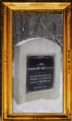
אוסטראה: ציון הר"ק רב י"ב מאוסטראה