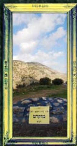
עמוקה - מוקרט התנא