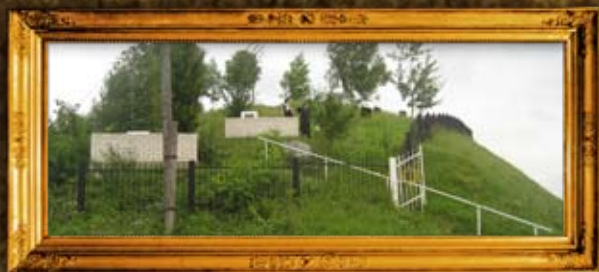
קורדיץ: הכניסה לבית החיים