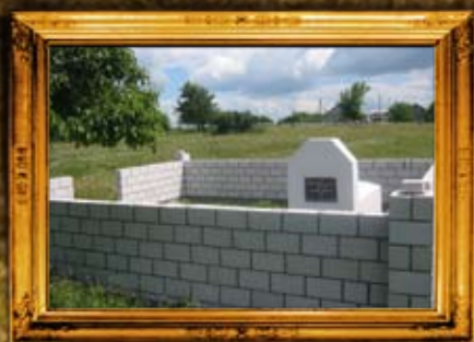
טעפליק: רבי שמואל אבא נכד הרה"ק רבי פנחס מקורניץ