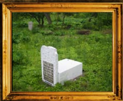
ברדיטשוב: מצבת ציון הרהק רבי ישראל נמד בעל "מעין החממה"