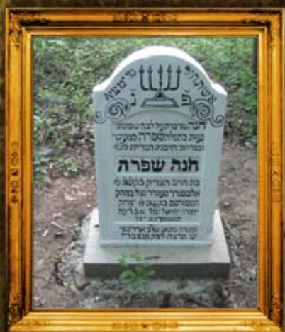
קולבסוב - פולין: מצבת הרבנית