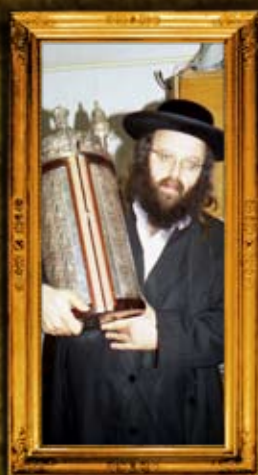
המנסת ספר תורה ספרדי לצייון מוהר"ן מברסלב באומן