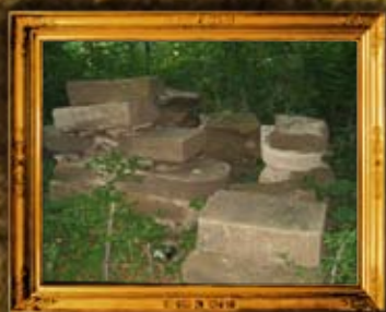
אוסטראה. עשרות מוצבות הוחזרו לבית החיים בעקבות פעילות האגודה