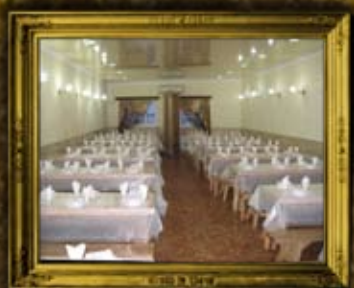
אומן: הכנסת אורחים