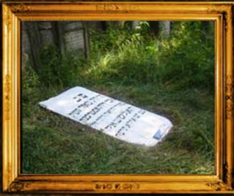
אוסטרובצה - פולין: אהרי השיפוץ