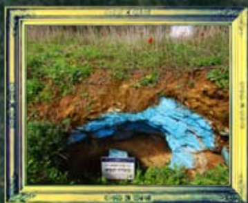
ברעם - עובדיה הנביא