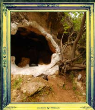
מירון - רבי טרפון