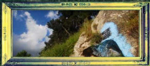
מירון - רבי יוסי הטופא