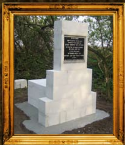
ציזיקוב: ציון וסימון בית הקברות