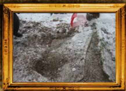
לינסק - פולין: הרה"ק רבי מנחם מנדל מלינסק אבי הרה"ק רבי נפתלי מרוזנשטיין - לפני השיפוץ