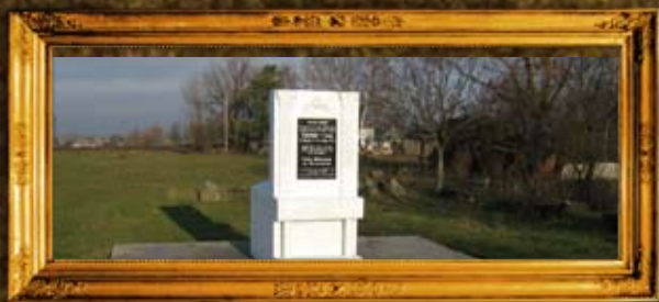
אוסטרופולי. ציון הר"ק רבי שמשון אוסטרופולי הי"ד