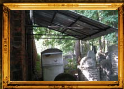
וורשא - פולין: המהראי"ל צינץ