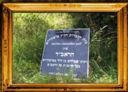
פושקויד - צרפת: מאמצים לסימון בית החיים בו טמון הראב"ד בעל ההשגות