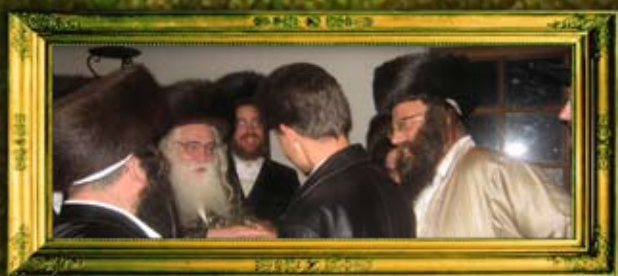
הגראי"ה בוק שליט"א חבר ועד הרבנים של האגודה