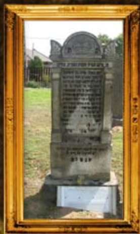
איברני - הונגריה: תיקון מצבות