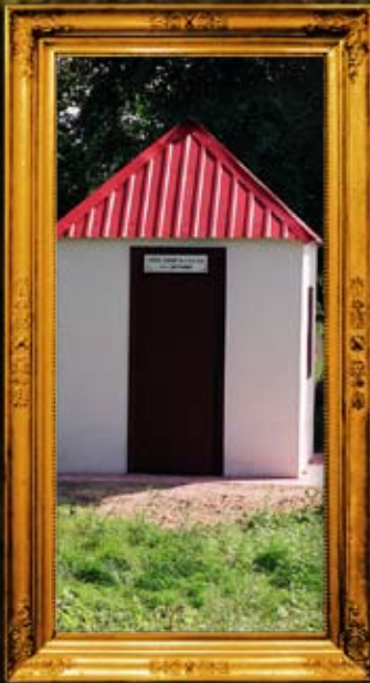
סאוורין: אוהל רבי שמעון שלמה מסוורין ורבי אברהם הירש