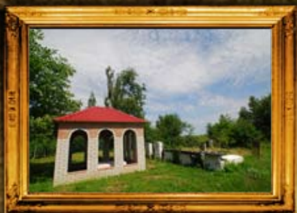
קמוניקא: אוהל האחים הקדושים מקמוניקא. תלמידי הבעש"ט