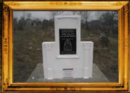
טלוסט: 'אמא של מלכות' - ציון אם הבעש"ט