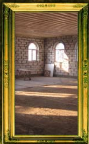
חדר האוכל החדש שנבנה כעת במו'צ'וו