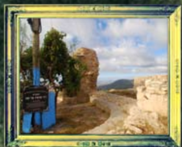
רבי בנימין בר יפת