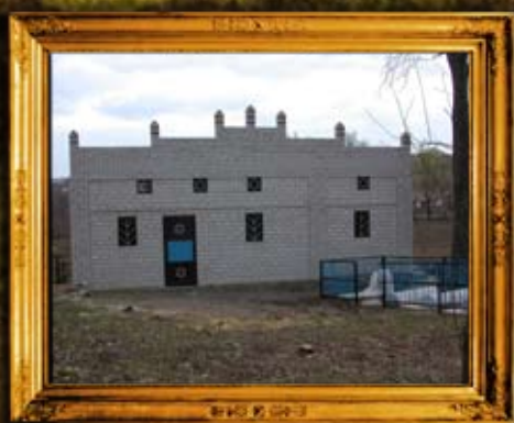
צ'צ'לניק: אוהל רבי משה צבי מסורון