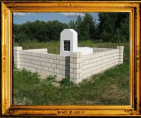
סטולין - בלרוסיה: אהל הרה"ק רבי מרדכי לעבאוויטש