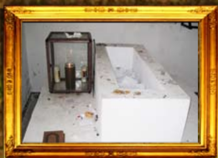
נר תמיד באוהל הרה"ק מטזלנא