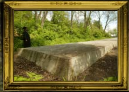
מזבז: קבר אחים לקדושי השואה