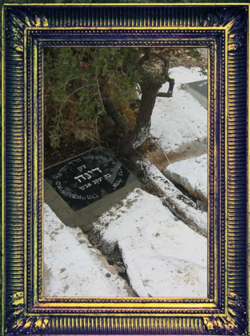
ארבל - ראובן, שמעון, לוי ודינה משבטי י-ה