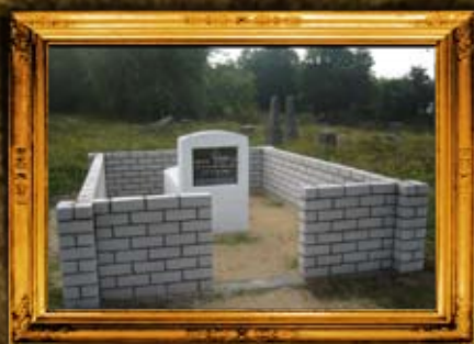
סמילא: הרה"ק רבי ישעיה מדינובין