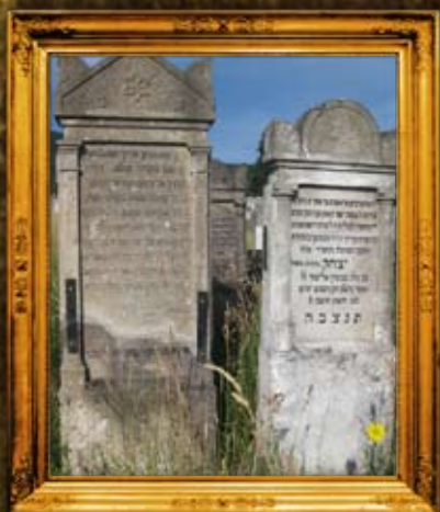
איהל - הונגריה: תיקון מצבות