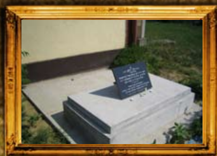
קאליב - הונגריה: הרב"ק רבי יעקב מפריסטיק