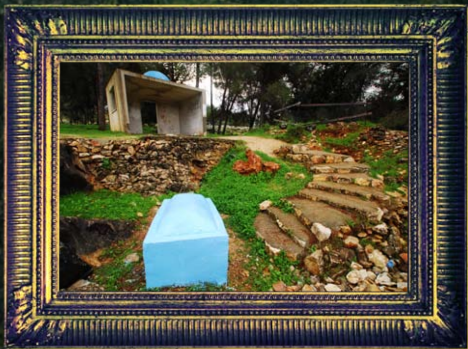
צפת - חוצפית המתורגמן