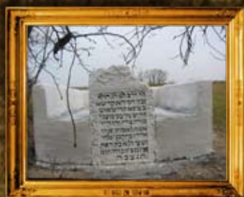
קופין: מצבת הרה"ק מקופין