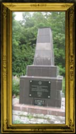
באר: קבר אחים להרוגי השואה