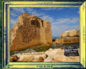
עכו - אלעזר השמונאי