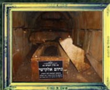
כפר-נחום - נחום האלקושי