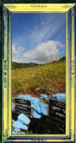
קציון - ריש לקיש ור' יוחנן