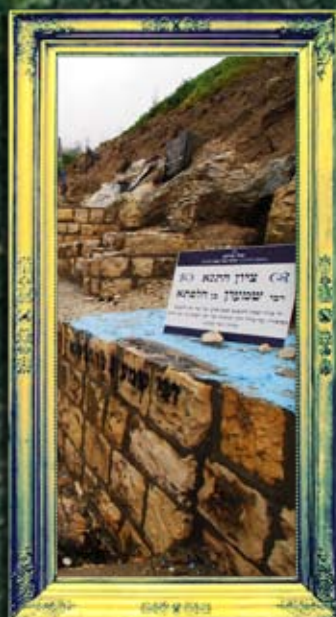
צפת - ר' שמעון בן הלפתא