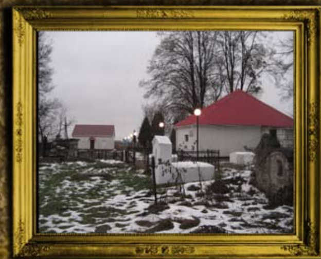
ניעוין: אוהל אדמו"ר האמצעי. ברקע: בית הכנסת אורחים