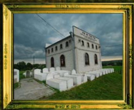
אוהל ציון הבעשט