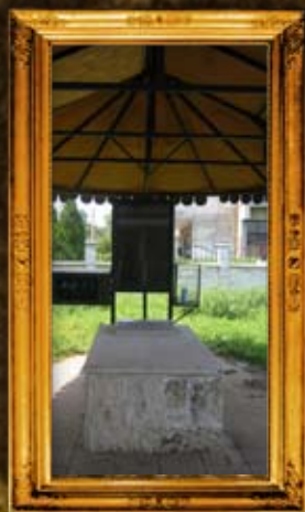
סליסטרה - בולגריה: ציון בעל הפלא יועץ