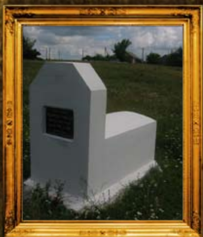
טעפליק: רבי אהרן קיבליטשר