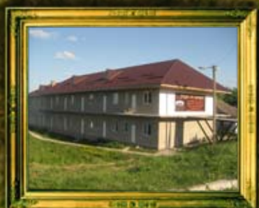
בית הכנסת אורחים החדש, העומד באמצע בנייתו