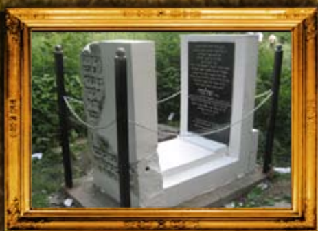
לובלין - פולין: ציון המהרש"ל אחרי השיפוץ