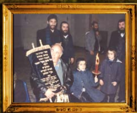
הכנסת ספר תורה אשכנזי לצייון מוהר"ן מברסלב באומן