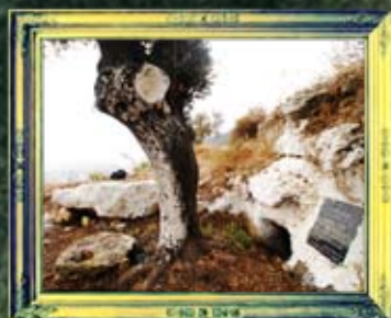
חצור - אבא חלקיה וחנן הנחבא