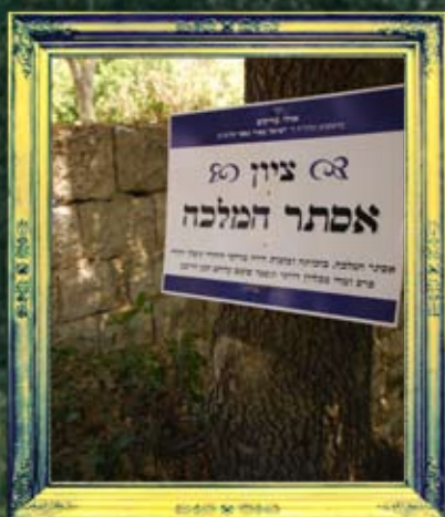
ברעם - אסתר המלכה