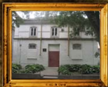
סליסטרה - בולגריה: בית המנסת העתיק של סליסטרה