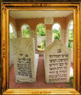
קמוניקא: פנים האוהל