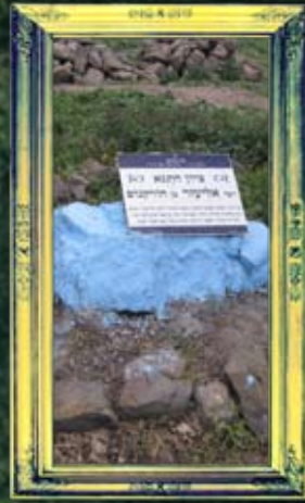
עלמא - רבי אליעזר בן הורקנוס