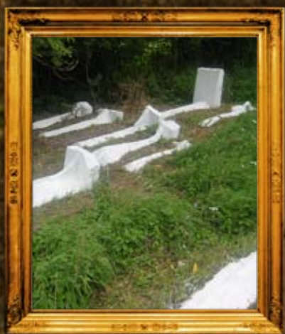
לדיזיון: חידוש מצבות וניקוי בית החיים