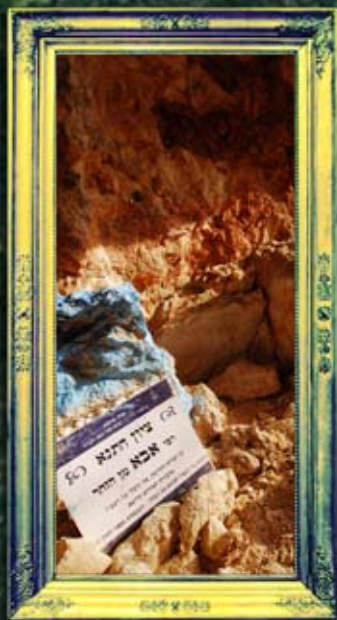
ואדי-עמוד - רבי אבא