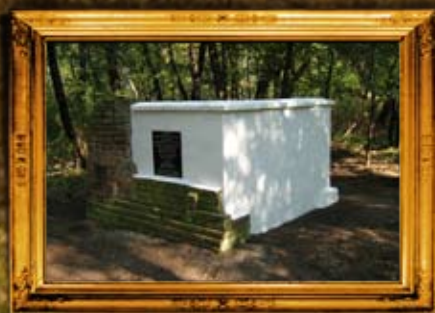
קרימנטשוק: שיפוץ אהל צדיקים וסימון בית החיים