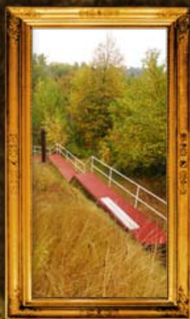
ברסלב: שביל הגישה לבית הקברות