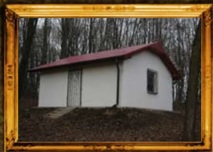
ירוסלב - פולין: אוהל הרה"ק רבי שמועז מירוסלב