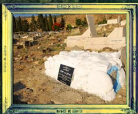
ר' נתן בר יהודה