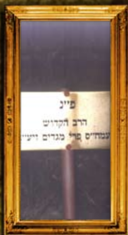
פרינקפורט דאודר (סולוביצא) - פולין: איתור מקום קברו של הפרי מגדים