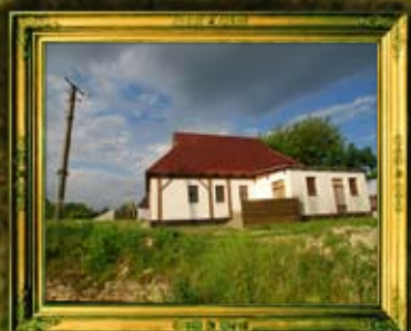
בית מדרשו העתיק של הבעש"ט ששוחזר על ידי האגודה