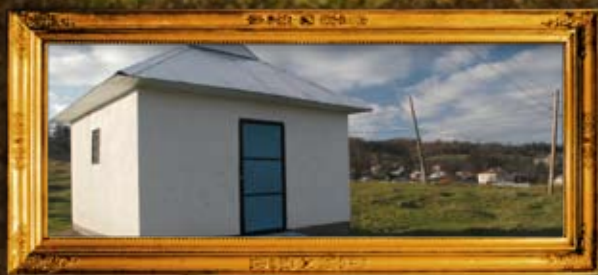
דולינ: אוהל הרה"ק רבי משה מדולינא תלמיד הבעש"ט