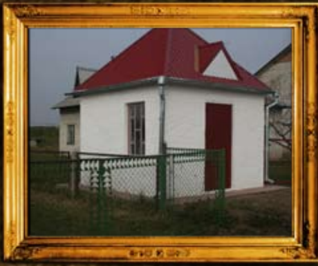
בדווטשין. בית מדרשו העתיק של הבעשט ששוחזר על ידי האגודה