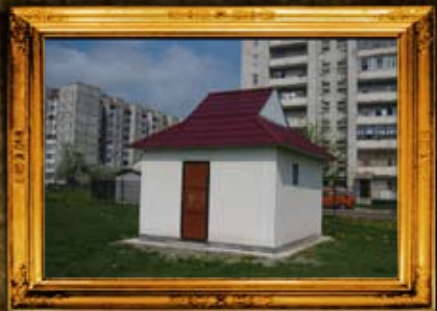
קאלוש: ר יצחק קאליש