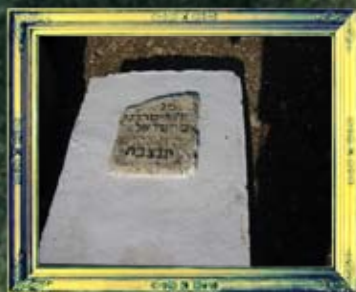
טבריה - בנו של ד' ישראל