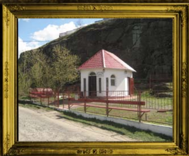
ברסלב: הכנסת אורחים