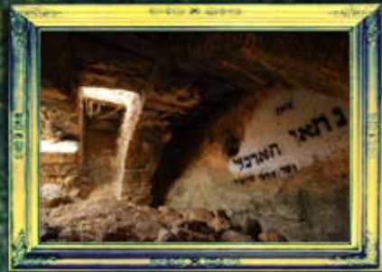
ארבל - נתיא הארבל