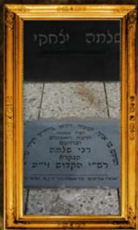
טרויש - צרפת: מקום קבורת רש"י המדוש