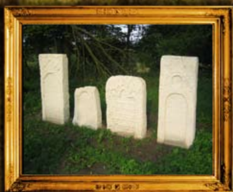
פולנאה חדש: חלקת רבנים בבית החיים בפולנאה חדש