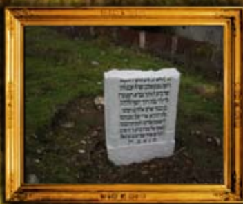
רוהטין: שיפיות מצבות בביה"ח