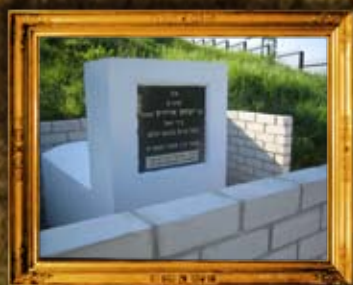
קורדיץ: ציון בעל ברית כהונת עולם