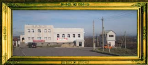
בית המנסת אורחים סמוך לציון