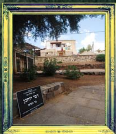
טבריה - רבי יוחנן