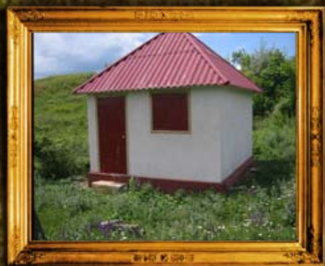
ימפול: אוהל הרה"ק רבי ברוך מ"מפול