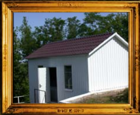
פאברייטש: אוהל הרה"ק רבי שלום שוכנא מפאברייטש