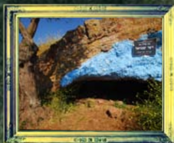
דלתון - רבי שמואל בן רבי יוסי הגלילי