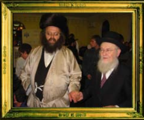
רבה הראשי של אוקראינה הרב חייקין שליט"א