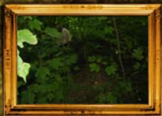
ליטוין: ציון הרה"ק ר' מנחם נחום מליטין - באיתגורו, לפני השיפוץ