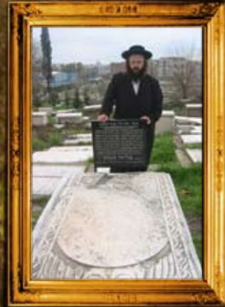
איזמיר - טורקיה: הרה"ק בעל שבת מוסר