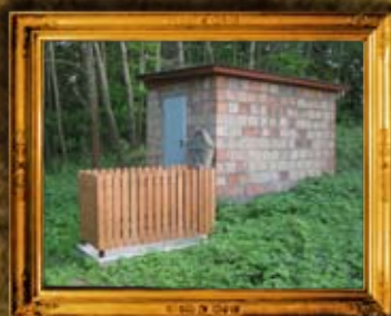
קולבסוב - פולין: אוהל רבני קולבסוב ורבי אהרן טייטלבוים