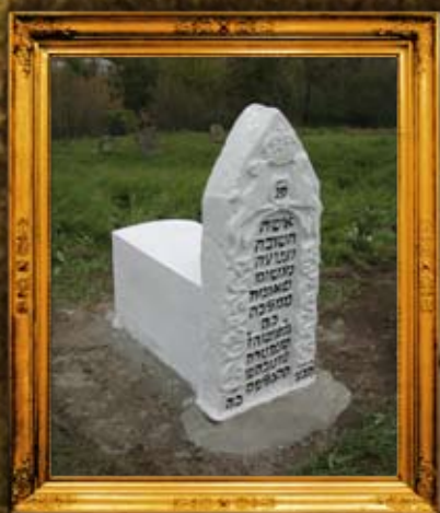
קופייגורוד: ציון הצדקת מלכה