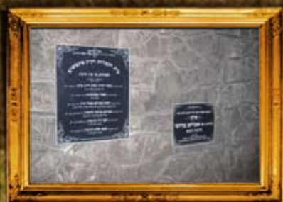
פינטשוב - פולין: ציון בית החיים וציון הרה"ק רבי אברהם מרדכי הורביץ, אב"ד פינטשוב ועוזר צדיקים