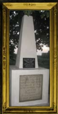
לדיזין: קבר אחים