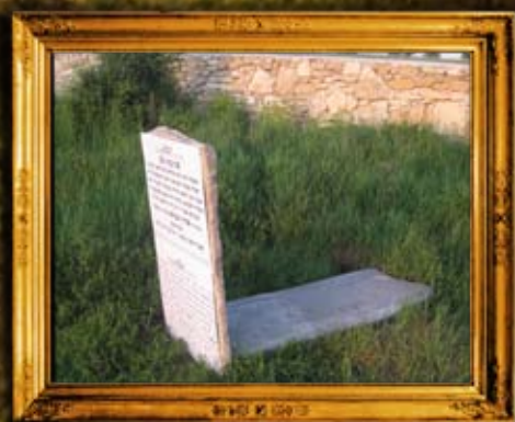
המלניק - פולין: שיפוץ ציון הג"ד אהרן שמואל קאידנובר, אב"ד קראקא