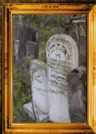
קיטוב: שיפוץ חלקת רבני קיטוב