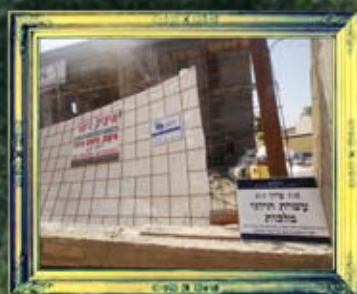
קיסריה - עשרה הרוגי מלכות