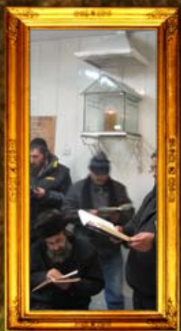
נר תמיד על ציון הרה"ק רבי נתן מברסלב