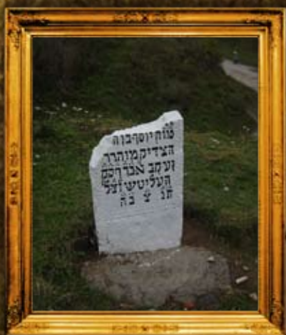
רוהטין: שיפות מצבות בביה"ח