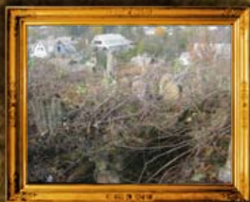
טולטשין: בית החיים לפני הניקוי