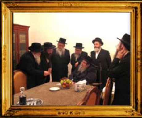
בעלו: עם בן אדמור מבעלו בחדרו בבית המנסת אורחים בבעלו