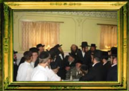
ב"ק אדמו"ר מתולדות אהרן שליט"א