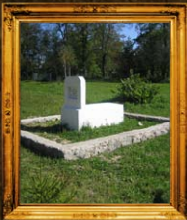
פולנאה חדש: ציון הרה"ק ר' דוד פירקיס תלמיד הבעש"ט