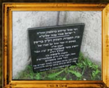
בייסק - אוהל ציון מרן בעל 'בית הלוי' ובית הקברות העתיק