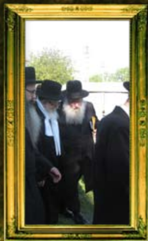
כ"ק אדמו"ר מסקווירא שליט"א והגר"א שלינגר שליט"א