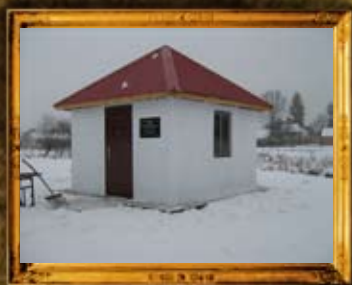
מקדוב: אוהל הרה"ק רבי מנחם נחום ממקדוב, בן הרה"ק רבי מורדכי מטשרנוביל