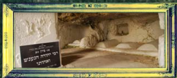
רבי יהודה הנענש