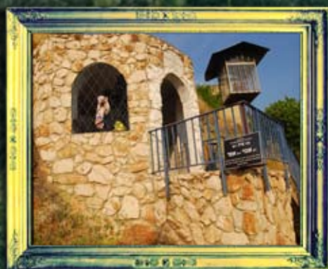
טבריה - רב אמי ורב אסי