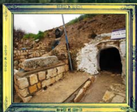
הרדוגי בית דין