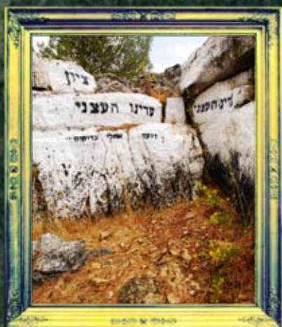
צפת - עדינו העצני