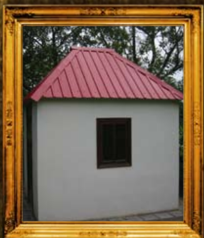
מבלטש: אוהל הרב"ק רבי אהרן מטעטיב נכד הבעש"ט