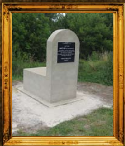
דובנא: הגאון רבי יוסף יוסקא