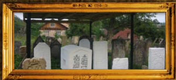
קיטוב: הרה"ק רבי משה מקיטוב