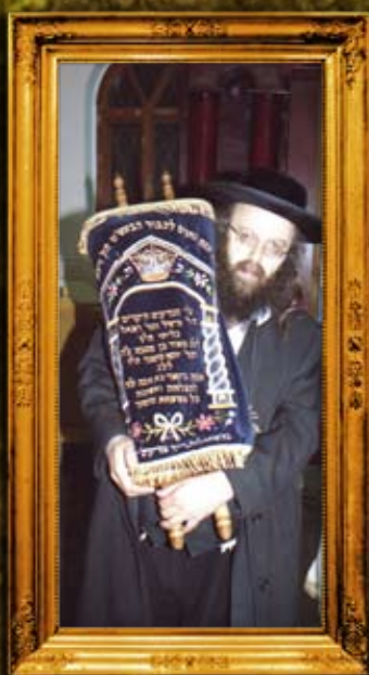
אחד מספרי התורה שהוכנסו למו"ב