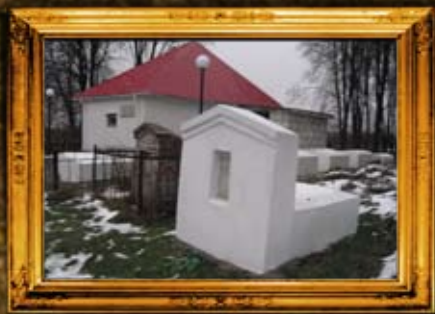
ניעז'ין: ציון החסיד רבי מנדל חן