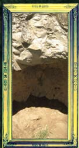
עין זיתים - עילאי