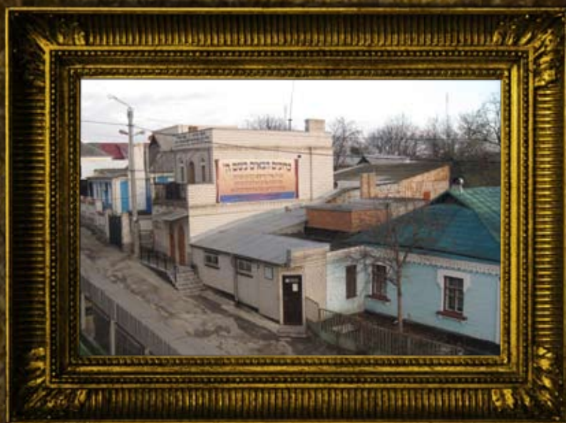
אומן: הכנסת אורחים, מקוה וחדרי נוחיות