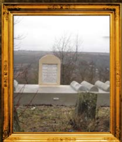
ז'נקוב: אדמור"י בית ז'נקוב