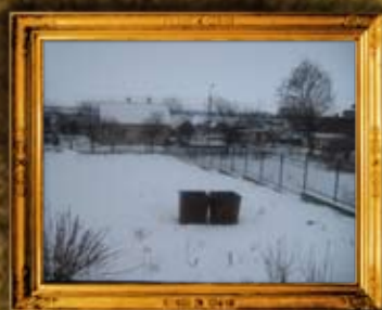
בעלז: גדר בית הכנסת הישן