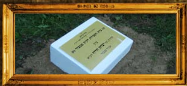
סמבור: בית הקברות הישן