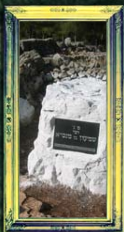
יער הבעש"ט - רבי שמעון בן מנסיא