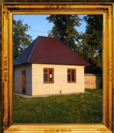
ז'לקוב: אוהל בעל התבואות שזר