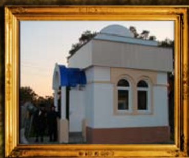
שפיטובקה: אהל הרה"ק רבי פנחס מקורדיץ - וגידור ביה"ח