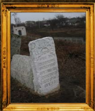
צ'צ'לניק: הרבנית מסוודין