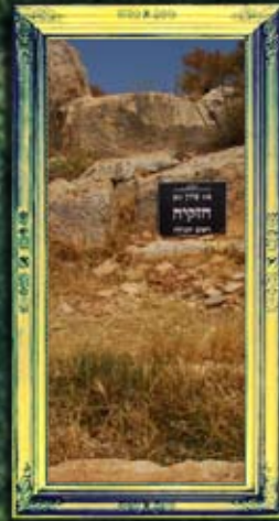
ארבל - חוקית ראש הגולה