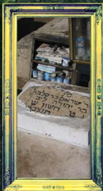
טבריה - ר' ישראל קרדונר