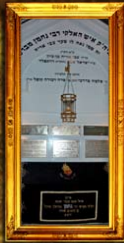
נר תמיד על ציון הרה"ק מזהר"ן מברסלב