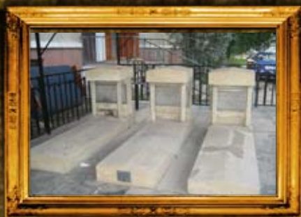
הוסיאטין: שיפוץ קברי צדיקים