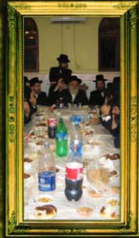
ב"ק אדמו"ר ממונקאטש שליט"א