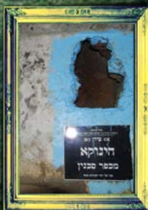
צפת - הימוקא