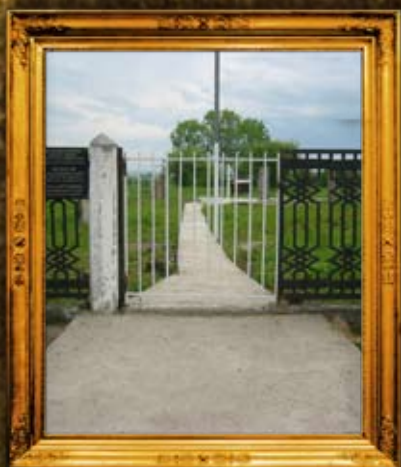
בעלז: גדר ושער בית קברות חדש