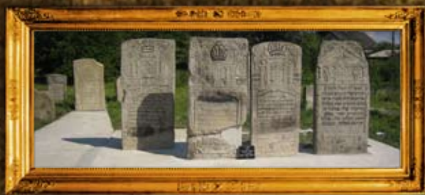
בעלז: ביצוע שיפוץ ושיקום ציוני אדמו"ר"י בית בעלז