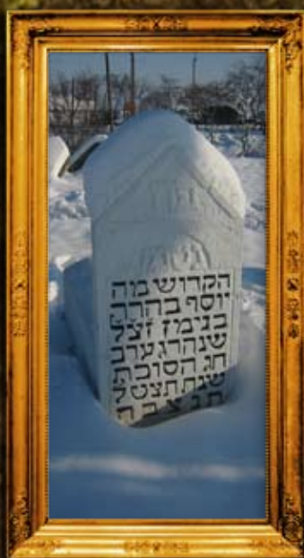
יבלנוב: שיפוץ מצבות