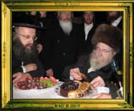
ב"ק אדמו"ר מסדיגורא שליט"א