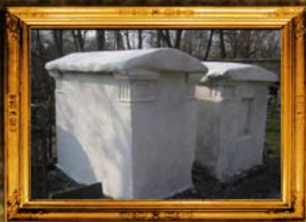
טשקנט - אוזבקיסטן: נכד ד' חיים מצאנו אחרי שיפוץ