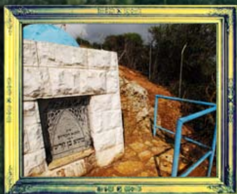
עילבון - רבי מתיא בן חרש