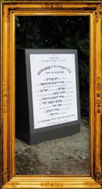
סטנסלב - ציון וסימון בית החיים בו טמונים, בין היתר, צדיקים יסודי עולם זיע"א