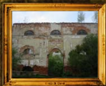
סטרי: בית המנורה של בעל הקצות - לפני הניקוי