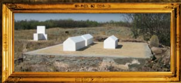
פרבמיסק: שיפוץ קברי צדיקים וציון בית קברות