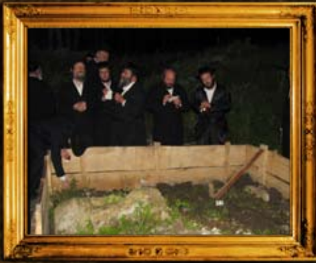
סטורליסק: אוהל הר"ק רבי אורי מסטורליסק - תחילת העבודות