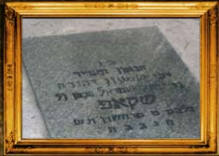
גרודנא - בלרוסיה: רבי שמעון שקאפ