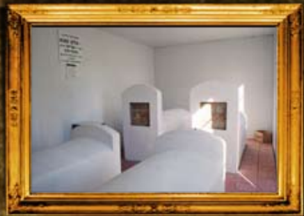
פאברייטש: פנים אוהל הרה"ק מפאברייטש