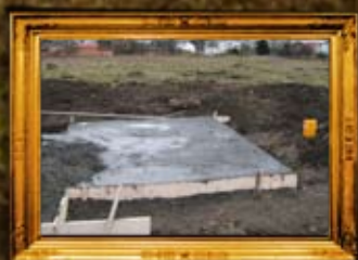
סמבור: יסוד לאוהל האלטשטאט'ער רב