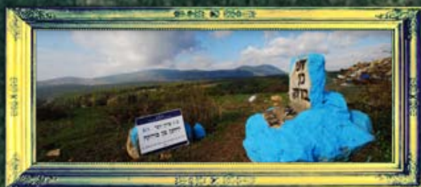
כביש צפת מירון - רבי יוחנן בן ברוקא