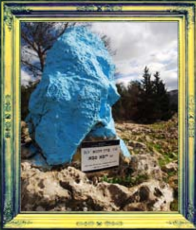
יער הבעש"ט - ר' ייבא סבא