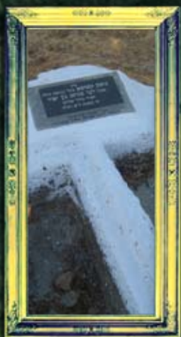
ברעם - נחמן קטופא