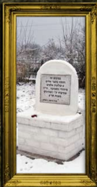
אומן: קבר אחים להרוגי תר"פ