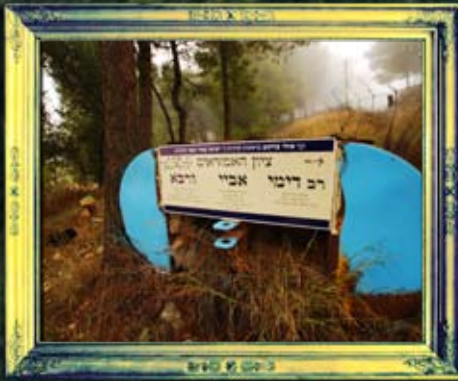
אבנית - אבן זכרון