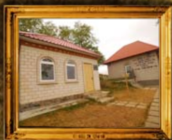
ברסלב: אוהל וחדר המהנים