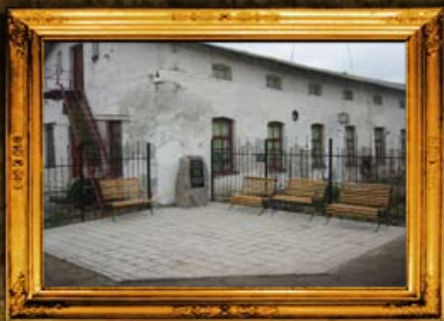
אומן, מקום הסתלקות הרה"ק רבי נחמן מברסלב