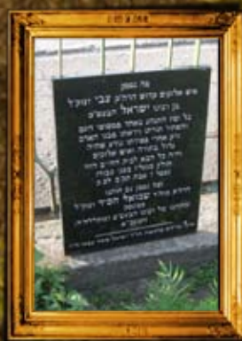
פינסק - בלרוס: הרה"ק רבי צבי בן מרנא הבעש"ט הק"