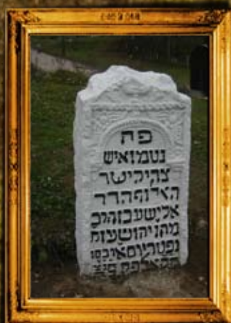
רוהטין: שיפוף מצבות בביה"ח