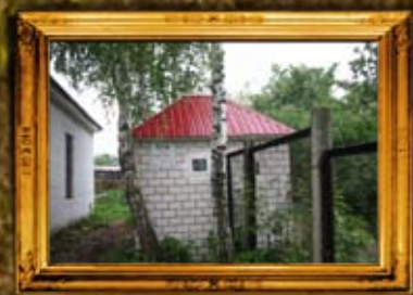
ליניץ: אוהל הרה"ק רבי גדליה מליניץ