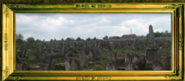
בית הקברות החדש אחרי ניקיון