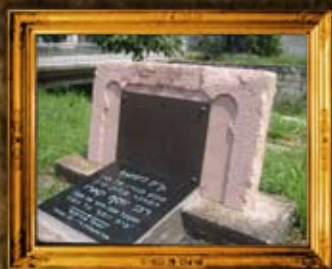
ניקופול בולגריה: בית הבית יוסף