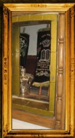
הכנסת ספר תורה לקבר רחל