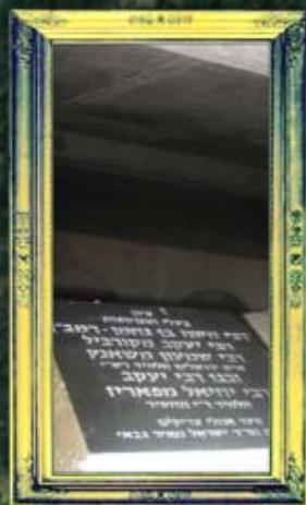
חיפה - הרמב"ן