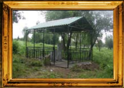
זוויל: אוהל צדיקים לבית זוויל