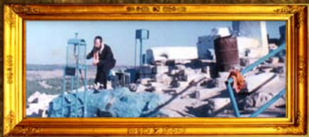
נר תמיד בין ציון האר"י לציון רבי שמועון תלמיד מוהר"ן מברסלב