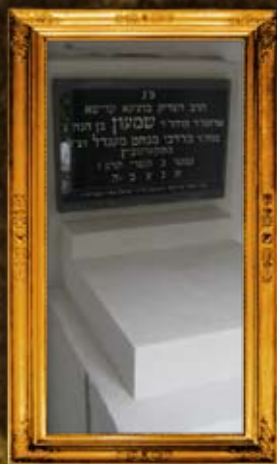
סקרמוביץ - פולין: מצבת הרב"ק מסקרמוביץ