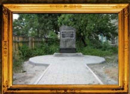
קורסטישב: סימון בית החיים