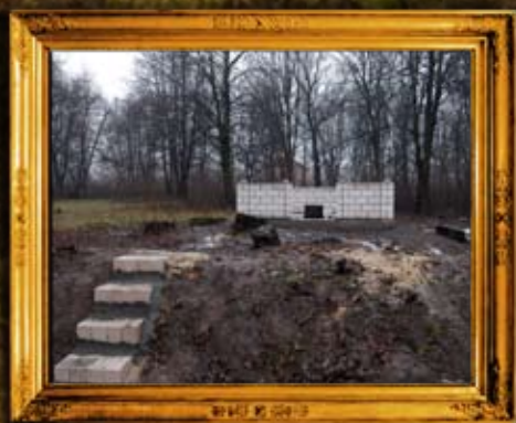
ליטוין: ציון הרה"ק ר' מנחם נחום מליטין - לאחר השיפוץ