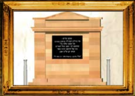
סיאוס, יוון: הדמיית מצבת סימון בית החיים בו טמון בעל הטורים