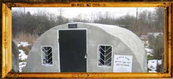
נדבורנה: אוהל הרה"ק רבי צבי הירש מנדבורנא