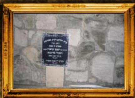
זמושץ', פולין: ציון בית החיים וציון המגיד מדובנא