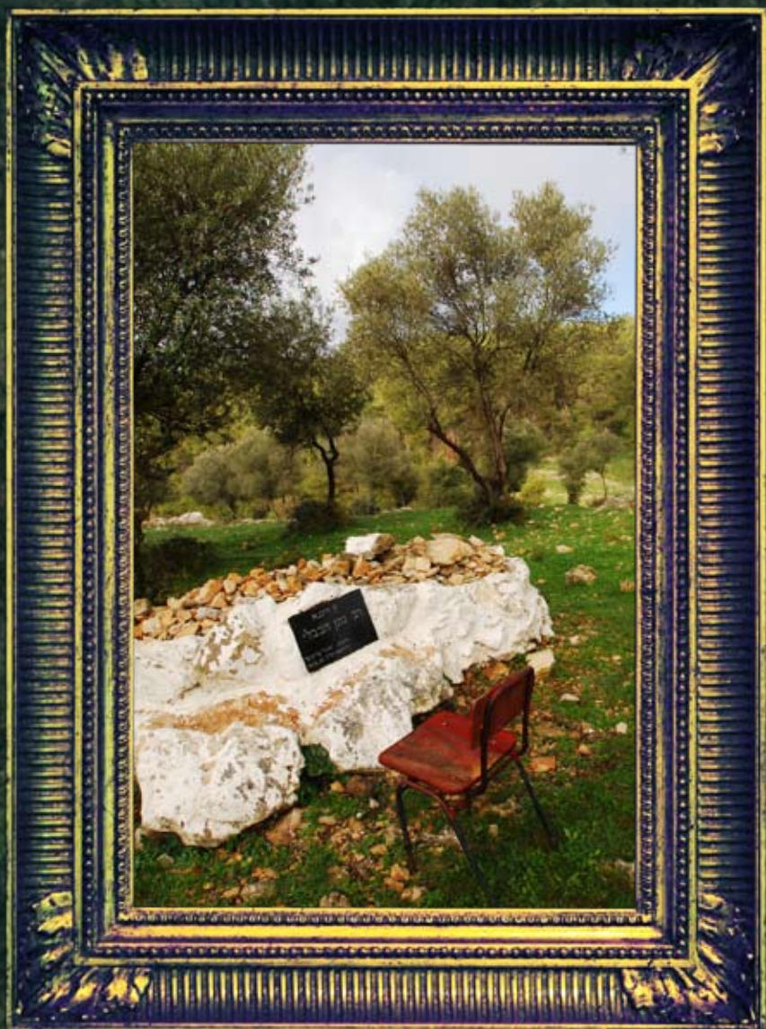
מביש צפת מירון - רבי נתן הבבלי