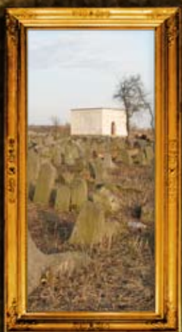
ברדיטשוב: ניקוי בית החיים