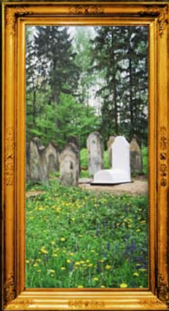
במילוב: בית החיים