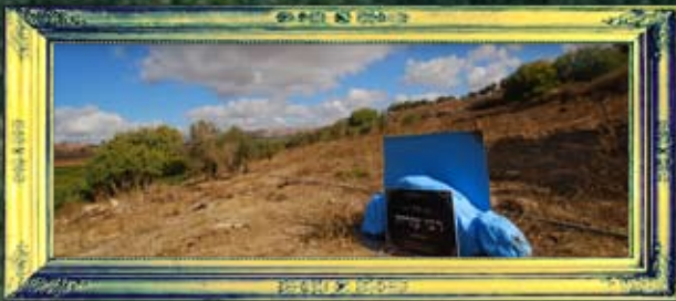
עלמא - רבי עזריח