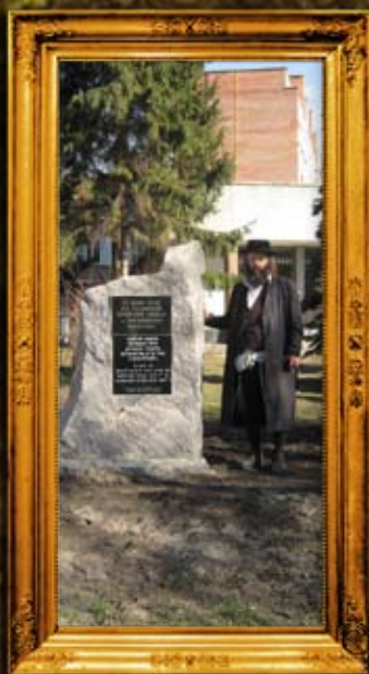
המלניצקי: ציון בית החיים העתיק