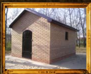
לנטשנה - פולין: הרה"ק רבי שלמה לייב מלענטשנא