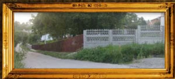
שפיטובקה: גידור בית החיים