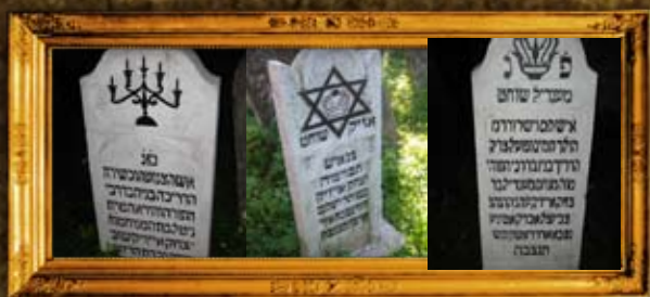
ויז'ניץ: שיקום מציבות בביה"ק