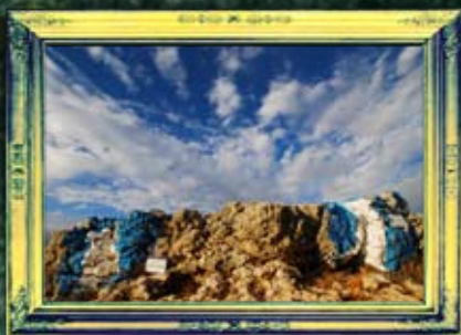
חזאקב - עקביא בן מהללאל ואדמו"ר