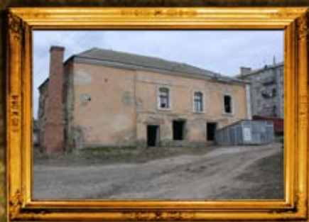
צ'צ'לניק: ניקוי ושמירת בית המנסת העתיק