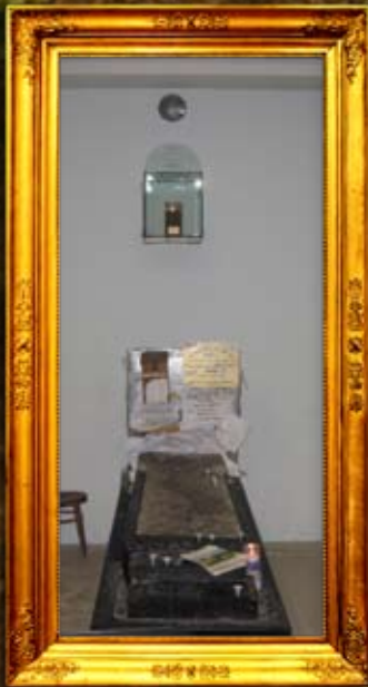
נר תמיד בציון הרה"ק מברדיטשוב