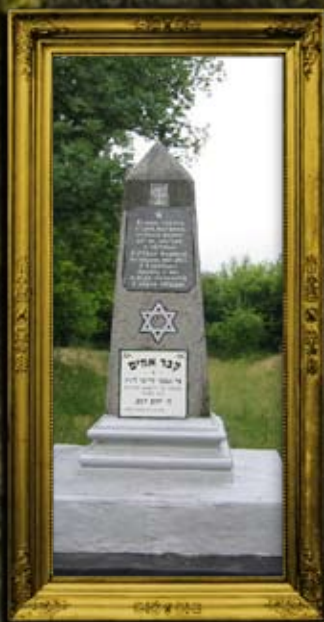
ליניץ: קבר אחים