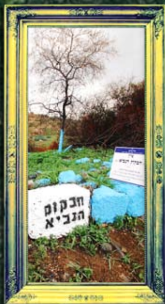
חוקק - חבקוק הנביא