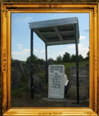
סטנוב: הרה"ק רבי ישראל הריף