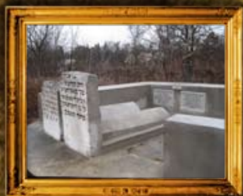
ז'נקוב: הרבניות לבית ז'נקוב