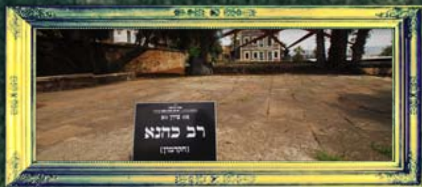
טבריה - רב כהנא