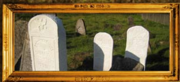
ליצס: ציון אשת הרה"ק רבי מרדכי מליצס ועוד