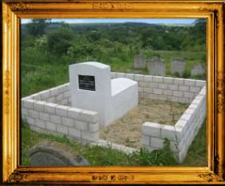
וורחיבקה: ציון הרה"ק ר' שמערייל וורחיבקער תלמיד הבעשט