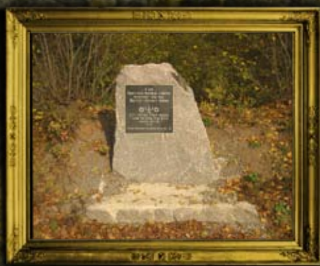
אומן: שלטי המוזה לקבר אחים