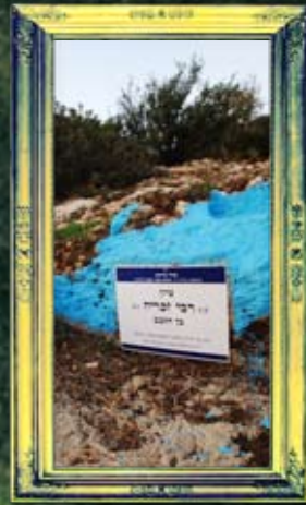
כפר ענן - רבי זמריה בן הקצב