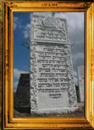
סטנוב: מצבת הרה"ק בעל'גנוי יוסף