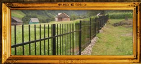
קוואסי: גדר בית קברות