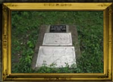
קוסוב: קבר אחים