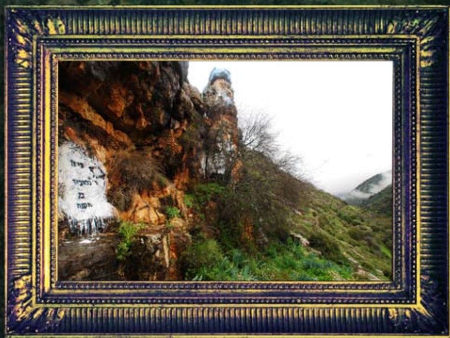
וואדי-עמוד - רבי נחוניא בן הקנה