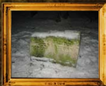
לובלין - פולין: ציון המהרש"ל - לפני השיפוץ