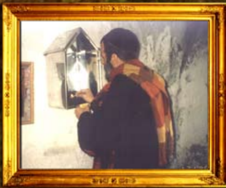
נר תמיד על ציון אהרן המקן בירדן