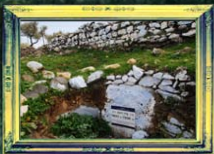
עלמה - רבי שמעון בן נתנאל