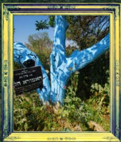
דלתון - הלל האמורא