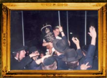
הכנסת ספר תורה לקבר שמואל הנביא