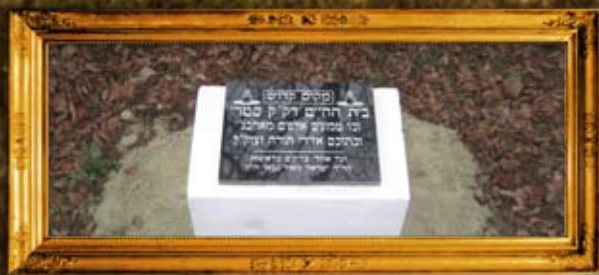
סטרי: ציון בית החיים החדש בסטרי