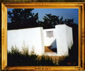
קמוניקה מולדביה: נכדי הרב מאפטא