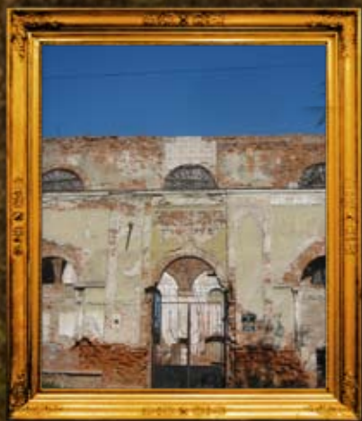
סטרי: בית המנורה של בעל הקצות - אחרי הניקוי