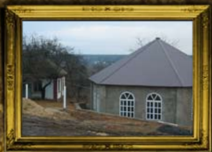
האדיטש: הכנסת אורחים בשיתוף הרב מרדכי הלפרין והרב מנדל דייטש