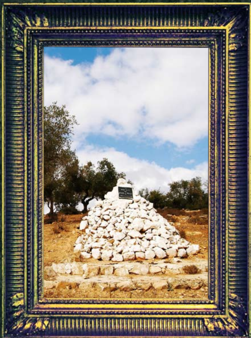
עלמה - רבי יהודה בן תימא