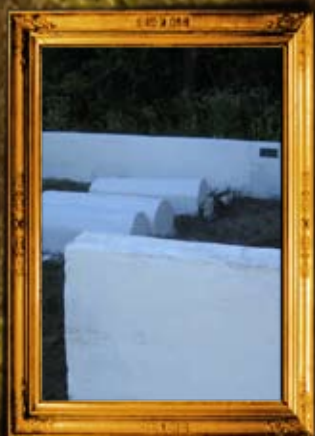
קונסטנטין-ישון: ציון הרה"ק רבי ברוך קונסטנטינר ועוד