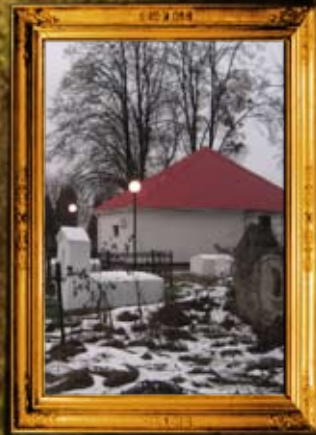
ניעז'ין: אוהל אדמו"ר האמצעי מחב"ד