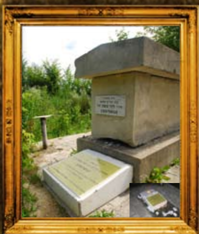
טשורטקוב: ציון הרה"ק דבי דוד משה מטשורטקוב