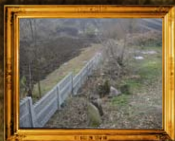
צ'צ'לניק: גידור בית החיים