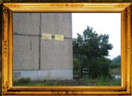
באר: רבי דוד לייקעס תלמיד הבעשט. מתנהל מאבק עם השכנים להקים מצבה