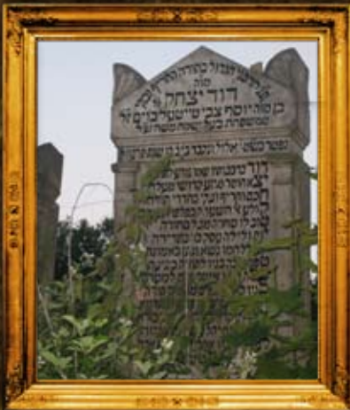
ארדובניה - הונגריה: איתור מ"ק הרה"ק רד"י ט"ב ותיקון מצבות