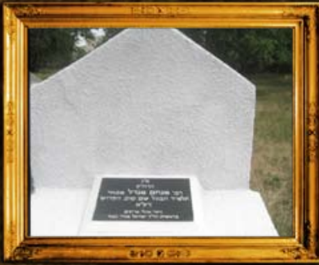
דוביסאר - מולדוביה: מצבת הרה"ק רבי מנדלי באר