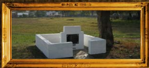
צ'רקס: ציון בית החיים וציון רבי יעקב ישראל מטשערקאס