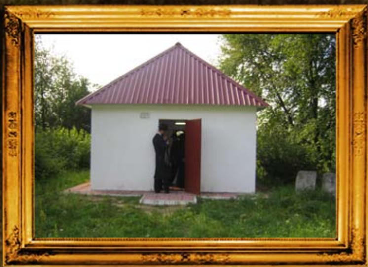
פולנאה: אוהל הרה"ק בעל התולדות והרה"ק בעל מזכיה - והיהודי שלצידו ביקשו להטמן