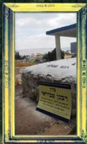
טבריה - רבנן סמוראי