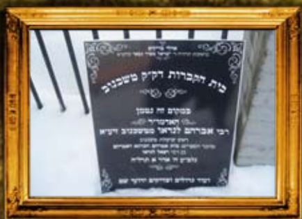
טשיכנוב: גידוד וסימון בית החיים