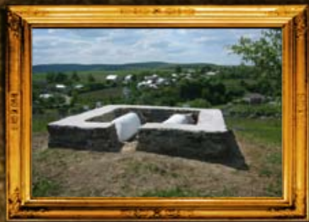
סטנוב: אוהל נכדי הרה"ק רבי מויכל מזלוטשוב