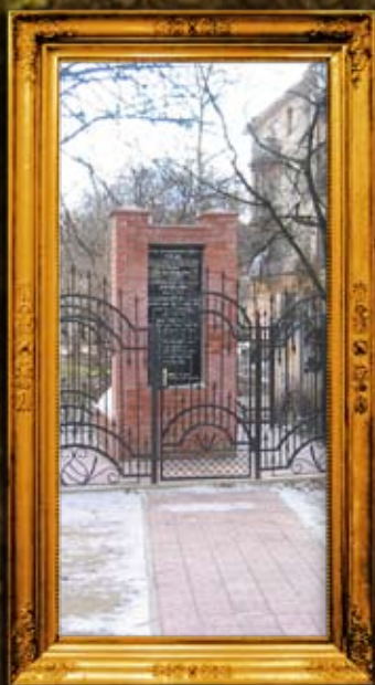
סטרי: ציון ביה"ח בו קבורים הרה"ק מוכפר ספריין, בעל הקצות, בעל הנתיבות, מהר"י עמל ועוד