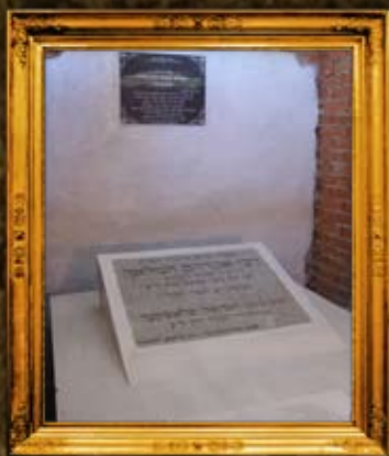
פסטוב: מצבת הרה"ק רבי אברהם המלאך