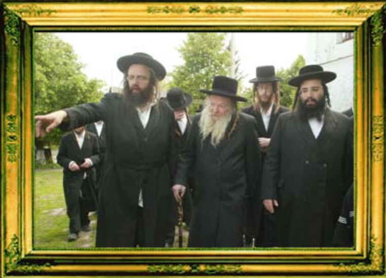
כ"ק אדמו"ר מלעלוב זצ"ל