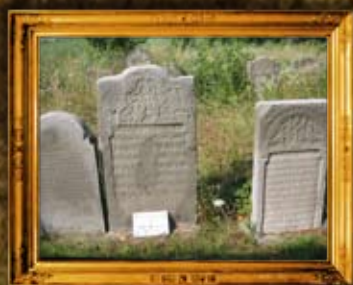
שינובא פולין: רבני שינובא