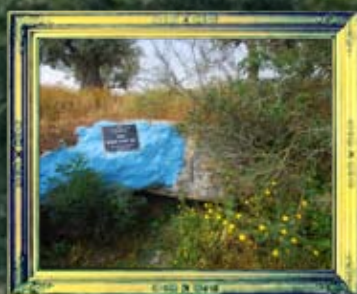
ציפורי - אשת רבי יהודה הנשיא