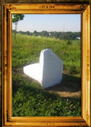
קוריץ: רבי מרדכי אב"ד קוריץ