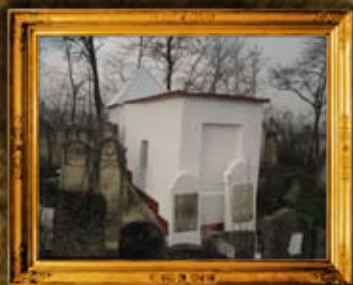
סרט - רומניה: שיפוץ אוהל הרב"ק רבי שמעלקא דובין ומצבות בית החיים