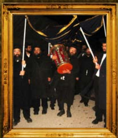
הכנסת ספר תורה לקבר דוד המלך