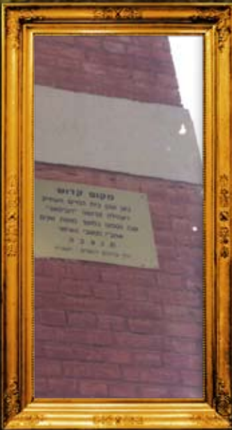
דוביסאר - מולדוביה: שלט בית קברות עתיק