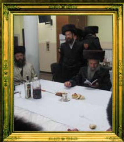
כ"ק אדמו"ר מסלאנים שליט"א