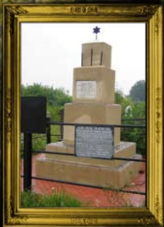
יאנוב: קבר אחים לקדושי יאנוב