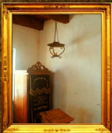
מזבוח: נר תמיד בבית מדרשו העתיק של הבעש"ט