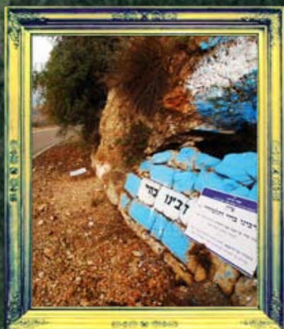
חוקק - רבנו בחיי