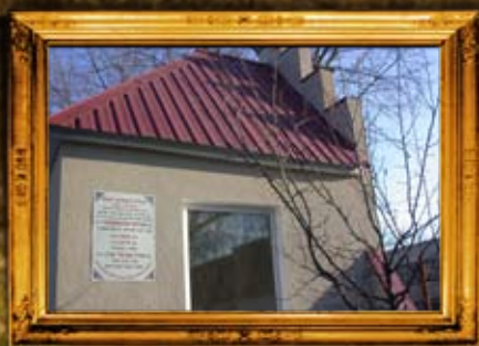
שדה לבן: תלמידיו הבעש"ט ועוד צדיקים