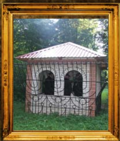
אוסטראה: אוהל ציון המהרש"א