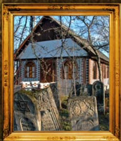
ויז'ניץ: אוהל הצמח צדיק והאמרי ברוך אחרי השיפוץ