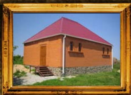
טריסק: אוהל הרה"ק רבו אברהם המגיד מטריסק