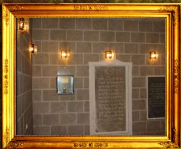
נר תמיד בעל התניא נר תמיד באוהל הרהק בעל התניא בהאדיטש