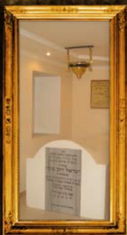
וולדיניק: פנים האוהל