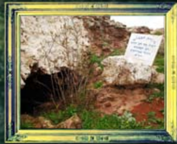
עלמא - מערת הבבלים