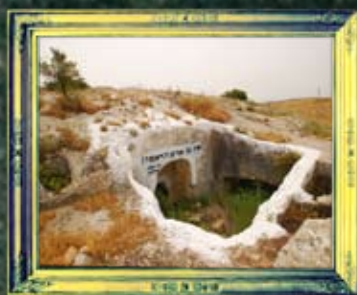
ארבל - שת בן אדם הראשון