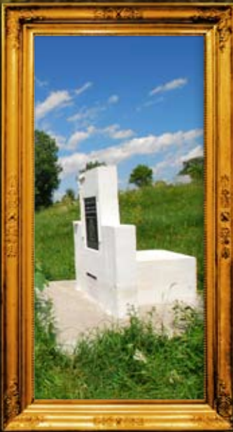
טלוסט: 'אמא של מלכות' - ציון אם הבעש"ט