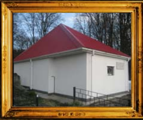
ניעז'ין: אוהל אדמו"ר האמצעי