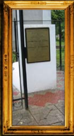
טיסמניץ: ד' יעקב קאפיל חסיד - מצבה