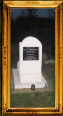
דובינקא - פולין: ציון ר' אורי פיבל מדובינקא בעל אור החכמה