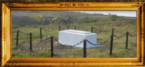
טרוביץ: המגיד מטרוביץ