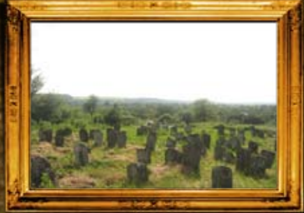
וורחיבקה: ניקוי בית החיים