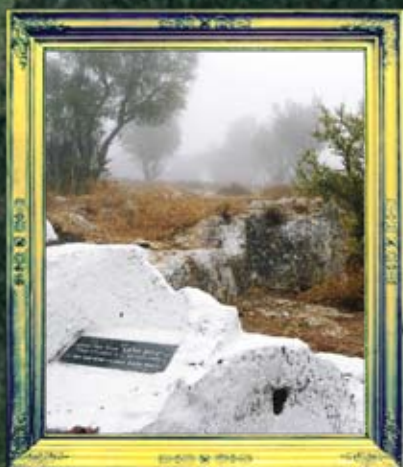
כביש צפת מירון - ר' יצחק הלבן