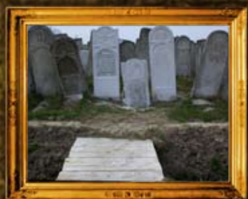
סטנוביצע: נכדי הרה"ק מאפטא וגשרון גישה לבית"ק