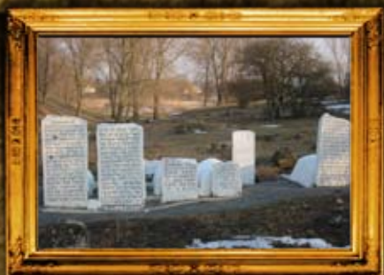
קונסטנטין ישון: ר' דן מרדכויל ועוד