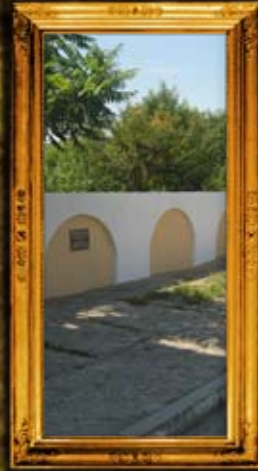
בעלו: גדר בית קברות הישן