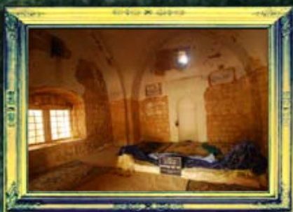
רבי יוסי דמלחיא