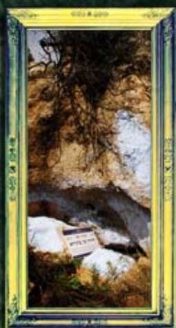
מירון - רבי יהודה בן בתירא