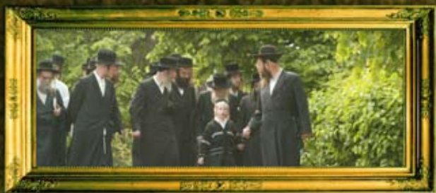
כ"ק אדמו"ר מלוב זצ"ל ויבל"ח כ"ק אדמו"ר ממקווא שליט"א