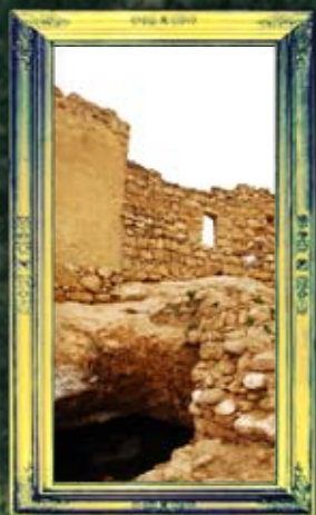
רומנא - אביה ובנימין