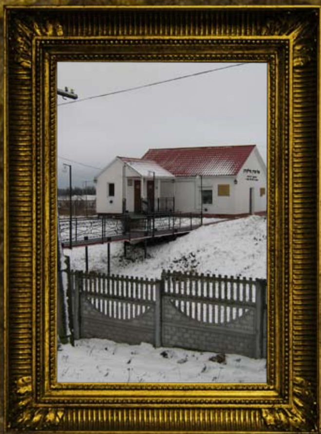
וולדניק: אוהל הרח"ק מוולדניק, הכנסת אורחים, ביתן כהנים ודרך הכהנים, גדר ביה"ק וחדרי נוחיות