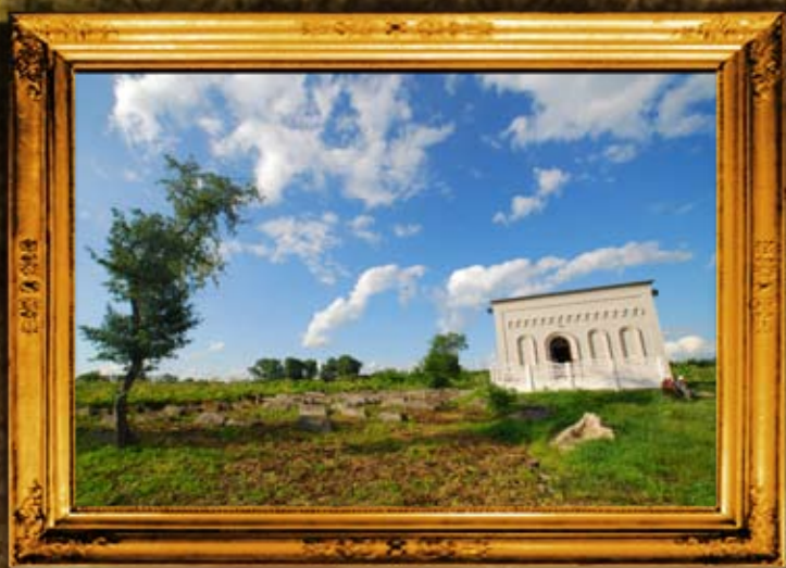
ברדיטשוב: ניקוי קבוע של בית החיים