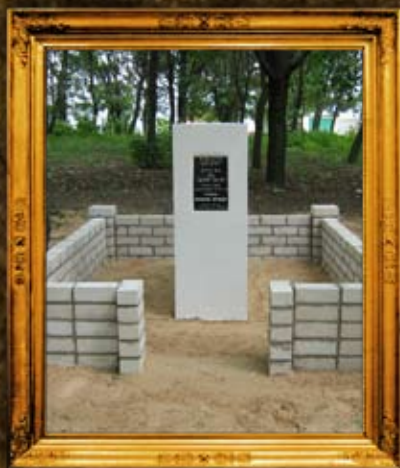
מוז' - בלרוס: אוהל הרה"ק רבי יהואל מושר