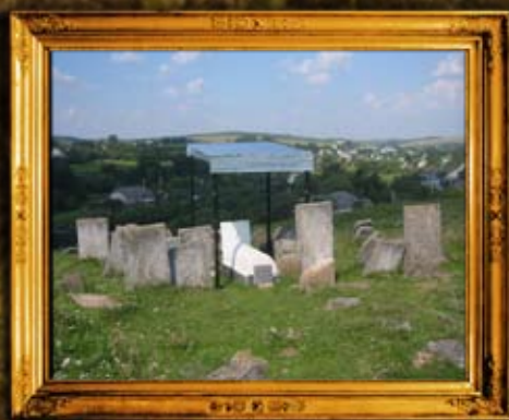
סטנוב: ניקוי ושימור בית החיים