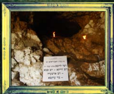
ואדי-עמוד - רבי אבא