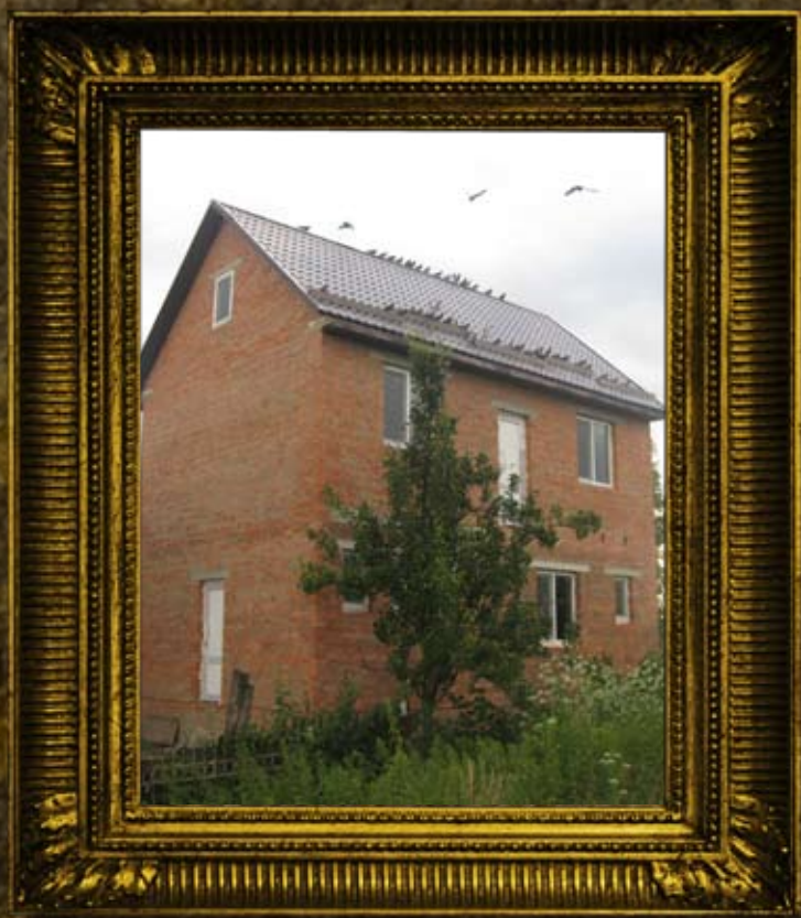
אניפולי: בית המנסת אורחים באמצע הבניה