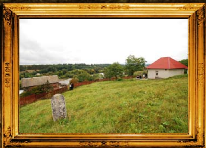
ברסלב - אוהל רבי נתן וחלק משטח בית הקברות. למטה: גדר בית הקברות