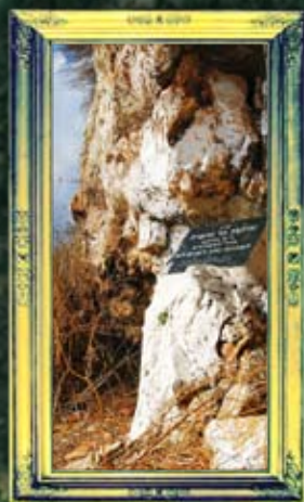
צפת - רבי נתן דצוציטא