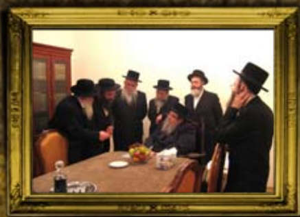
בעלז: עם ס"ק אדמור מבעלז בהדרו בבית הכנסת אורחים בבעלזא