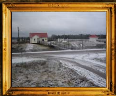
וולדיניק: מתחם בית הקברות