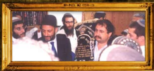
הכנסת ספר תורה לקבר ישי ורות