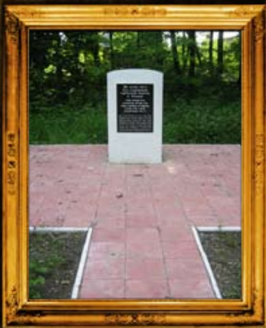
קאלאמיי: ציון הרה"ק רבי הלל מקאלאמיי וסימון בית החיים