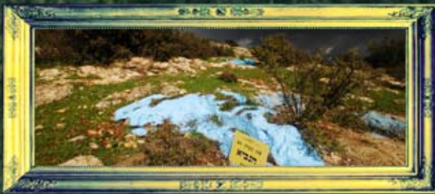
כפר ענן - הנביא