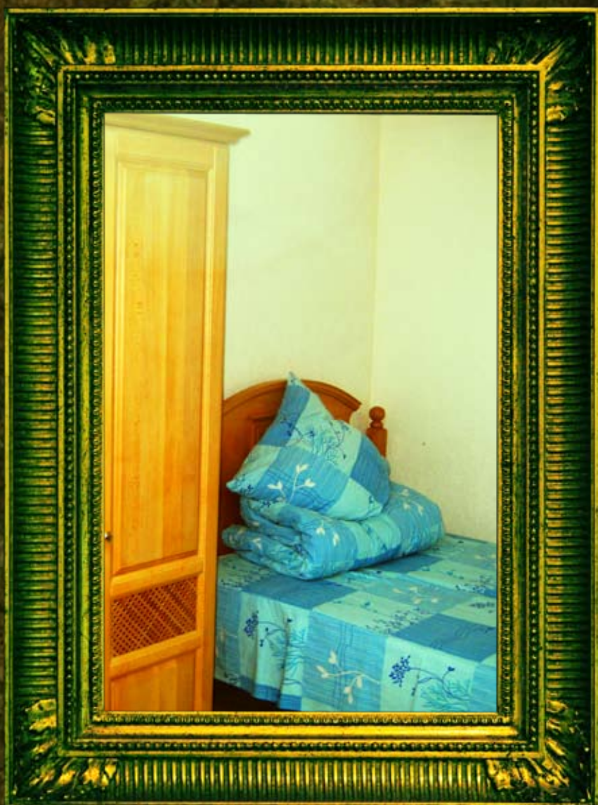
חדרי הכנסת אורחים