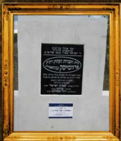
פרבמיסק-באהאפאלי: ציון בית החיים וציוני הצדיקים זע"א