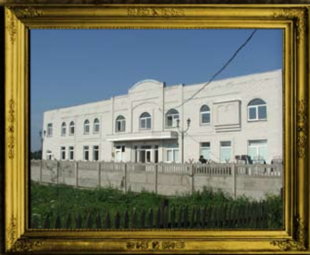
בעלז: בניית בית הכנסת אורחים בבעלז עבור מרכז עולמי בעלזא