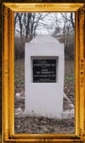
חלב - פולין: ציון הרה"ק רבי מאיר נייהוץ, הנקרא 'טומשובר רבי'