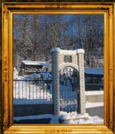
קוסוב: שער בית הקברות