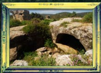
מירון - מערת מוהנים