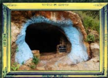
פקיעין - ר' הושעיה רבה