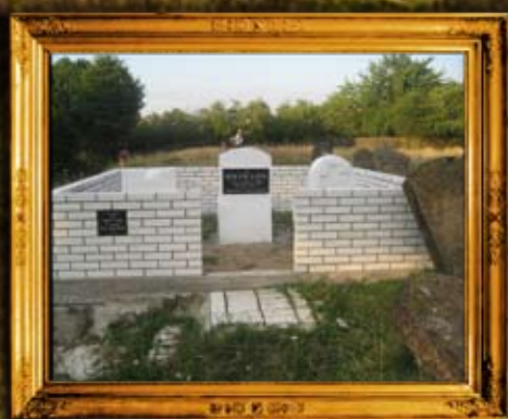
ליצס: ציון הרה"ק ד' מרדכי מליצס - אחרי השיפוץ