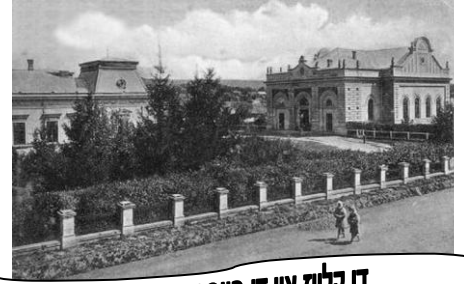
די קלויז און די הויף אין באיאן

הרה"ק ר' יצחק די פחד יצחק "דער רבי פון באיאן" ב' דר"ה תרי"י - שיבסר אדר תרע"ז