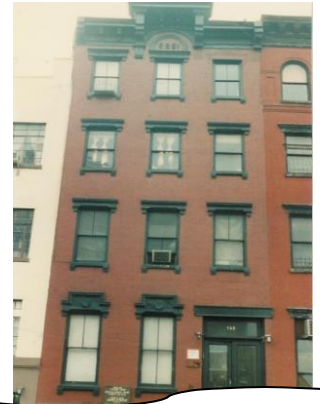
די קלויז אין די איסט סייד