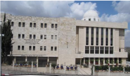
די קלויז הג' מיט די ישיבה אין ירושלים