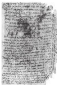
כתב יד של כתבי הרמב"ם בכתב יהודי-ערבי

בהמשך כתב הרי"ף גיאת את דעתו האישית, לפסוק חלקית כרב יהודאי גאון והרס"ג, שמי ששכח לילה הראשון הפסיד את התמימות, משום שלדעתו כך באור הגמ' (מנחות סו): "...אימתי אתה מונה תמימות, בזמן שאתה מונה מבערב" (עי' הערה). לדעתו זהו טעמם, אמנם הוא מדגיש שאף אם שכח בשאר לילות, "אינו מתעכב, אלא סופר והולך" (עי' הערה).