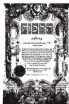
הלכות גדולות לרב יהודאי גאון

נשאלת השאלה, אם כן אולי זו באמת דעת הבה"ג? מבדיקת מקורות הגאונים עולה שדבר זה בלתי אפשרי כלל. בנוסח המובא בר"ץ גיאת מובאים שתי אפשרויות לשוכח בשאר ימים