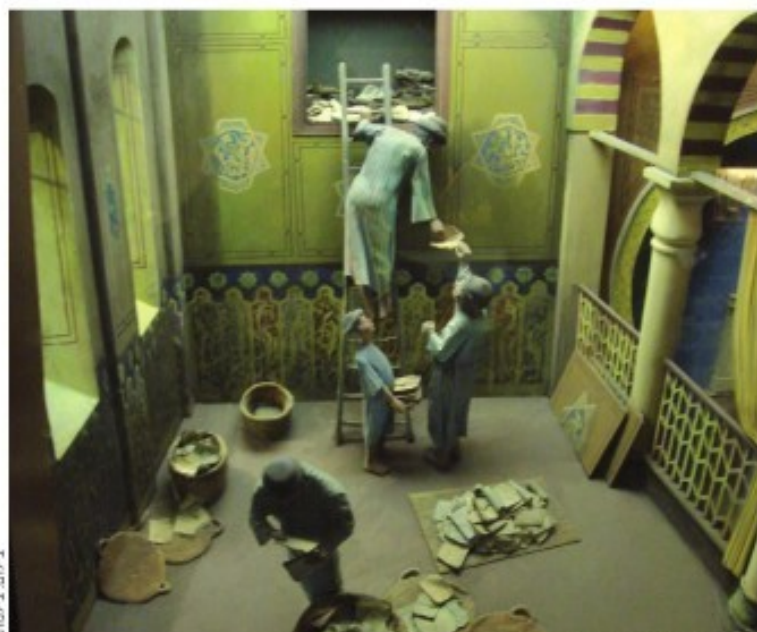
דגם הגניזה הקהירית בבית התפוצות.

כעין הדברים שהובאו לעיל בשם הבה"ג, מובא גם בראשונים רבים בשמו (בשינויים קטנים). בעל 'העיטור' (מצה ומזוז קל"ז, א') מזכיר את דעת רב יהודאי ורב עמרם גאון (במקום רס"ג), לגבי המחסיר את הלילה הראשון. וכן את שיטתו המיוחדת של הרי"ף גיאת, שאמנם הפסיד 'תמימות', אך ממשיך לספור גם בשאר לילות. בעל 'העיטור' עצמו פוסק