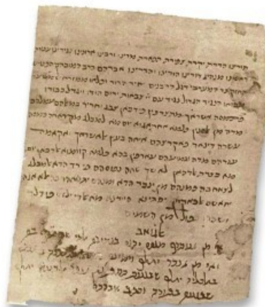
מכתב אל רבנו אברהם בן הרמב"ם שנמצא בגניזת קהיר

העתיקו מקצת ראשונים, אלא שיטה שונה. 'תמיהה גדולה' זו מעלה בפנינו שאלה גדולה, כיצד קרה שדברי הבה"ג נשתבשו והובאו שלא כדעתו, עד כדי כך שאפי' תוס' עצמם (מנחות שם) סרבו להאמין שיש לייחס דעה זו לבה"ג (עי' לעיל).