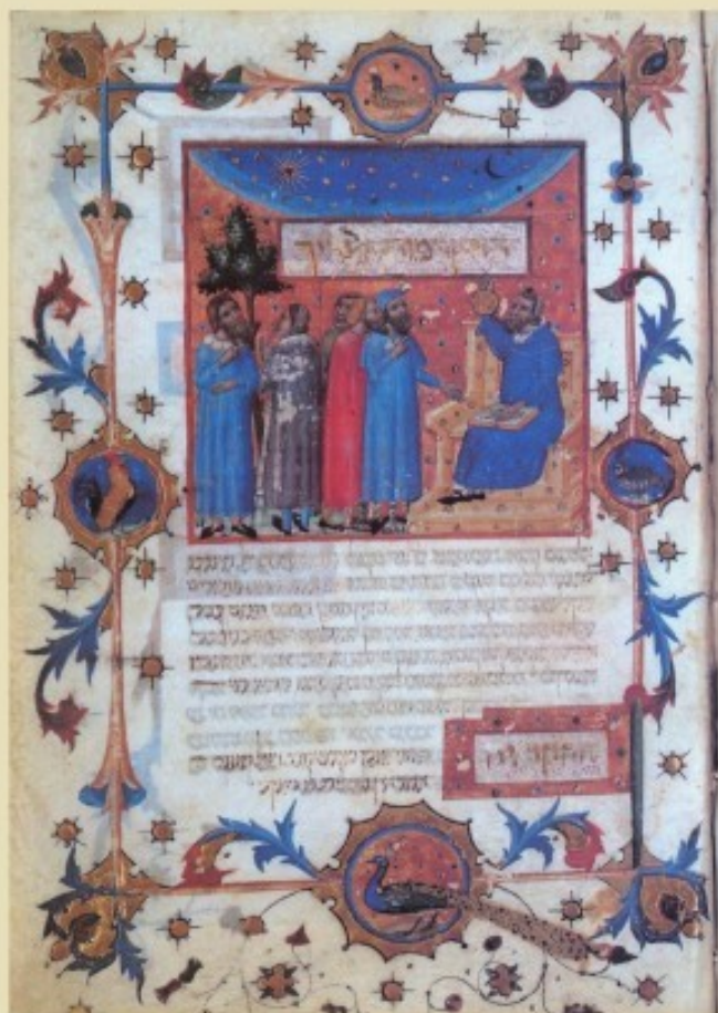
כתב יד של המורה נבוכים להרמב"ם מהמאה ה-14

ספר 'הלכות גדולות' סיכם את פסקי ההלכה שקדמו לו וזכה להיות ספר יסוד בפסיקת ההלכה. וכן כתב עליו בספר חסידים (מהדורת י' ויסטיניצקי, סימן תשמ"ה): "תורת חכם כיון שעוסק בתורה ומחדש בה כאילו היא שלו, וממנו באה ואפילו אינו מחדש בה אלא מסדרה... כיון שראה שהלבבות מתמעטות עשה 'הלכות גדולות' בקוצר, כי אמר, טוב מלא כף נחת ממלא חפנים עמל. זהו תורת חכם, מאחר שהוא מסדרה בקוצר שידע האדם, כי אדם שעוסק בתלמוד ושוכח, טוב שילמוד 'הלכות גדולות' ויחזור שידע המצות".