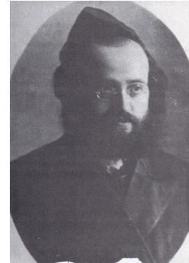
הרבי מפיאסצ'נא בצעירותו