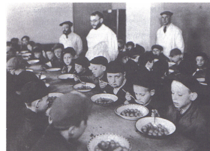
מטבח צבורי לילדים בגטו ורשה

אכן מיני אז נרתם הרבי לעניינים של כלל ישראל ושקד בכל כוחו על הצלתם וחזיקם של הרבים תוך התעלמות מוחלטת מצרכיו ומיכולתו להציל את עצמו. בביתו שברחוב דז'ילנא 5 פתח מטבח צבורי מעין בית תמחוי עבור 1500 איש.