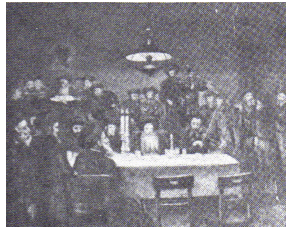
רבי אלימלך מגרודז'יסק