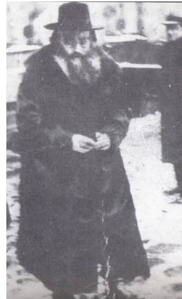
הרבי מפיאסצ'נא ברחוב בגטו ורשה