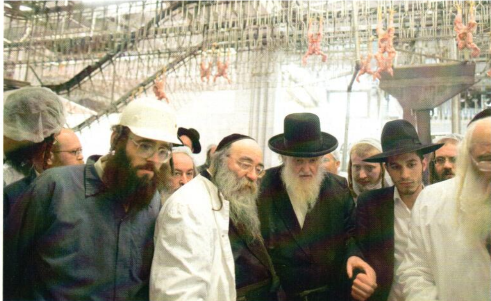
עין פקוחה. הראב"ד בסידור במשחטת העופות

לדון בזה, אחר שרבענו הרמ"א סגר בפנינו הדרך ופסק כי כל חשש כל דהוא בצומת הגידין הוא טריפה. מי יבוא אחר המלך לומר שהוא כן בקי בזה?