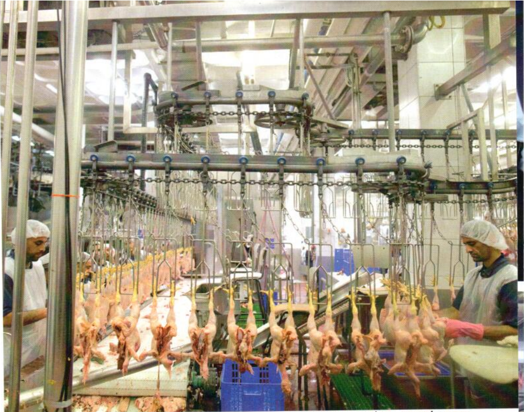
סערה בצלחת עוף. מפעל העופות בעין הסערה

רק בעיצומו של השבוע השני לסערה, נחשף הראב"ד למתרחש, ואז החל ללמוד את הטענות המושמעות כנגד 'ועד השחיטה'. ביום ראשון השבוע הוא הגיע אל המשחטה במטרה לקבל תשובות ברורות לשאלות שהועלו לצד עוד כמה שאלות שהתעוררו אצלו בנושא