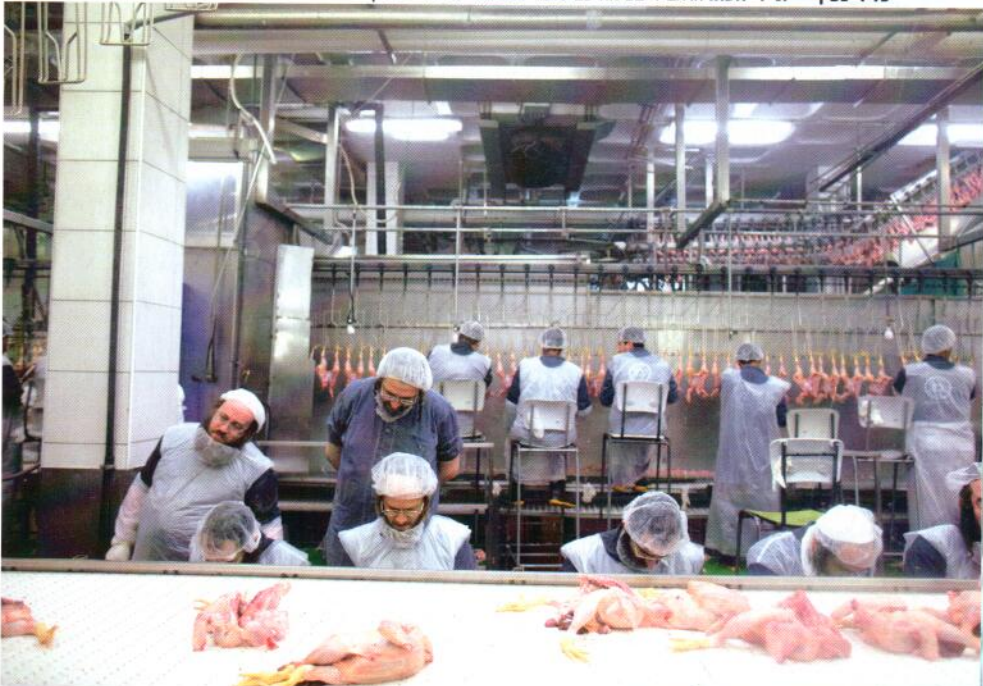
זריקה וקוץ בה. משחטת 'גלאט עוף', השבוע