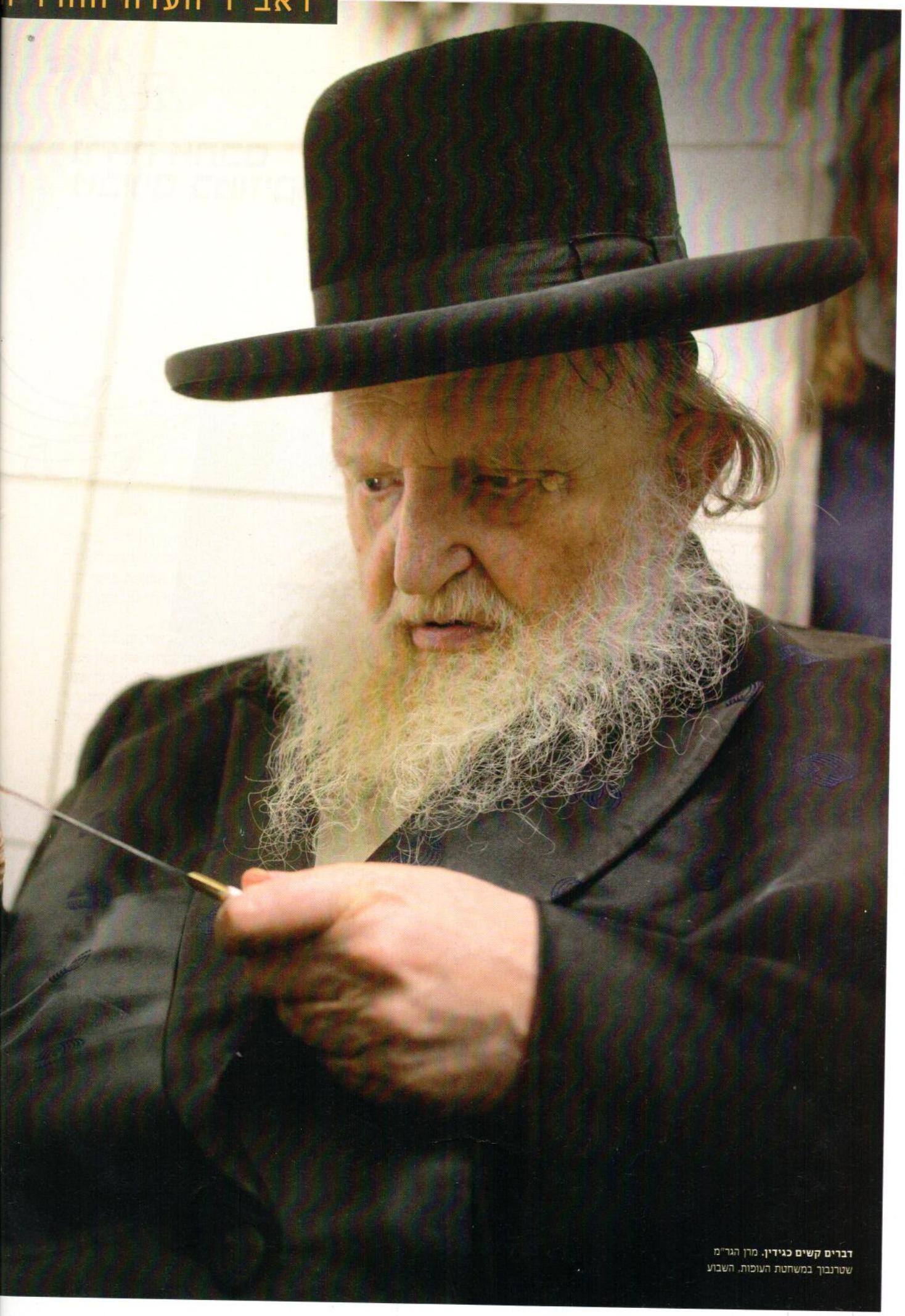
דברים קשים כגידיו. מרן הגר"מ שטרנבוך במשחטת העופות, השבוע