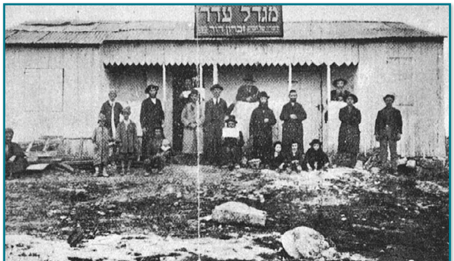
ראשוני המתיישבים במגדל עדר

מסמכים שנחשפו לפני שנה בגנזך המדינה מעלים שמדובר היה