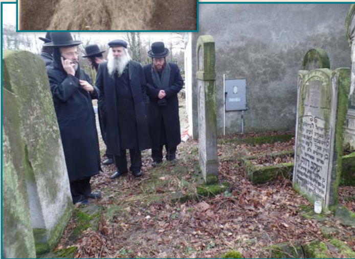
תפילה על הקורונה בשבוע שעבר

מטעו', כאשר הוא משלב בהם את דברי תורתו והסכמותיהם של גאוני דורו.