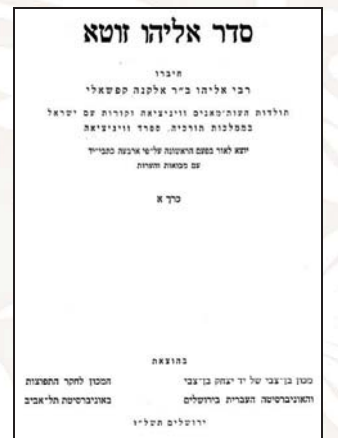
ספר דברי הימים לרומם את רוחם של הנצורים במגיפה - שער הספר 'סדר אליהו וזוטא'

בהקדמתו לספר זה שנדפס ארבעים ואחת שנה לאחר מותו, בשנת תמ"ה, הוא מספר על עלייתו לארץ ישראל ועל המגפה בחברון כדברים האלה: "ואני הצעיר אברהם בן לא"א מאד נעלה כהר"ר מרדכי זלה"ה... אזולאי... זכרתי ימים מקדם כאשר הייתי בימי חורפי כאלפי מולדת פאס יע"א... ואני בקרב חכמים שלמים וכן רבים... ומדי לילה כלילה ומדי שבת בשבתו דבר בעתו הואלתי באר פי המדבר על און... ויהי כי הקיפו לי הימים ראש ולענה מנת כוסם מלא מסך מים אדירים משברי ים וזעף... ונדדתי לבוא להתגורר בארץ ישראל בשינוי מקום המבדיל בין קודש לחול, לא שלותי ולא שקטתי ולא