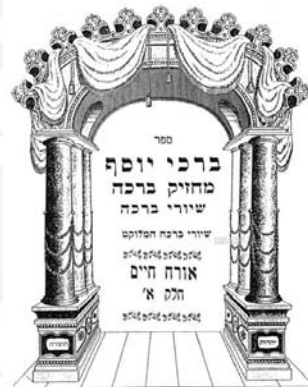
מחזיק ברכה למון החיד"א – כאן נידון אולי לראשונה למעשה מניין המרפסות...

המחבר כותב בהקדמתו לספר כי אין הוא מתיימר להיות מחבר ספר, וכי הוא מתייחס לציירתו זאת כאל 'משלי הנערים'. למרות זאת החיבור הופץ, ונתקבל בבי מדרשא בחיבובות יתר,