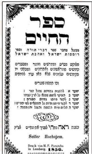
עכירות עניי האגרות – תוצאה של בידוד, שער 'ספר החיים'

עתה נעבור לשנת ש"ה, כאשר לבקשת בני חברותו חיבר ספר קטן במוסר וקורא לו בשם 'אגרת דרך ה'". דומה מספר זה הוא ספר הנהגות הראשון שידוע שחיברו צפת, בטרם נכתבו הנהגות המקובלים