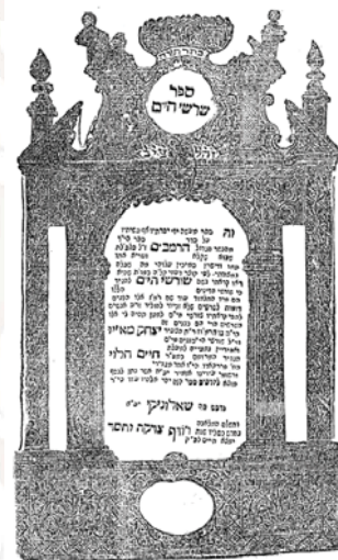
משאלוניקי לחי'אלאם בגלל מכת הדבר – ספר שרשי ה'ים על הרמב"ם.

שלוש מסעות ערך רבינו בחייו, כשד"ר למען עניי ארץ ישראל. באחד מהם, ויותר נכון לאחרון שבהם, היה כאשר הגיע לעיר ליוורנו שבאיטליה. בעידן שהאיטלקים לא הכירו את הגנף 'קורונה', הם ביקשו לכבוד את עצמם מהעולם שלא יחדרו אליהם מחלות כל שהן, וכן, כל אחד שבא