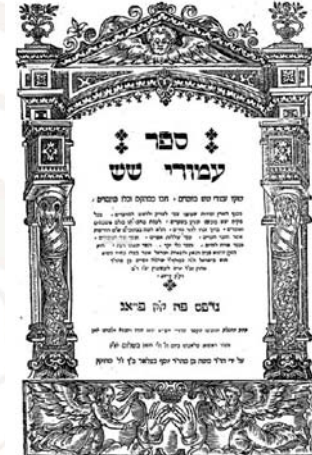
בזמן הבריחה הנ"ל שלא הייתי מעומס ממשא הישיבות וממשא ק"ק וכלל יום ויום בצפינות ניפנו לא ה' להשיב שביטונו וטבות כל המפורים, אמרתי בעתים קצרים הללי העלות על יייר מקצת הדברים אשר יצאו ממ" – שער הספר 'עמודי שש'.

"בשנת רפ"ג פשטה מגיפה קשה מן האי רודוס לקנדיאה, בימי המלחמות נפלו