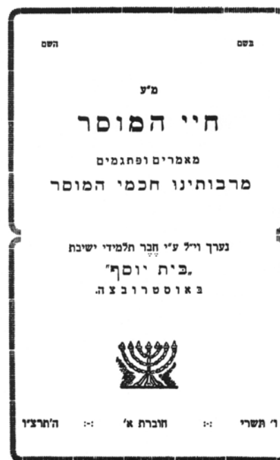
החוברת הראשונה של חי המוסר , אוסטרובצה 1935

לכאורה התשובה טמונה בפריסה המיוחדת של ישיבות התנועה: פיצולן הגאוגרפי שנוצר כבר בתקופת מלחמת העולם הראשונה ונמשך גם לאחריה חייב התארגנות מתאימה ליצירת קשרים בסיסיים ביניהן – אם בצורת "כתיבת המכתבים" ואם באמצעות כתבי עת. אולם דומה שהסיבה עמוקה יותר. לאחר מלחמת העולם הראשונה הואצו תהליכי החילון בחברה היהודית במזרח אירופה. לפני הנוער נפתחו שעריהם של כל מוסדות הלימוד, כולל גימנסיות יהודיות לגוניהן. הישיבות הליטאיות פסקו מלשמש בתי אולפנה יהודיים יחידים ואף חדלו מלהיחשב בציבור הרחב כמוסדות עילית אינטלקטואליים. והנה בתוך עולם ישיבות זה, שפג כביכול זהרו, מצאו אלה הנוברדוקאיות – הלא נורמטיביות – את עצמן בקרן זוית, אם מחמת חריגות ואם מנטייה רצונית להתבדלות. בכוחה של העיתונות היה להפיג רגש בדידות זה בהפיחה בין אלפי חברי תנועת נוברדוק רוח של התאגדות – "הוא אחד מהיסודות והעמודים החזקים בכלל ובפרט, שיצר לכל אחד רוח חזק ורבי-גאון, שכל הרוחות שבעולם לא יזיזו אותו ממקומו, בהרגישו עולמו המיוחד במלא מובן המלה". 96 ואכן, נראה שעתונות זו הצליחה במשימתה. משהחלה התנועה להתפשט מחוץ לגבולותיה הגאוגרפיים הטבעיים אף יצא אחד הביטאונים הנוברדוקאים בהצהרה יומרנית רבת ביטחון: "העבודה תתפשט ותתרחב בהשקפה רחבה – השקפה עולמית, רוח העבודה יתעורר בכל תפוצות הגולה ובארץ, רוח המוסרי יתפעם בכל לב בן תורה ויראה, רוח של הרבצת התורה והרכות מבקשים תמן