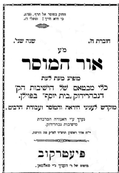
החוברת המודפסת הראשונה של אור המוסר , פולין 1924