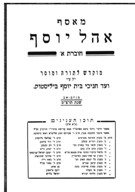
החבורת היחידה של אהל יוסף, ביאליסטוק 1939

קולה בראש כל חוצות מקצה הארץ עד קצהו, התאגדות הישיבות והרוח תקיף העולם ומלואו". 97 הצלחה זו לא באה יש מאין. במקום שבו כשלה שיטת "כתיבת המכתבים" נדרשה העיתונות לחדשנות ולנמרצות בשאיפתה להגביר את רוח ההתאגדות בתוך התנועה. ישיבות נוברדוקאיות לא מעטות יזמו הוצאת ביטאונים משלהן, שאלו רעיונות מהעיתונות הכללית, הוסיפו מדורים מושכים וניסו להרחיב את תפוצתם באמצעות פנייה לתלמידי ישיבות עמיתות. אולם היה לכך גם מחיר. כבר בגיליונו הראשון נאלץ הד המוסר המזריצי להתמודד עם ההתנגדות הטבעית שהופעתו צפויה הייתה לעורר בקרב תלמידי הישיבה, והקדים תרופה למכה באמצעות הפליטון "שיחה אודות העתון":