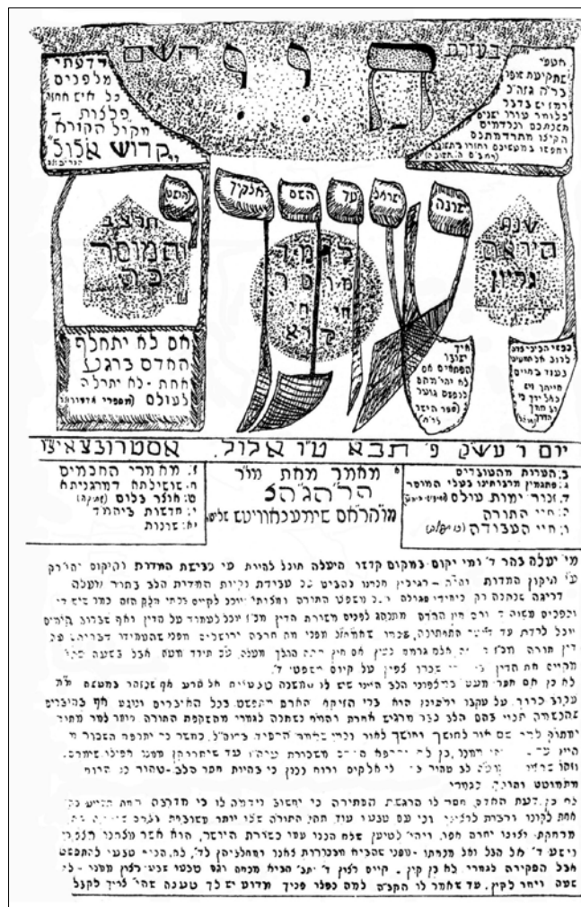
ראש גיליון כ"ה של חיי העובדים, אוסטרובצה 1932

האומנם תרמו כתבי עת ישיבתיים פנימיים אלה ליצירת רוח ההתאגדות המקווה? יתרונם העיקרי – שלא כ"כתיבת המכתבים" – טמון היה באפשרות הפצתם בו בזמן בקרב קהל נרחב של תלמידי ישיבות עמיתות. 63 ואכן, על אף התרכזותם בעשייה של הישיבה המקומית הם התייחסו לא רק לחניכיה או לצעירים שבסניפיה אלא לחברי התנועה הנוברדוקאית כולה, ואפשר למצוא בהם פניות שמיות מפורשות אל תלמידי ישיבות אחרות. הדבר בולט בעיקר במדורי הזמנות שרשרת, שהיו מעין חיזוי למדורים מקבילים במדיה