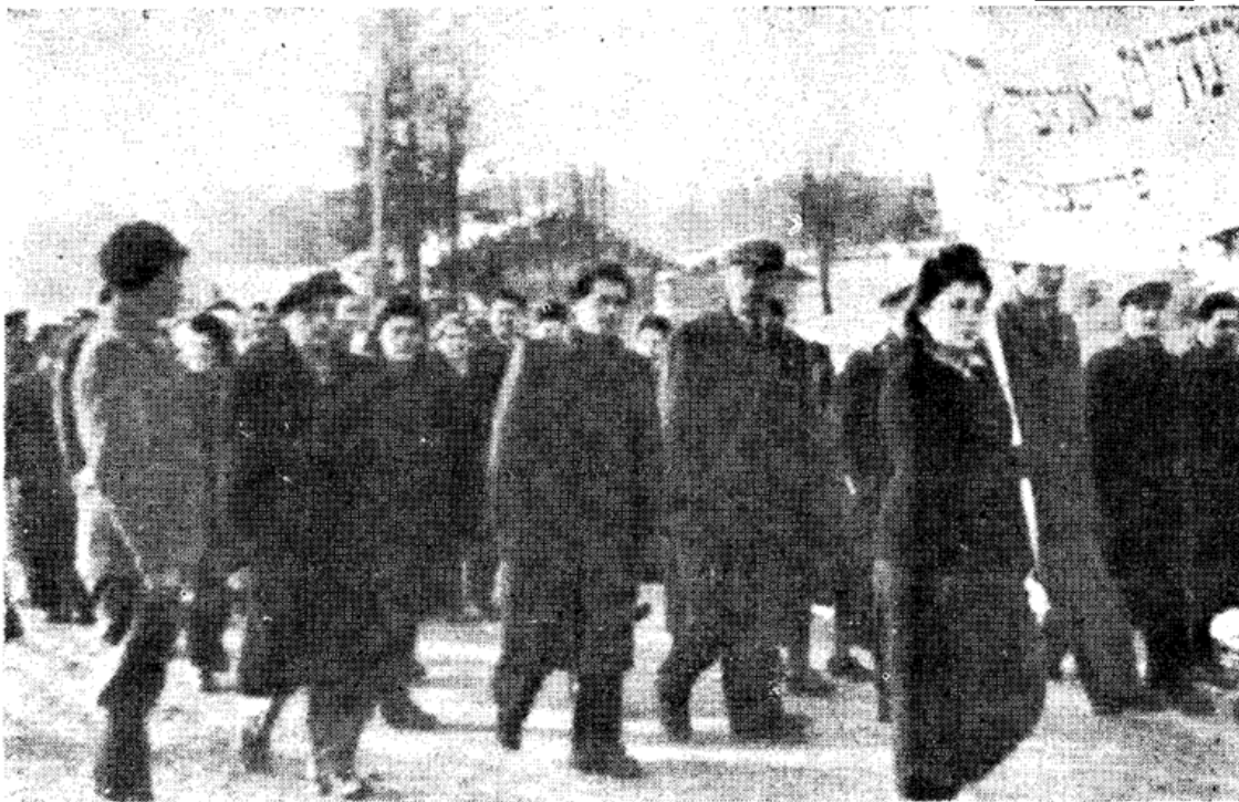
א צווייטער פראגמענט פון דער מאניפעסטאציע אין פעלדאפינג.