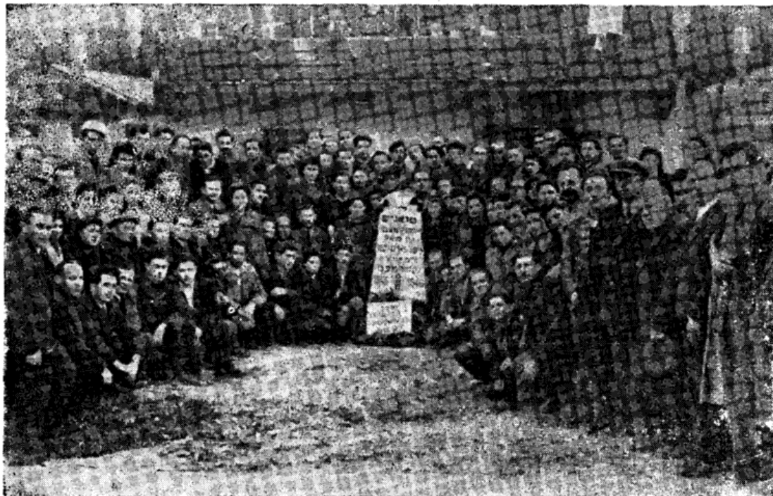
יזכור-פאַרזאַמלונג פון פרוזשענער אין דייטשלאַגער פעלדאָפינג, אין יאָר 1946.

אונדזער קאלעקטיוו האָט זיך וואָס ווייטער אַלץ ווייניקער געהאַלטן ביי דער געאָגראַפיע. צו אונדז זענען צוגעשטאַנען עלנטע ביאָליסטאַקער, סלאַ-נימער און אַנדערע. די מיטגלידער פון קאלעקטיוו האָבן געוויינט אין זיבן צימערן. זעקס האָבן פאַרנומען די מענער, אין דעם זיבעטן, דעם גרעסטן און שענסטן צימער, האָבן געוויינט די פרויען. עטלעכע אונדזערע מיטגלידער האָבן געוויינט אין וואַלדווייט נישט ווייט פון פעלדאָפינג און אויך