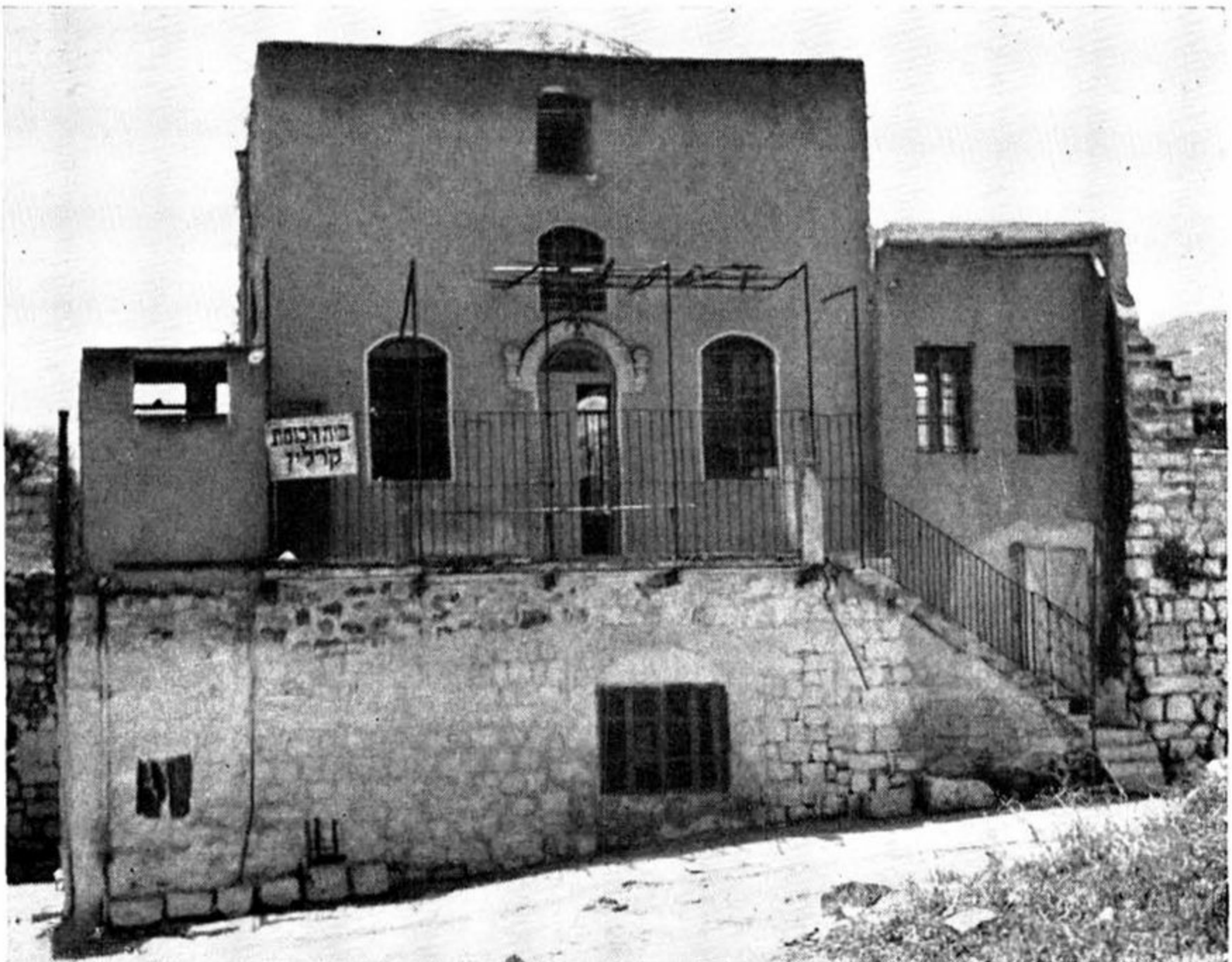
בית הכנסת של חסידי קארלין בטבריה