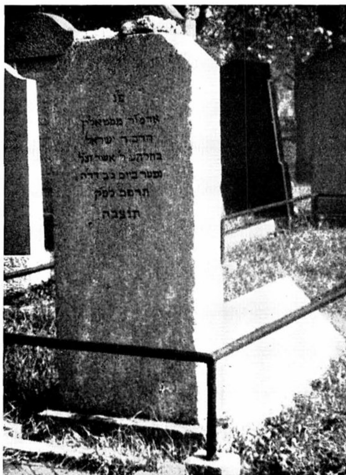
קברו של הינוקא מסטולין בפראנקפורט-דמיין