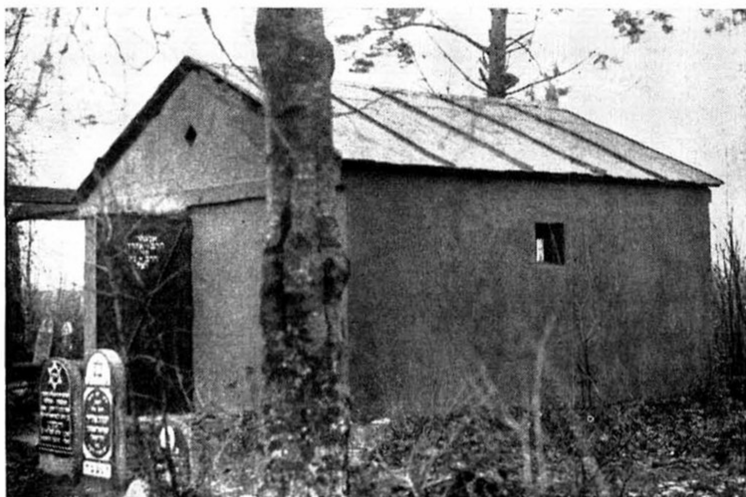
ה'אוהל' על קברם של ר' אהרן ור' נח השני בלאכוביץ'