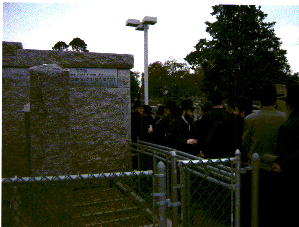
23. חסידים עומדים בתור להיכנס ל"אוהל" שעל "ציוניהם" של הרבי יוסף יצחק והרבי מנחם מנדל, בג' בתמוז תשס"ז (2007).