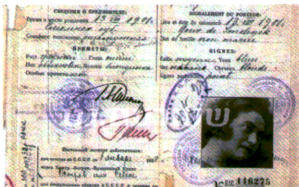
2. תעודת הזהות של מוסיה שניאורסון שהוצאה בברית המועצות, בטרם נישואיה.