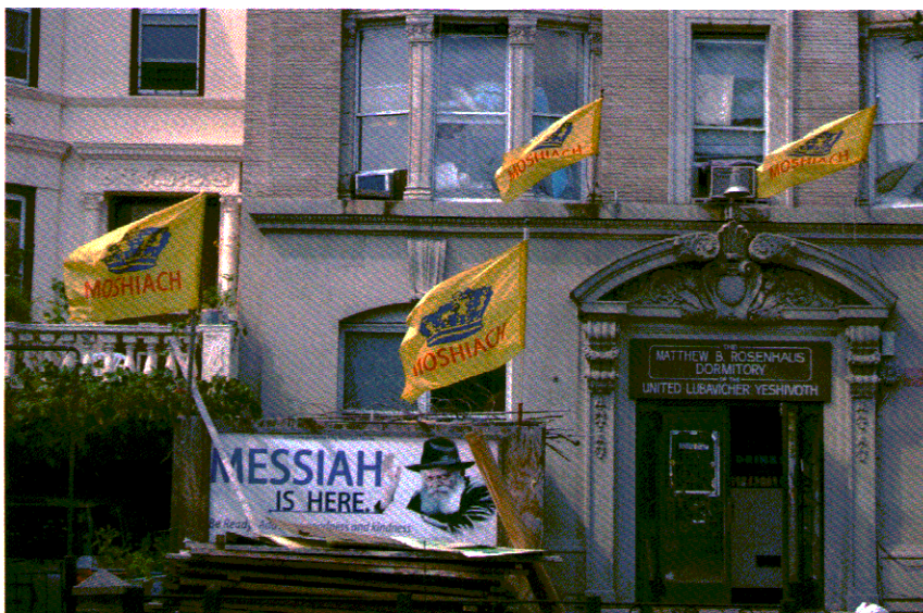
28. הכניסה לשיבת לובביץ' באיסטרן פארקוויי, ולצדה דגלי המשיח הצהובים וכרזה גדולה המכריזה "המשיח כאן" (כבר הגיע), בשנת 2009. (אוסף המחברים)