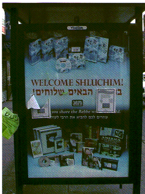
26. שלט על תחנת אוטובוס בקראון הייטס בניו יורק, המברך את הבאים לכינוס השלוחים של שנת תשס"ז (2007).