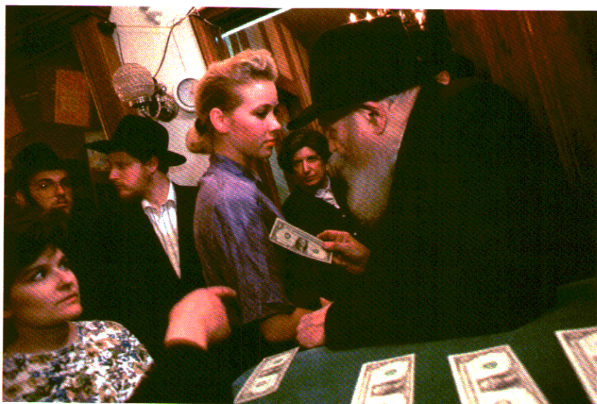
16. הרבי "מחלק" דולר לאישה צעירה. מאחוריה גברים ונשים ממתנים ל"חלוקת הדולרים".