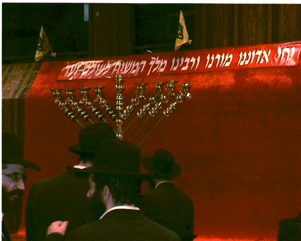
24. חג החנוכה שנת תשס"ח (2008) בבית המדרש ב־770 (איסטרן פארקוויי). על הדוכן ניצבת מנורת החנוכה הגדולה, בעלת הצורה הזוויתית המיוחדת שקבע הרבי, ומעליה נראה השלט "יחי אדוננו מורנו ורבינו מלך המשיח לעולם ועד". (אוסף המחברים)