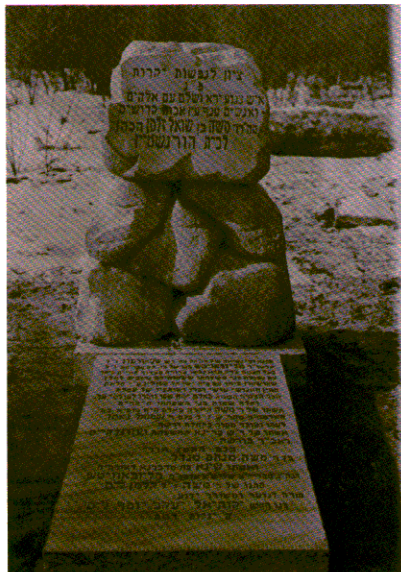
15. אנדרטה בבית הקברות באוטווצק לבני משפחת הורנשטיין שנרצחו בשואה.