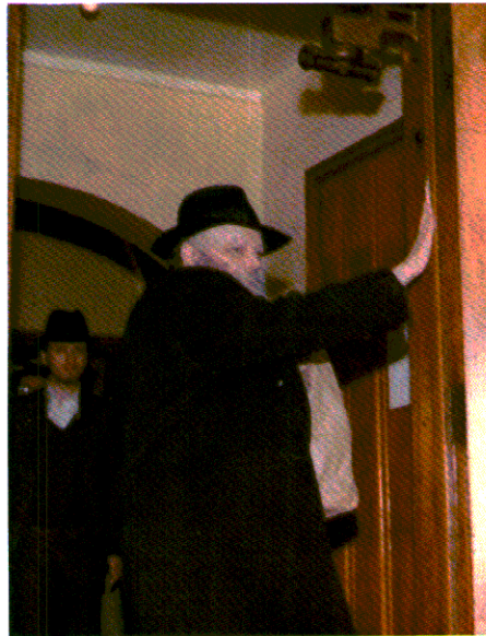
18. הרבי לפני צאתו ל"ציון" של חותנו, יוסף יצחק שניאורסון עם שקית הפ"נים (פדיון נפש) תחת זרועו.