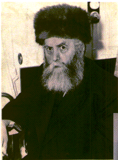
5. הרבי יוסף יצחק שניאורסון (ריי"צ), האדמו"ר השישי, חבוש שטריימל (ספורדיק) לראשו.