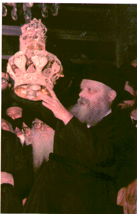
17. הרבי, לבוש בסירטוק וחגור בגארטל, עומד להניח כתר על "ספר תורה של משיח".