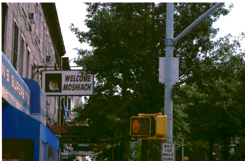
29. שלט בשדרת קינגסטון בקראון הייטס, בשנת 2009, ועליו ברכת "ברוך הבא משיח". (אוסף המחברים)