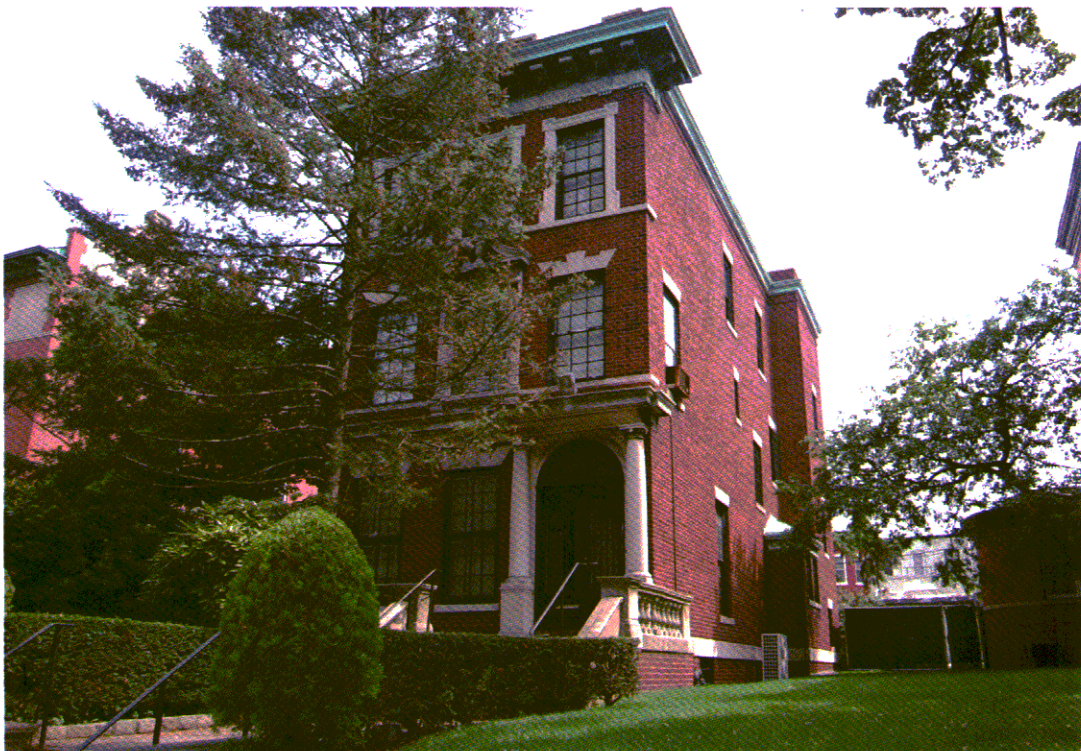
20. ביתם של הרבי מנחם מנדל שניאורסון ומוסיה (חיה מושקא) ברחוב פרזידנט מס' 1304 בקראון הייטס, ברוקלין, ניו יורק.