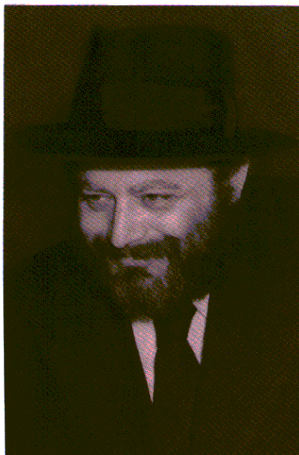
11. רבי מנחם מנדל שניאורסון (רמ"ש), האדמו"ר השביעי, חבוש מגבעת פדורה, לאחר שנחמד דינה, אלמנתו של הריי"צ, סירבה להעביר לו את השטריימל, העברה המסמלת את האצלת הכהונה.