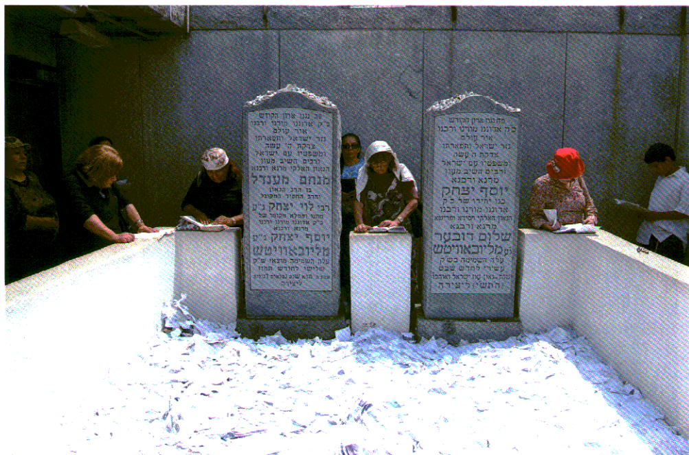
22. ה"ציונים" בתוך ה"אוהל" – מצבותיהם של הרבי יוסף יצחק, "האדמו"ר השישי", והרבי מנחם מנדל, "האדמו"ר השביעי". חלקת הקבר מכוסה כולה ב"פ"נים" – פתקי פרדיון נפש.