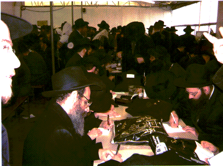
19. חסידים בקרוואן שליד בית הקברות הישן מונגטיפיורי בקווינס, ניו יורק, כותבים פ"נים, לפני היכנסם ל"ציון".