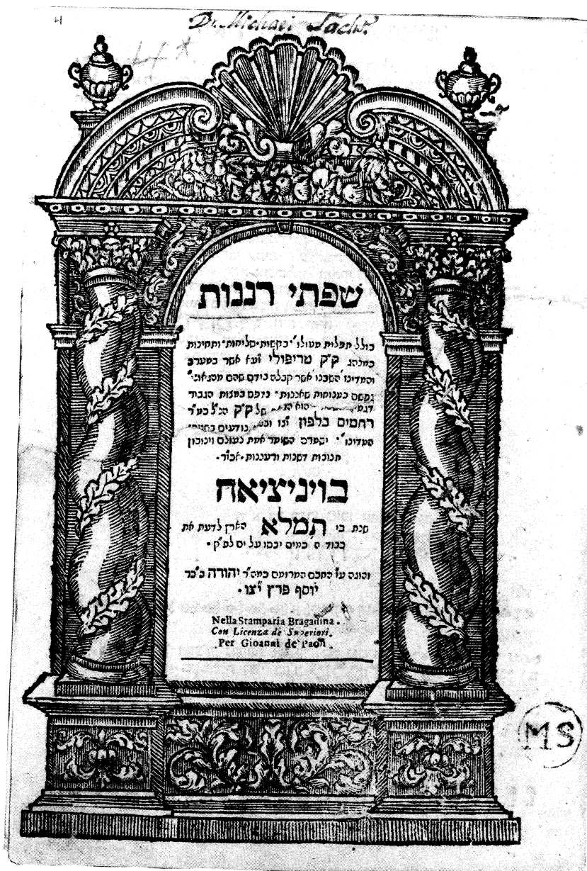
שער שפתי רננות, ויניציאה תע"א (1711)

סליחות". 12 בראש תפילת נעילה נדפס בלשון אחת בשניהם: "אתחיל תפלת נעילה וצריך להתפלל אותה בעוד היום כדי שישלים אותה סמוך לשקיעת החמה". וכאן אפילו הסידור