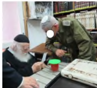
ההורים ממעטים בחומרה

חזר מהצבא בלי שלום רוחני (תמונה אילוסטרציה)