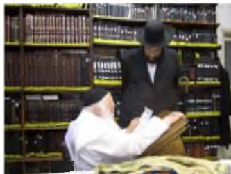
שלום גשמי או רוחני

ידידנו הבלתי נשכח, רש"י קרליבך במחיצת רבו להבחיל רבנו שליט"א