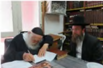
האמת ללא שום סטיה

רבינו שליט"א כותב מכתב ברכה לספרו של הגר"י דרדק.