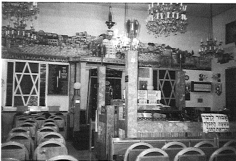
3. בית הכנסת בשכונת בורוכוב- מראה מבפנים