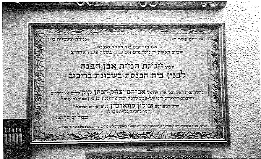
1. הזמנה לטקס הנחת אבן הפינה לבית הכנסת בשכונת ברוכוב (תלוי כיום בבית הכנסת)

בעשרות השנים האחרונות, וגם בתקופתנו אנו, עולים מדי פעם בפעם ויכוחים מחודשים מסוג זה, בין היתר בנקודות יישוב קיבוציות וחקלאיות שונות, המוסיפות על גרעין המקורי שכונות עירוניות וקהילתיות, ונאלצות להתמודד כפועל יוצא של הדברים גם עם צרכיהם של המתיישבים החדשים, שאינם עולים תמיד בקנה אחד עם אמונותיהם הם. ואם גם דומה שיהיה זה מופרז לומר כי ניתן להסתייע בניסיון של שלושת שכונות הפועלים על מנת להגיע לפתרונות עכשוויים בסוגיות אלו, הרי שבכל זאת, מן הראוי לזכור כי עימותים מסוג זה כבר התקיימו בעבר, לעיתים בחריפות רבה, ולאחר שנים אחדות – ללא יוצא מן הכלל – שקעו כמעט לחלוטין בתהום הנשייה.