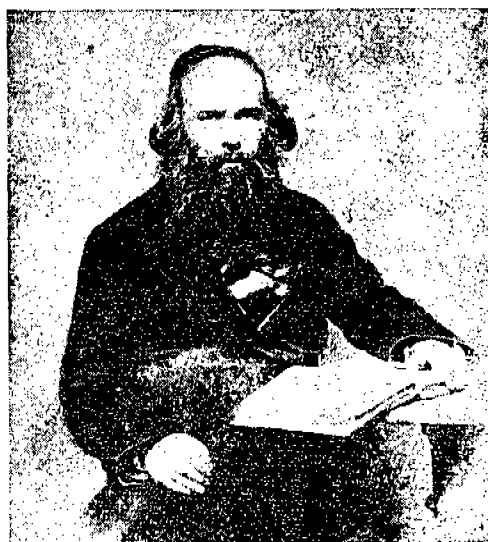
רבי מתתיהו שטראשון ז"ל שרידי ספרייתו בוילנא יגיעו מיוז"א בניו יורק לירושלים