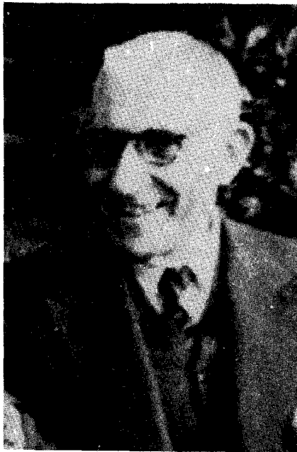
ההיסטוריון יוסף נחמה