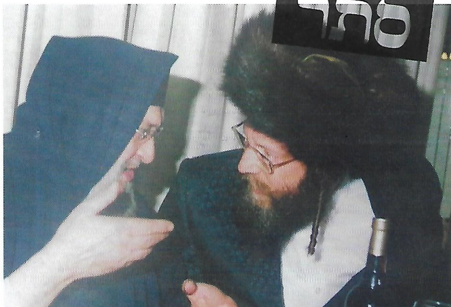
בסוד קדושים. עם יבלחט"א האדמו"ר רבי ברוך אביחצירא