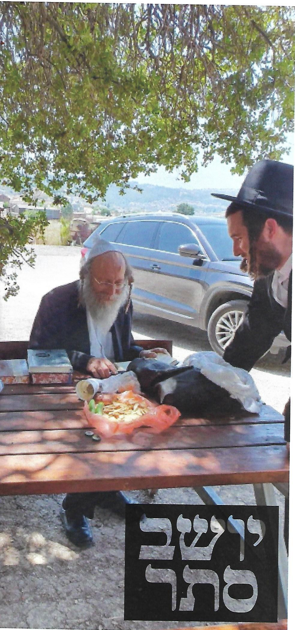
מהלך בצידי דרכים. עם ספריו בפינת חמד בציוני הצדיקים בגליל

אלו השנים תשל"ב עד תשל"ד, שנים בהן נמסרו השיחות של הספר 'שיחות מוסר', וחלקים נכבדים מהספר עברו את עיונו והגהתו.