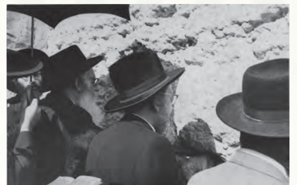
מרן ה"נתיבות שלום" עם חותנו מרן ה"ברכת אברהם" זצוק"ל בכותל בשנת תשכ"ז

מעניין לציין כי רבנו ביקש והציע אז למארגני העצרת, להוסיף בין התפילות והסליחות הנאמרים בעצרת, את התפילה הנאמרת בסליחות שני וחמישי: 'ה' אלוקי ישראל שוב מחרון אפך והינחם