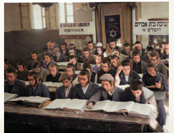
חביבים כבנים. תלמידי ישיבת 'בית אברהם' בימי קדם (התמונה עברה עיבוד צבעוני)

מרן האדמו"ר מסלונים שליט"א מעלה תמיד ברגשי הוד, כיצד היה אביו הק' זי"ע מספר ומתאר איך עברו עליו השנים שקדמו להקמת הישיבה, את סערת נפשו באותם הימים, כאשר הרגיש שכל בית סלונים בחוץ לארץ נשרף ולא נותר ממנו מאומה - ומה יהיה כאן? הרי זה דבר שלא שייך להעלות על הדעת שסלונים תחלוף ח"ו מן העולם. "זכורני כילד קטן בעת שהתגוררנו בתל אביב, שהיה יוצא אל שפת הים ויושב שם בשתיקה שעות ארוכות. כעבור שנים סיפר, כי באותם ימים לא מצא מקום לעצמו מרוב סערת הנפש שהתחוללה בו, רק הים היה משקט קמעא את סערת רוחו הגדולה. הוא היה הולך שם לבדו ויושב מול הים באין איש עמו, כבר אז היו כל מחשבותיו נתונות לטוות את תכנית הקמת הישיבה. הוא ידע כי קשיים רבים עומדים בדרכו והיה צריך לתכנן