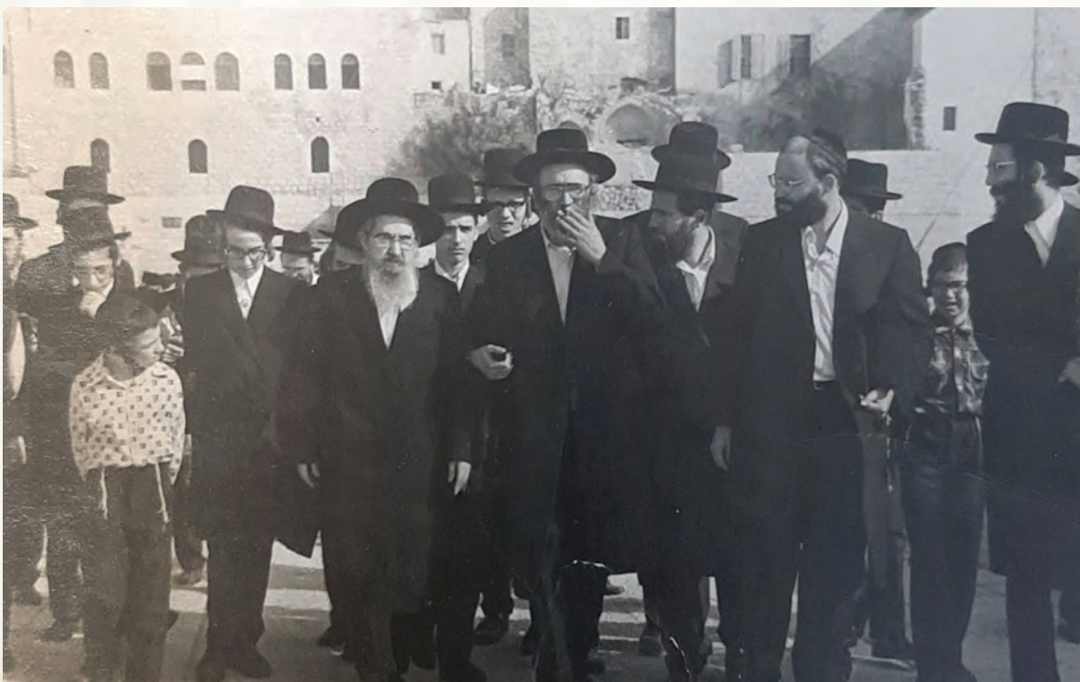
ולירושלים עירך. רבנו מגיע לתפילת רבים ברחבת הכותל המערבי

פעמיים ביקר מרן ה'בית אברהם' בארץ ישראל בקרב חסידיו וביקש לקבוע בה משכנו, אלא שלא איסתייעא מילתא והסתלק לשמי רום, תקופה קצרה אחרי ביקורו השני בארץ ישראל בשנת תרצ"ג. בימי ביקוריו בארץ הקודש, לא הסתיר את חיבתו והתפעלותו מהארץ הטובה, ולשאלת סופרים מקומיים שניסו