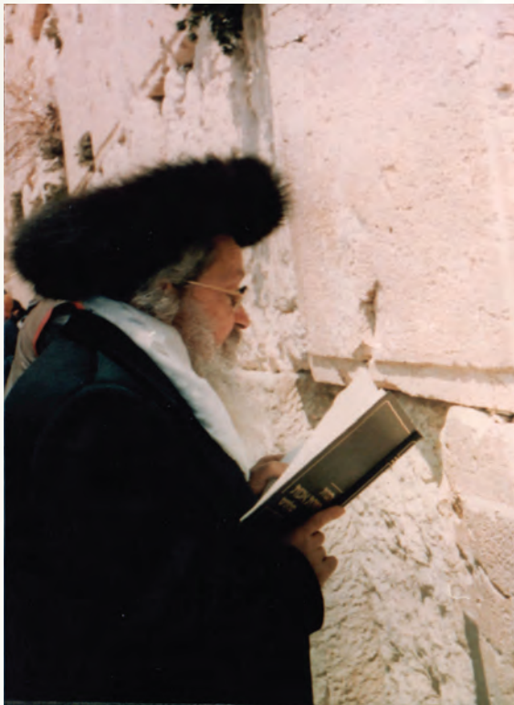
כל אשר לך שלום. שופך צקון לחשו לפני אבני הקודש בשריד בית מקדשנו

וכך כותב רבנו באחד המקומות: "הכוח לזכות לבחינת ירושת הארץ, לקבל קדושתה של ארץ ישראל, הוא על ידי האמונה בהנהגה העל-טבעית. וכל המדרגות של ארץ ישראל הם בבחינת מעל הטבע, כמו שכתב הכוזרי כי בארץ ישראל מאיר אור האלוקות