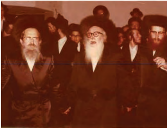
דרך אמונה בחרתי. רבינו עם חותנו כ"ק מרן אדמו"ר ה"ברכת אברהם" זצוק"ל בחתונת הגר"י קפילוביץ שליט"א

מרן זי"ע דבר עמי לפני החתונה שלי שצריך להכין מה לומר בחדר ייחוד. והביא לי דוגמא מחתן אחד שאמר בחדר ייחוד: הרי על פי שיטתנו אמונה היא היסוד ואנחנו רוצים שהבית ייבנה על יסודות טובים אז הבה נתחיל מאמונה, וחזרו ביחד את האני מאמין.