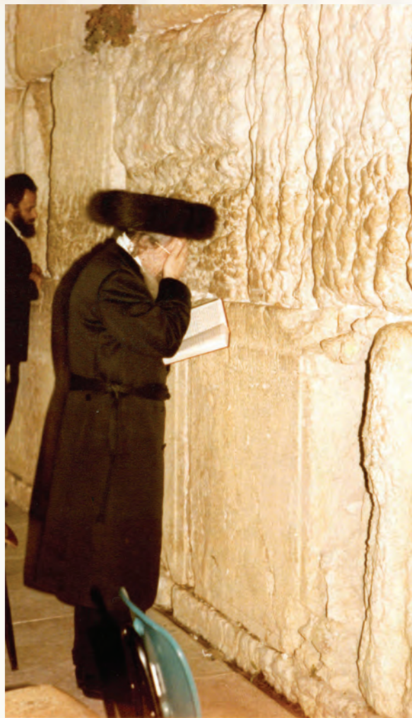
שיכורת ולא מיין. דבוק בשרעפי קודש לפני אבני הכותל