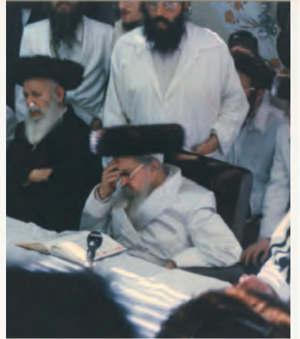
רועה נאמן. רבינו בדביקות

"כן סיפר אאמו"ר שליט"א, כי אא"ז זצ"ל היה מיוחד בהרבצת תורה. כששמענו שיעורים ממנו הרי יותר מעצם החידוש בסוגיא למדנו עוד יותר ממנו את העריכה של הסוגיא. כעין הנדסה של העניין. הוא היה בונה עורך ומסדר, בהתחלה היה שואל שאלות, ואח"כ היה החידוש, ואח"כ מה אפשר עתה לבאר בכל העניין לפי החידוש. אי אפשר להקשות מיד בהתחלה מאה קושיות, רק צריך