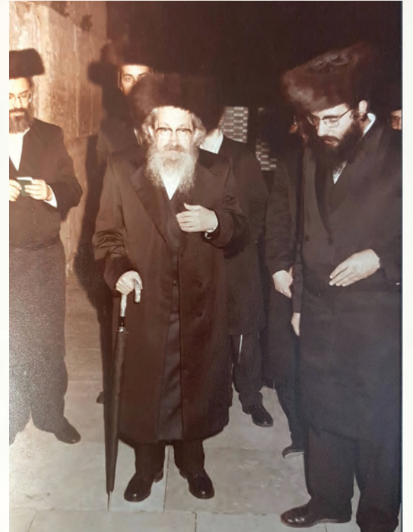
ביציאתו מה הוא אומר. רבנו בצאתו מתפילה בכותל המערבי