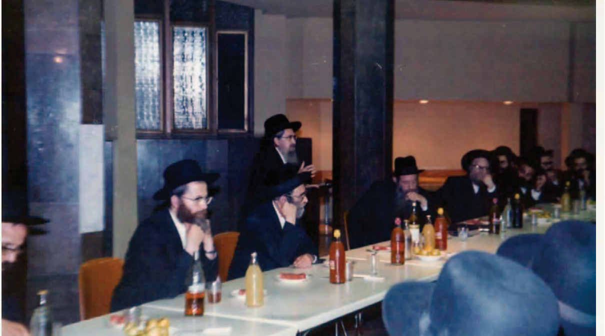
מידות מעל הכל. במסירת שיחה לבני הישיבה בעת ביקור האדמו"ר מנובומינסק בישיבה

אחד שהתמנה למנהל חינוכי בתלמוד תורה הגיע לקבל את הדרכתו, אמר לו אדמו"ר זי"ע: "האמת שהיין צריכים לשבת שעות ארוכות ולשוחח, אך מה אעשה ואין בכוחי לעשות זאת. על כן אמסור בידך כלל אחד, לאחרונה התאספו פה הצוות של