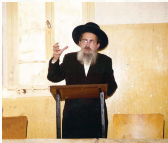
בלתי לה' לבדו. בכנס חניכי הישיבה - ניסן תשל"ז