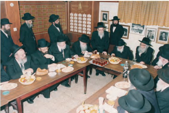
אלוקי בך בטחתי. רבינו נואם באסיפת הנהלת החינוך העצמאי, לצדו כ"ק מרן האדמו"ר ה"פני מנחם" מגור זצוק"ל, מרן הגרא"מ שך זצוק"ל