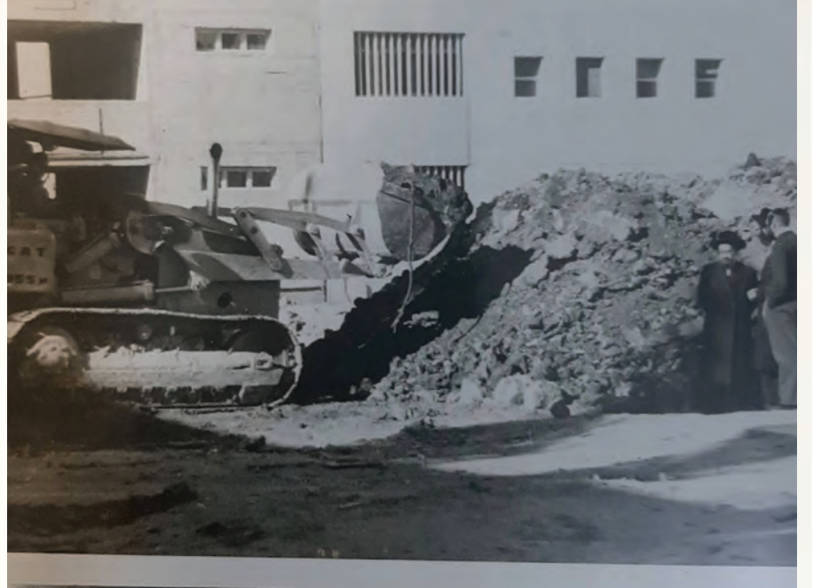
להציל את הרוח. רבנו מבקר באתר הבנייה של הישיבה בימי ההקמה