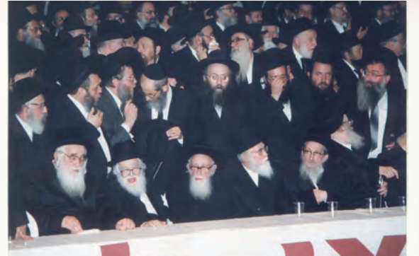
להזכר ברבש"ע בכל עת. בכנוס למען רשימת 'יהדות התורה' לקראת הבחירות סיון תשנ"ד, נראים מרנן ורבנן כ"ק האדמו"ר ה"אמרי מנחם" מאלכסנדר זצ"ל, רבינו, הגרי"ש אלישיב, הגרש"ז אויערבאך, הגרא"מ שך, כ"ק האדמו"ר ה"ישועות משה" מויזניץ זצוק"ל