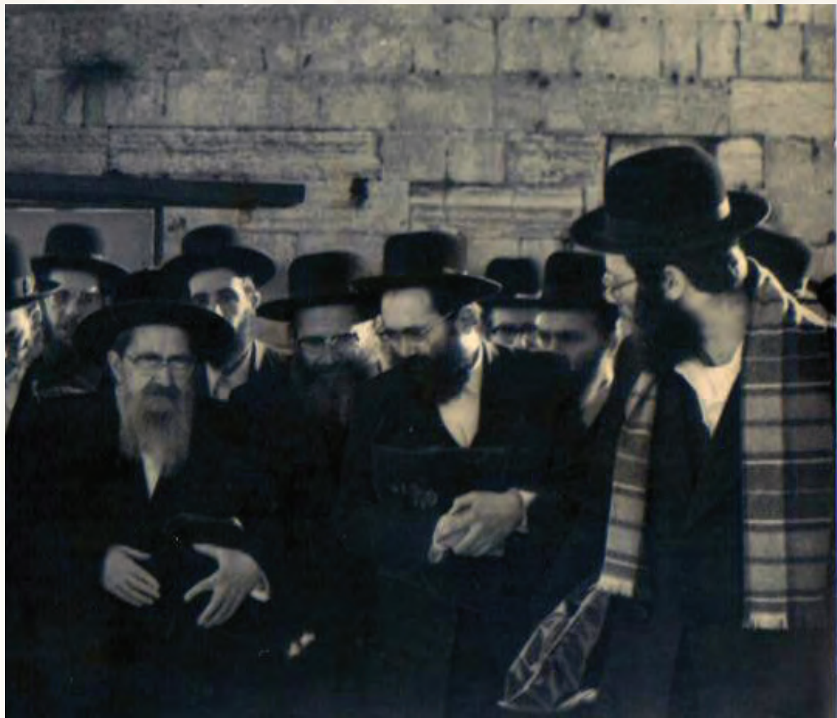
חבוקה ודבוקה בך. בחזור מתפילת שחרית בכותל המערבי עם יבלחט"א בנו כ"ק מרן אדמו"ר מסלונים שליט"א

הקודש ירושלים בפעם הראשונה, סיפר רבנו לימים, "מיד ידעתי והרגשתי פה אשב כי אוויתיה".