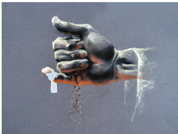
כהן כורך צלצול קטן על אצבעו. הצלצול הוא סרט בד, שאין ברוחו ג' אצבעות. בכל זאת, על פי דעת רבי יהודה בנו של רבי חייא, יש בכריכתו משום "ייתור בגדים", מפני שיש בו חשיבות.

אפוא, שגם הל' ח עוסקת בסוג זה של חציצה, וכוונת הרמב"ם לחלק כך: כאשר יש חציצה בין בשרו לבגד, או בין בשרו לכלי – אפילו נימה אחת חוצצת (כלשונו בהל' ו: "אפילו נימה אחת, אם היתה בין בשרו לבגד – הרי זו חציצה ועבודתו פסולה"). ואילו כאשר החציצה איננה במקום הבגדים – הרי היא חוצצת רק בשיעור ג' אצבעות. נמצא שאף לדעת הרמב"ם אסור להוסיף בגד שלא במקום בגדים, אבל אין זה מדין "ייתור בגדים" אלא מדין "חציצה" 7 .