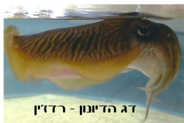
דג הדיונן - רדזין

לאחר הבישול ביורה עם הסממנים נהפך הדם לנוזל צהוב שממנו אפשר לצבוע בו. ואם נחשף במהלך הצביעה לשמש נצבע ממנו תכלת. לאחר זמן מועט שמתחמצן באויר. ואם לא נחשף לשמש נצבע סגול.