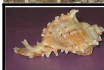
פרפורא ארגמן חד קוצי