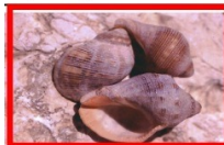
פרפורא אדומת הפה צובע אדום