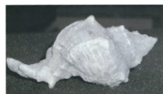
חלזון שניקו את הפסולת מעליו