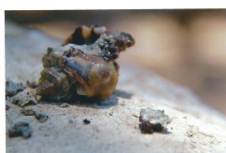
חלזון לאחר פציעתו