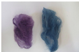
בעיניי ראיתי-אצלי בבית ראה עדות אישית (עמ' 55)