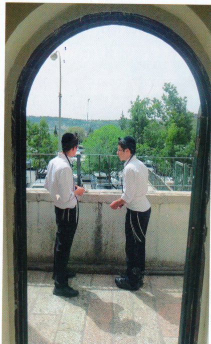
תפילין לאורך כל היום. תלמידי הישיבה