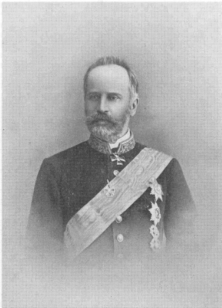
מושל מוהילוב (1872–1893) אלכסנדר סטניסלוביץ' דמבובצקי