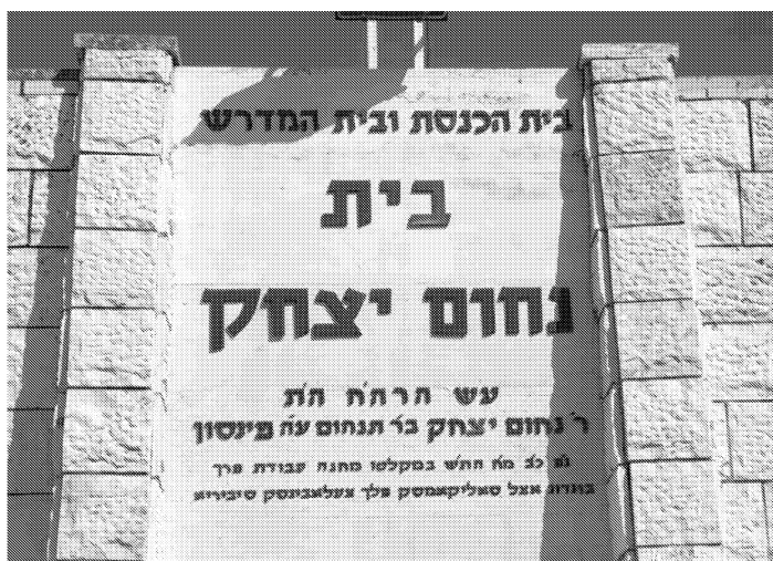
כתובת זיכרון בחזית 'בית נחום יצחק' בכפר חב"ד