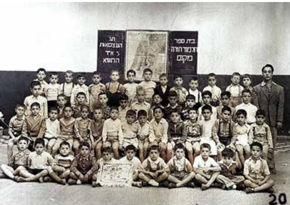
נלחמים על החינוך. תלמוד תורה במקנס, תש"א

מדרך התורה, רחמנא ליצלן. בקהילות מרוקו מציאות של יהודי חילוני במוצהר מהסוג הקיים בארץ ישראל, כמעט לא הייתה מוכרת. אפילו אנשי אליאנס, הרחוקים מתורה, נאלצו להוסיף קורטוב של יהדות לתכניות הלימוד שלהם. ההורים המרוקאים לא העלו אפוא בדעתם שבארץ ישראל קיים חינוך שאין בו לפחות מרכיב כלשהו של שמירת מסורת.