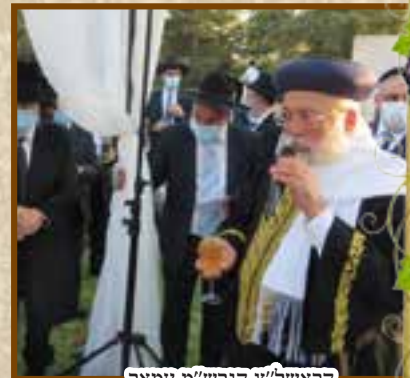
הראשל"צ הגרש"מ עמאר בסידור קידושין