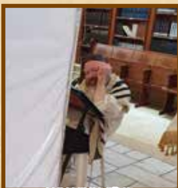
הגה"צ רבי יעקב עדס