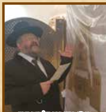
הגר"י הרעי רבה של באר שבע