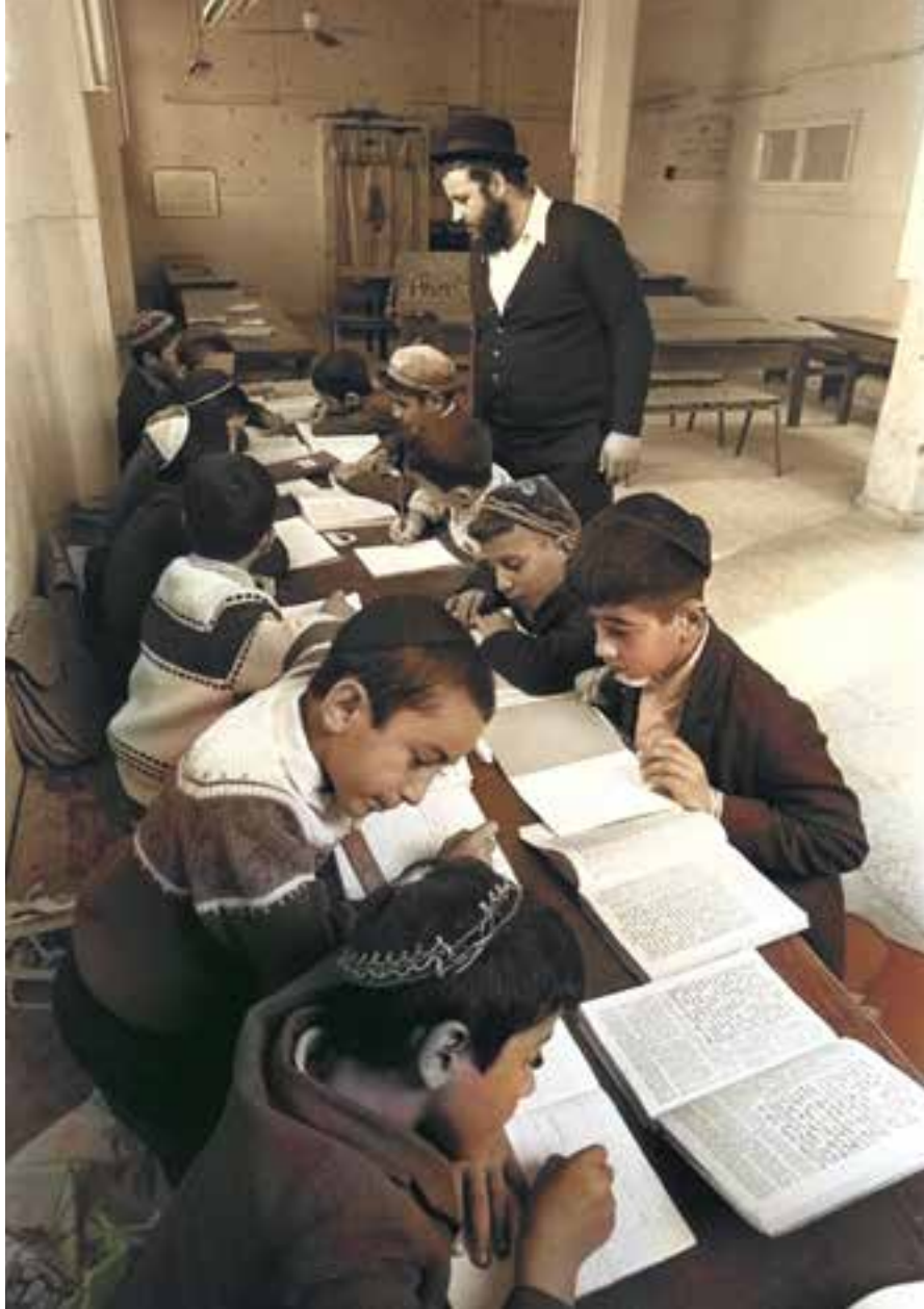
ילדי עולים לומדים תורה בארץ ישראל (צילום אילוסטריציה)

כדי להרגיע את ההורים השתדלו שליחי עליית הנוער לשוות לעצמם חזות של שומרי מצוות. נאמר להורים כי ילדיהם יזכו ליחס הטוב ביותר, והללו בתמימותם לא העלו בדעתם כי מבחינת המחנכים החילוניים בארץ ישראל, "הטוב ביותר" הוא דווקא הרחקתם