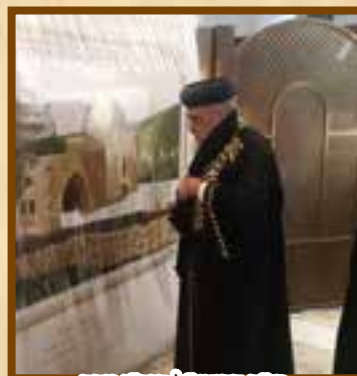
מו"ר הראש"ל הגר"י יוסף