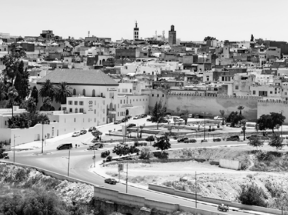
חכמים וסופרים. מקנס, מרוקו