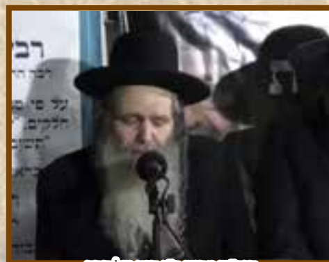
הגר"ש ארוש ר"י חוט של חסד