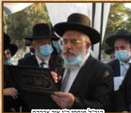
הגר"ל פנחסי ר"י אור אברהם בקריאת הכתובה