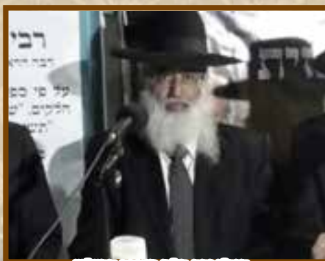
הגר"י יפת רח"מ מאורת הרש"ש