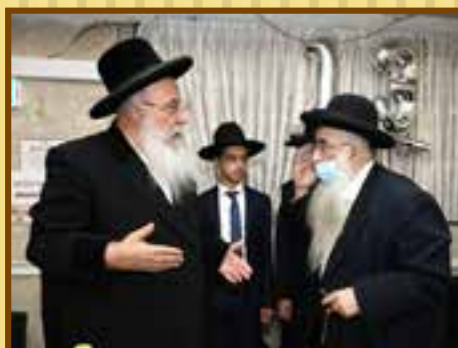
הגר"ד כהן מגיד שיעור בישיבה