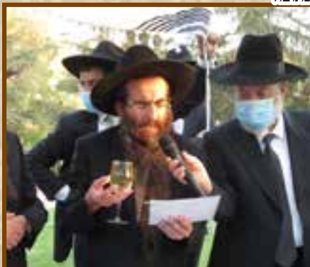
הגר"י פנחסי בברכה