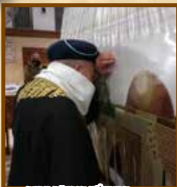
הראש"ל צ' הגרש"מ עמאר