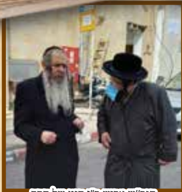
הגר"ש ארוש ר"י חוט של חסד