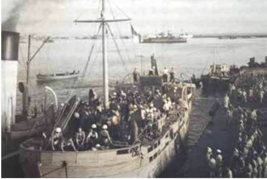
העפלה לארץ ישראל (צילום אילוסטרציה)

ה'אליאנס', הפתרון היה בהקמת תלמודי תורה לתפארת. המענה לסכנת עליית הנוער יהיה אפוא בהקמת מפעל מקביל - 'עליית הנוער התורנית' - גוף שיפעל להעלאת הנוער היהודי מצפון אפריקה לארץ ישראל תוך שיבוצם במוסדות תורניים ובישיבות קדושות.