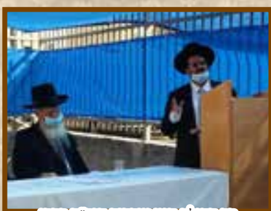
רב קהילת חזון עובדיה הגר"ח כפרי