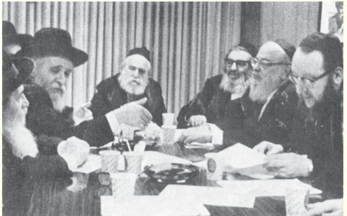
עם גדולי תורה בארה"ב. נראים מימין מרנן ורבנן הגר"ב סרוצקין, הגר"י רודרמן, רבינו, במרכז הגאון רבי משה פיינשטיין, כ"ק האדמו"ר מבוסטון ב"פ, כ"ק האדמו"ר מנובומינסק זצ"ל

"אירע פעם ורבנו נסע בקיץ למקום נופש לתקופה מסוימת ובאותה העת במקום אחר בריחוק של כשעתיים נסיעה שהה האדמו"ר מראדזין זצוק"ל. באחד הימים נראתה דמות חסידית מתקרבת לעבר משכנו של רבנו במקום הנופש, כשהתקרב יותר זיהה רבנו שזהו האדמו"ר מראדזין. אפשר תמיהתו של רבנו על כך שהאדמו"ר הטריר את עצמו להגיע אליו, הסביר האדמו"ר: "היום הוא יומא דהילולא של הרבי ר' בונים מפרשיסחא זצוק"ל ובמקום בו אני שוהה לא מצאתי מישוה שאוכל לציין עמו יום זה ע"י עיסוק בתורתו ובמשנתו של בעל ההילולא, והנה נזכרתי כי כבודו נמצא כאן והשתוקקתי להיפגש עמו להיות נדבר