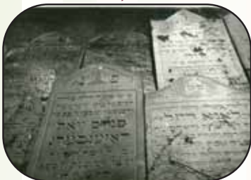
מצבות מבניה"ח באושפיצין

בעיר אושפיצין שבפולין התנוסס עד השואה אוהל קברו של הרה"ק רבי בעריש מאושפיצין זי"ע, מתלמידי החוזה מלובלין זי"ע וממאורי החסידות בפולין, שנסתלק ביום כ' כסלו תקצ"ח. מסופר כי ביום פטירתו הגיע לבקרו הרה"ק בעל ה'אריה דבי עילאי' זי"ע מווישניצא, אך עם הגיעו לאושפיצין נסתלק רבינו. במסע ההלוויה הספידו ה'אריה דבי עילאי', ובסיימו את דבריו פרץ בבכי גדול עד שלא יכול היה להוציא הגה מפיו ואחר זמן הגביה את ראשו וקרא ואמר: