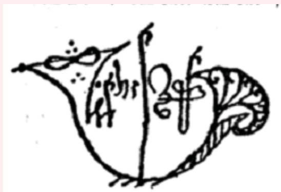
חתימת רבי אברהם אזולאי

האחרים הוא ששה בעשרות הם (כ"ד) [כ"ח], במאות (תכ"ו) [תצ"ו], באלפים ח' אלפים (קכ"ד) [קכ"ח]. אלה הם חשבון השווה בחלקיו שכל החלקים שבו עולים ושווים כמוהו, כמו שישה שיש לו חצי ושליש ושתות וכולם ששה, וכן בכל מערכה. אך כוונתי [כוונתו] במניין שחלקיו הנמצאים בו הוא הנקרא מניין הנאהב והם עצם הדבר, ומניין רפ"ד החלקים הנמצאים בו שהם שווים עולים ר"כ ור"כ הוא המניין הנאהב במניין רפ"ד, יש א' ב' ד' העולים אלה החלקים שבעה ויש מחצית העולה מאה