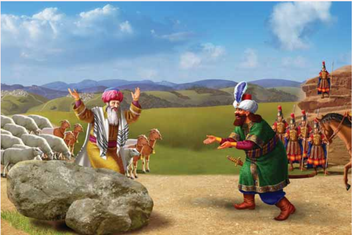
חכמה מיוחדת במשלוח המנחה לעשיו | מלכות וקסברגר

ועוד הוסיף, הפער בין מספרי הבהמות ששלח יעקב לעשו