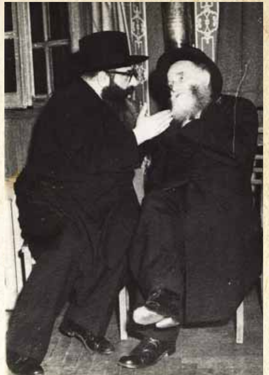
גדול ונערץ. מרן הגאון רבי אהרן קוטלר זצ"ל בשיחה עם רבינו

"והנה הצליח הרב הוטנר להאציל ולהשרות את מרותו על כל הוויית תלמידיו חניכיו עד העלותם למדרגת חסידים-מעריצים, שדי להם ברמיזא בלבד למלא את רצון רבם. אכן כמה גדולים הם כוחותיו של הגר"י הוטנר שהצליח להעמיד להקות של לומדים גדולים, בעלי שיטה אמיצה ביהדות, שאינם נרתעים מפני כול ובה בשעה מוכנים הם להתמסר על רמו קל של רבם, ראש-הישיבה. "הרב הוטנר" זה כבר לא שם בלבד, כי מייצג הוא תופעה