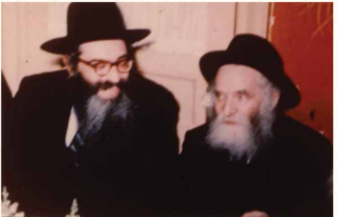
אמן המחשבה. בשיחה עם מרן רבי אהרן קוטלר זצ"ל

"... על אף שהרבה רבנו לעסוק בתורת הקבלה והיה בקיא גדול במכמניה, בכל זאת אחז בשיטת קדמונים שצריך הדבר להיעשות בצניעות ולהישמר בסתר ולכן לא הרבה לדבר על כך ואף בשיחותיו מיעט להשתמש במונחים קבליים ..."