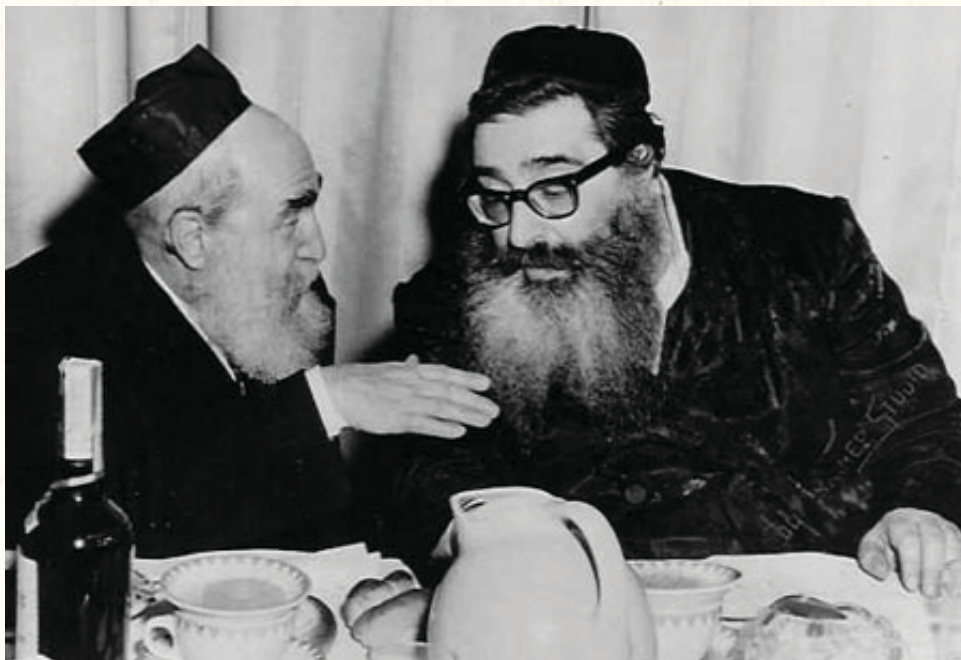
אמן החינוך. מרן הגאון רבי משה פיינשטיין זצ"ל בשיחה עם רבינו