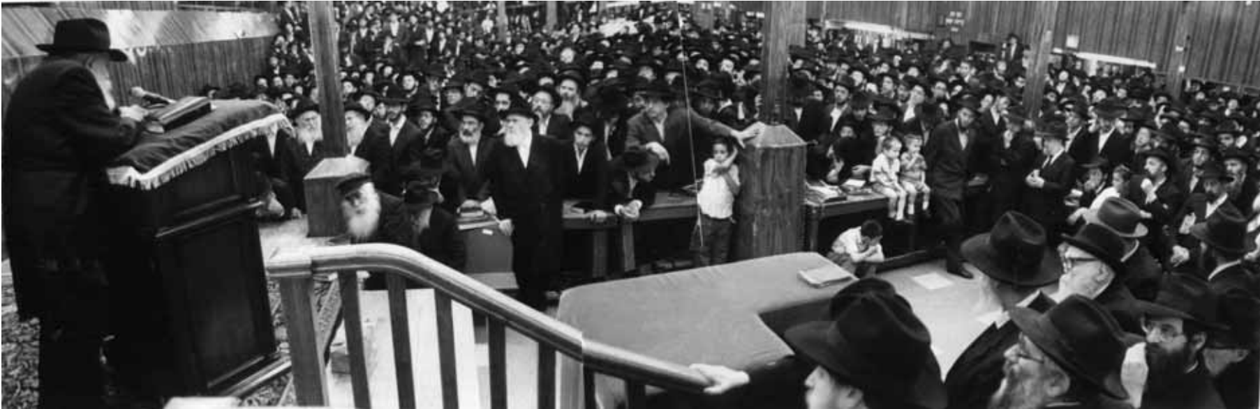
המונים נקהלים בבית המדרש הגדול '770' בימי חייו של כ"ק מרן אדמו"ר מליובאוויטש צוק"ל | ארכיון אהרן ברוך ליבוביץ

"לפי זה נמצא שישנם שני ימים בשמחתו של האדמו"ר הזקן: י"ט כסלו היה 'יום בשורה' כי עדיין לא נגאל באמת שהרי היה בבית המתנגד, וכ' כסלו היה 'יום גאולה'... ומלבד זאת, הרי אנו המתגוררים בחוץ-לארץ בגלות צרפת, יש לנו לחגוג גם יו"ט שני של גלויות... א"כ י"ט-כ' כסלו המה יומא אריכתא של ימי בשורה וגאולה..."