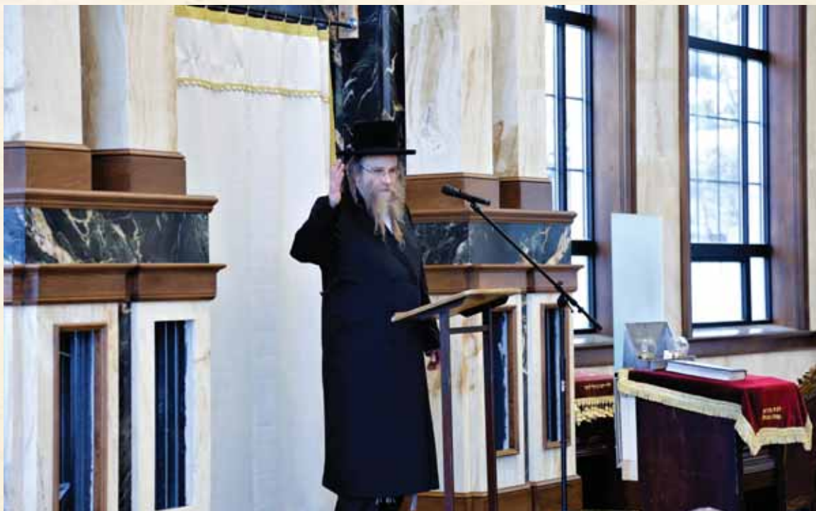
שאלות שונות הנוגעות לכל אחד. כ"ק האדמו"ר מקאסוב שליט"א משמיע אמרות חן

"...כשמדברים כל-כך הרבה על חינוך הילדים וכפי שאנו רואים באמת יש רצון טוב להורים לחנכם ולגדלם לתורה ולמצוות, יש לדעת בראש ובראשונה כי האב עצמו צריך להקפיד על אורחות חייו שיהיו תואמים על פי ההלכה, ורק אז יוכל לתבוע מהילד שיעשה כך..."