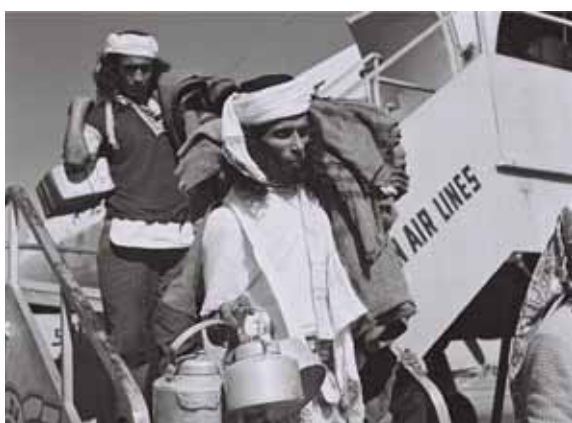
שבעים שנים של טיוח לא יגלדו. עליית ילדי תימן

סקירה נרחבת על השאלה ההלכתית הכאובה ורבית-המשקל שהובאה בחודש האחרון לשולחנם של גדולי הרבנים, עם ההתפתחויות המשמעותיות ביחס הרשויות לתעלומת ילדי תימן "את אחי אנכי מבקש, הגידה נא לי איפה הם!"