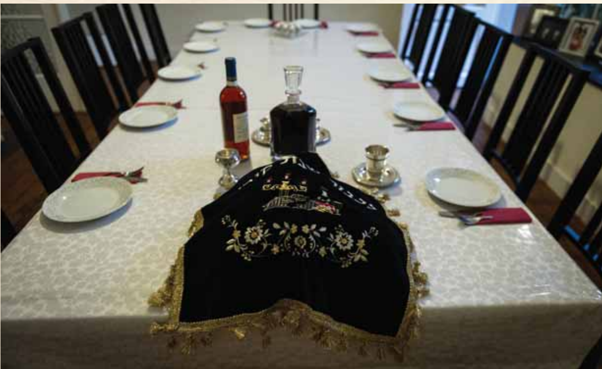
אווירה נעימה. שלחן שבת

מכאן נגזרת גם התשובה לשאלה: אבא שרוצה להנעים את סעודת השבת, מעיין בספרים אחרי התפילה ומחפש 'ווארט' יפה לומר לפני הילדים. עכשיו הכול תלוי בו ובהתנהגותו, כי אם יעשה זאת בתור 'טובה' לילד שיהנה ותהיה אווירה נעימה בבית, הילד קולט ומבין מיד שמדובר באחיזת עיניים לשמה והאב אינו באמת מתעניין ב'ווארט' ובמשמעותו. אם הילד רואה את האב אחרי התפילה עומד ב'קופקע' ומתלהט בדיבוריו על הבלי העולם הזה או פוליטיקה ורכילות, ואילו בשעת הסעודה בהגיע זמן אמירת