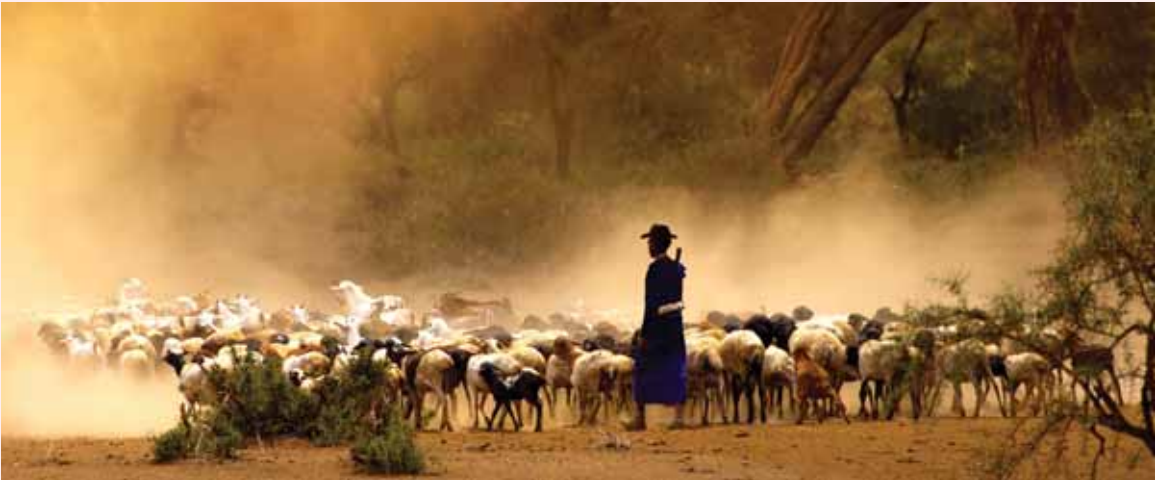
סוד נסתר . עדר תיישים

לאחר כל ההקדמה הארוכה, נבין את דברי רב נחשון גאון. בתורה נכתב כמה בהמות שלח יעקב, אך לא נכתב בפסוק וגם לא מובא בחז"ל כמה בהמות נותרו לו ליעקב. רב נחשון גאון כתב שיעקב נתן 220 ונותרו בידי 284 בהמות, והוא מביא רמז לך מדברי יעקב בפסוק (לב, כא) כי אמר אכפרה פניו במנחה . תיבת אכפרה נחלקת אכ-פרה, היינו שליעקב נותרו בהמות כמניין פרה (285) אולם אך בא למעט (1) ולכן נותרו בידי יעקב 284 בהמות. והנה, 220 הבהמות ששלח, עם 284 שנותרו הרי הם מספרים ידידים-מספרים אהבים! לכן שלח לו יעקב לפייסו את המניין הזה.