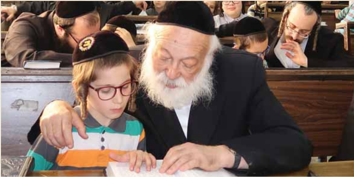
אוריה מרוממת. סב לומד עם נכדו (אילוסטרציה, למצולמים אין כל קשר לכתבה)

לנצל את זמנה של סעודת ליל שבת, לשוחח על הכוח הגדול שיש בתפילה ועל הזכייה שיש לנו לדבר עם הקב"ה פנים אל פנים. אבל שוב, כפי שדיברנו מקודם, הדברים צריכים להיאמר באווירה חיובית ורצינית, לא בצורה של אמירת דרשה על חשיבות התפילה, אלא להעלות את הנושא מפעם לפעם ולחדד את המסרים בפני הילדים כמה חשובה היא התפילה ואיזה טעם נפלא יש לכל אחד אחרי התפילה ברוב עם הדרת מלך.