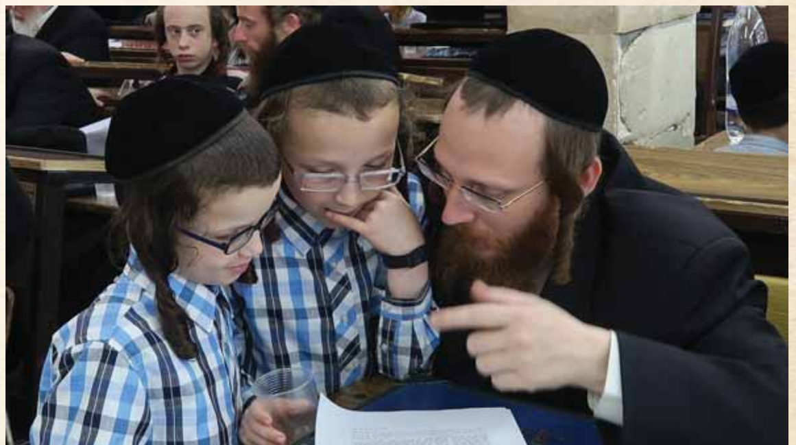
אמירה רכה. אב לומד עם בניו (אילוסטרציה, למצולמים אין כל קשר לכתבה)

כהמשך ישיר לכך, חשוב לדעת לגבי מה שנוגע יותר לחינוך הילד עצמו, שהאב לא יעמוד עליו בסגנון של שוטר שדורש ממנו למלא את ציוויי תיכף ומיד, כי נעימת התפילה וחשיבותה צריכה להיכנס לליבו של הילד על ידי אמירה רכה. אפשר בהחלט