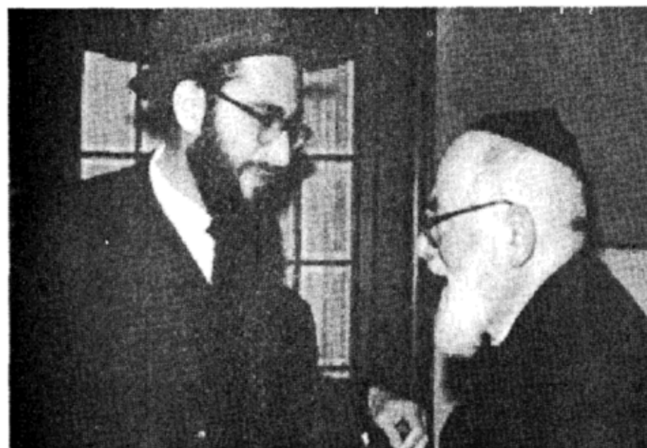
יתד נאמן, מוסף שבת קודש

לחיות באמצעות מזון ומחיה יהודיים, "לחיות" כשר, שחיטה, ברכה לשחיטה, פיקוח על השחיטה, כל דיני השחיטה, ללמוד מסכת חולין, ולזה צריך חכמה גדולה. כמו ברפואה, כאשר מכתוב רופא לחולה את הדיאטה, הוא מכתוב לו על המרשם - את זה תיקח ואת זה אל תיקח, לחולה יש את המרשם והוא שומר עליו, אבל הרופא צריך היה ללמוד חמש שנים עד שהוא הגיע לכך שהוא יכול לכתוב את אותו המרשם. כך זה גם אצלנו, אם