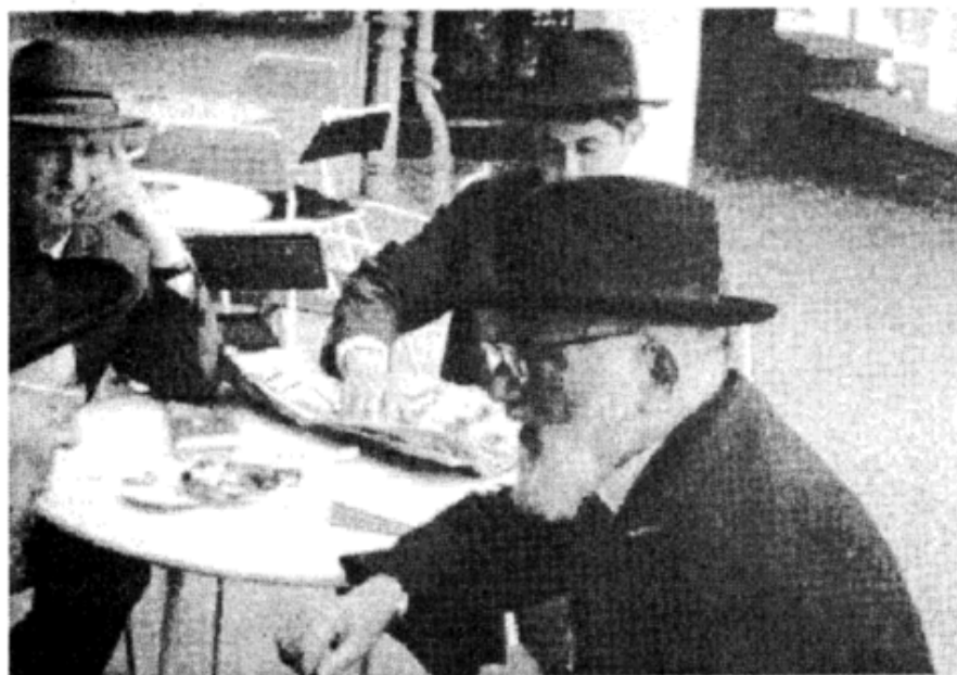
יתד נאמן, מוסף שבת קודש