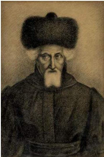
תמונה המיוחסת לבעל הש"ך