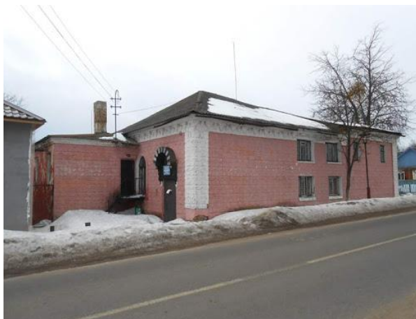
הבית המדרש במוש