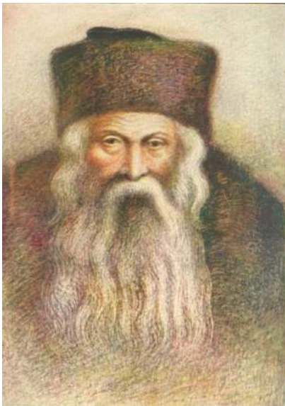
תמונה המיוחסת לבעל הט"ז

רבי יחיאל היה מפרש מה שאנו אומרים בשיר הכבוד 'מדי דברי בכבודך הומה לי אל דודיך'. אל תיקרי בכבודך אלא במכובדיך 101 . מדי דברי בכבודך, 'אז איך רעד פון דיינע מכובדים שהם הצדיקים', הומה לי אל דודיך, 'הייבט מיר אן די הארץ צו קאכען צו דיר' [כשאני מדבר מהצדיקים שהם מכובדיך, עי"ז הומה לי אליך יתברך] 102 .