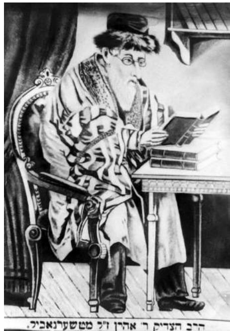
הרב הצדיק ר' אהרן ז"ל מטשערנאבי.

הקאברנינער זי"ע היה נוסע כל שנה לחג השבועות למוש, ובשנה שאחר פטירת הרה"ק רבי יחיאל ממוש גם כן נסע. ובשעה שרבי יחיאל היה מגיע תמיד לשולחן, היה קם הקאברנינער לכבודו. וגם בשנה זו הוא קם. 92