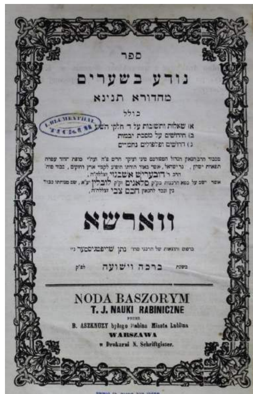
שער ספר נודע בשערים לר' בעריש אשכנזי

כשראה אותו אביו בכך, אמר לו מהיום אני לא עוד יותר אביך.. והיה לו צער גדול מזה, ונסע להלעכוויטשער, אמר לו