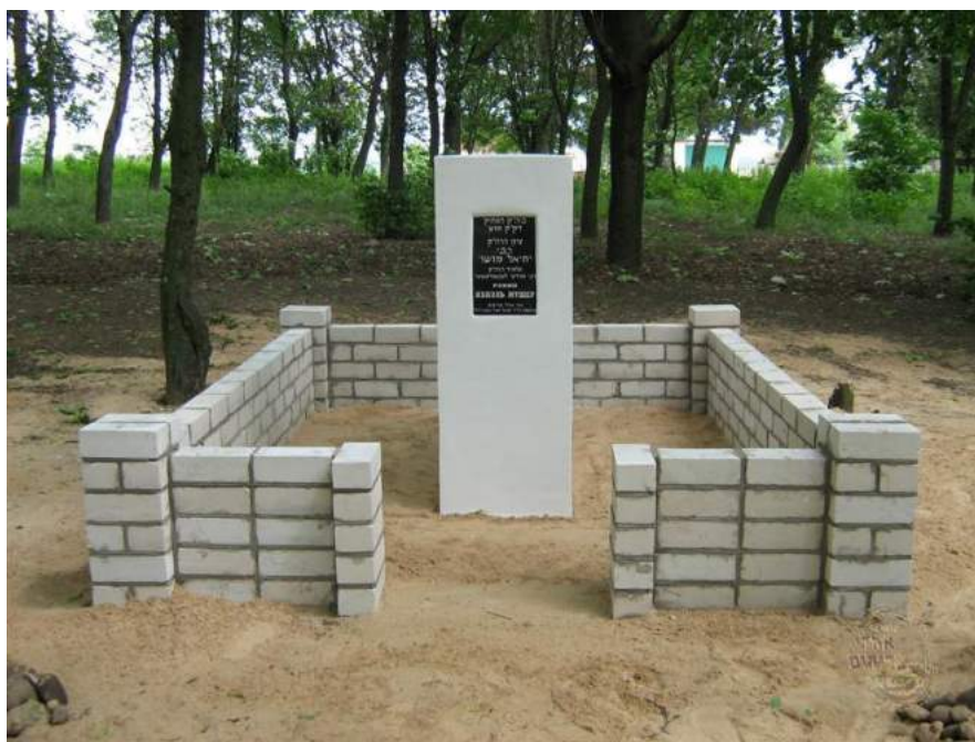
המציבה כהיום שופץ ע"י אגודת אהלי צדיקים