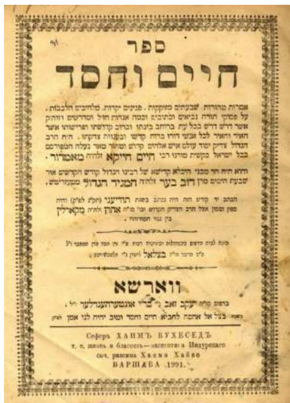
שער ספר חיים וחיים להרה"ק מאמדורא