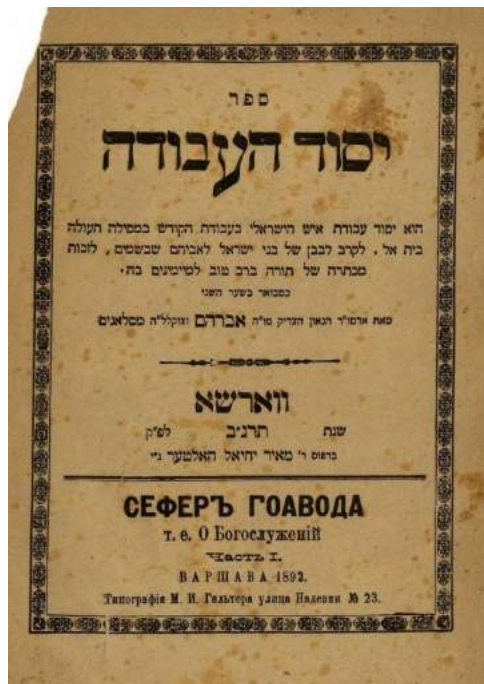
שער ספר יסוד העבודה

הוא היה אומר: בפרשת וירא סוף סוף יש כבר נחת להקב"ה, שבפרשת בראשית יש את הדור המבול, ובפרשת נח את דור ההפלגה, וכן