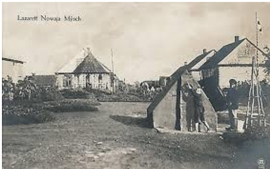
ממראות השכונה היהודית במוש