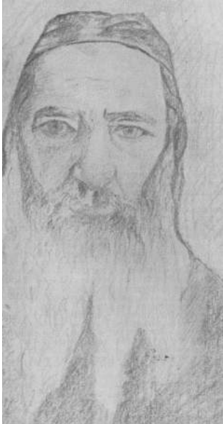
תמונה שיש מיחסים אותו להרה"ק מקאברין

במוצאי שבת קודש ביקש רבי יחיאל שרבי משה ישאר אצלו על סעודת מלוה מלכה, אך הקאברניער א"ל שבדעתו לשוב אל האכסניא וכי לא יוכל להתעכב עוד. רבי יחיאל הפציר בו, אך לא נעתר לבקשתו.