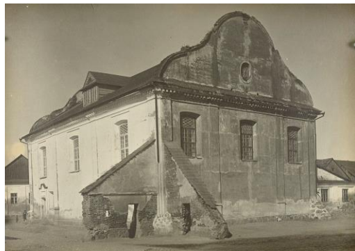
בית המדרש הישן בקלעצק