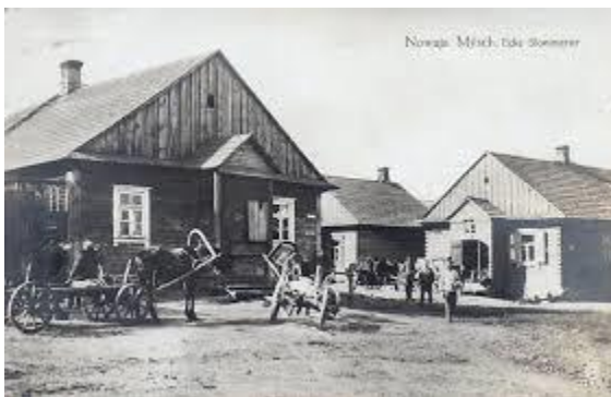
רחוב היהודים במוש

כל זמן שרבי יחיאל שימש כרב העיר מוש לא פרצה שריפה בעיר, ולא מת אדם בחצי ימיו, ולא היה בו דבר ומגיפה. פעם אחת פרצה מגיפה בעיירה סמוכה למוש, ובאותה תקופה מתה במוש גופא, עלמה אחת צעירה לימים.