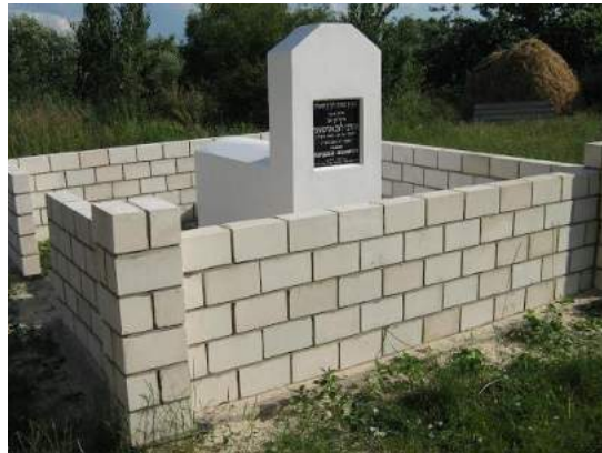
ציון הרה"ק מלעכאויטש