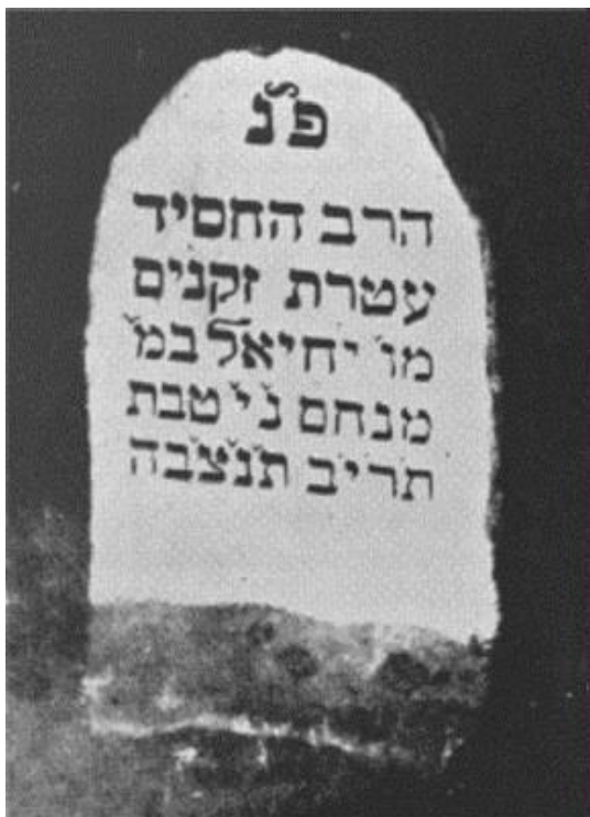
נוסח המציבה הישן

ויאסף רבי יחיאל אל עמיו, זקן ושבע ימים, בן פ"ד שנה, ביום ו' ערשב"ק שחל בו תענית עשרה בטבת שנת תרי"ב לפרט "בסוד קדושים ועד" לפ"ק 196 . מבלי להניח אחריו זרע של קיימא 197 . זי"ע.