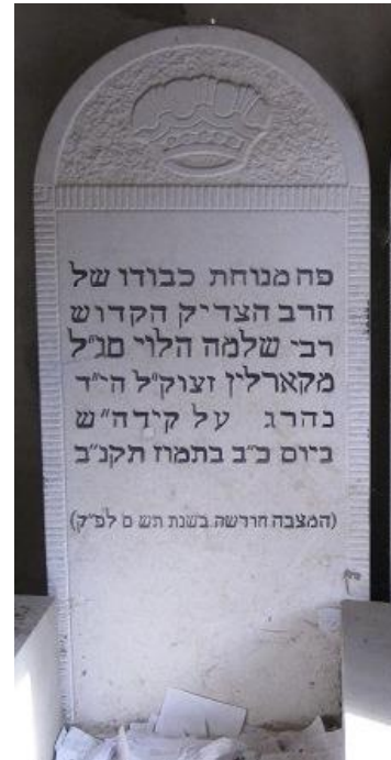
ציון הרה"ק מקארלין בלאדמיר

רבי יחיאל סיפר שהרה"ק מקארלין זי"ע הי"ד חילק פעם לאנשיו אחר התפילה לעקאך ויין שרף. הגיע לפניו איש אחד שהלך עם הטלית ותפילין בידו, והושיט את ידו וגם ביקש מהק' שיתן לו גם כן, ולא נתן לו. ואמר לו הק' 'זיי גייען ארום מיט ביטערער הערצער, זיי ווייסען אז זיי האבען נאך גארנישט געטאהן, דארף מען זיי דערקוויקען וכו'. אבער דו האסט דאך געדאווענט און געלערנט, פארוואס קומט דיר' וכו' 106 .