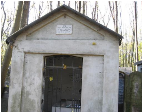
האווהל הישן שעל ציון המהר"ש מסלאנים בבביה"ח בווארשא

האדמו"ר מהר"ש מסלאנים זי"ע סיפר שרבי יחיאל היה אומר לעצמו בזה"ל: 'מילא יראת שמים האסטו נישט, האב חאטש'ע בוושה ודרך ארץ פאר'ן רבונו של עולם'. 62