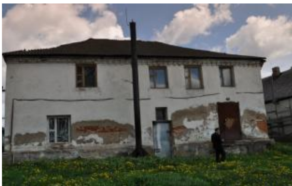
בנין בית החסידים במוש

אח"כ התבטא רבי יחיאל לפני אחד ממקורביו, הסובר אתה שזה מופת? לאו דוקא, אלא שבעת שעמדתי בתפלת שמונה עשרה 50 עלה כמה פעמים במחשבתי..פולווער..פולווער, וחשבתי מה לי ולצרת הפולווער, וכי שלחתי את ידי במסחר הפולווער? והבנתי שמן הסתם עלה במחשבתי לצורך אנשי העיר וכי צריך להוציאם מהבתים, ועל כן צויתי להוציאם 51 .