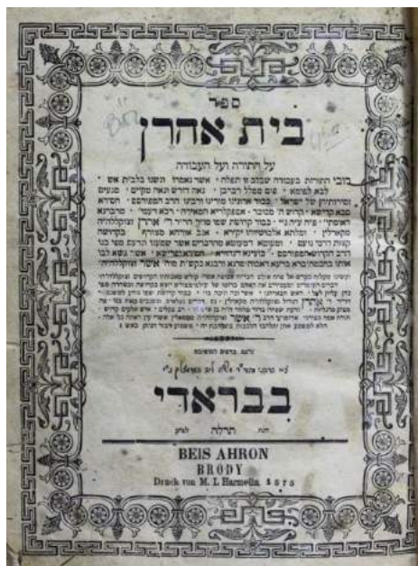
שער ספר בית אהרן

רבי יחיאל התבטא פעם על הרה"ק רבי משה מקאברין זי"ע: 'פון פאר א יארן ביז היינט.. אהא! אהא! די מצוות הייבען איהם, און ער הייבט די מצוות. מיר דארפען צו ביידען נישט אנקומען' (כוונתו היתה להרה"ק מקאברין ולהרה"ק רבי שלמה חיים מקוידינוב) מיר קענען לעבען מיט סיפורי מעשיות פון לעכוויטש'ער. [מאשתקד ועד היום, אהא, אהא, המצות שהוא מקיים מעלים אותו למדריגות נעלות, והוא מעלה את המצות. אולם אני איני צריך לשניהם, שכן די לי עם הסיפורים של הרה"ק מלעכוויטש] 144 .